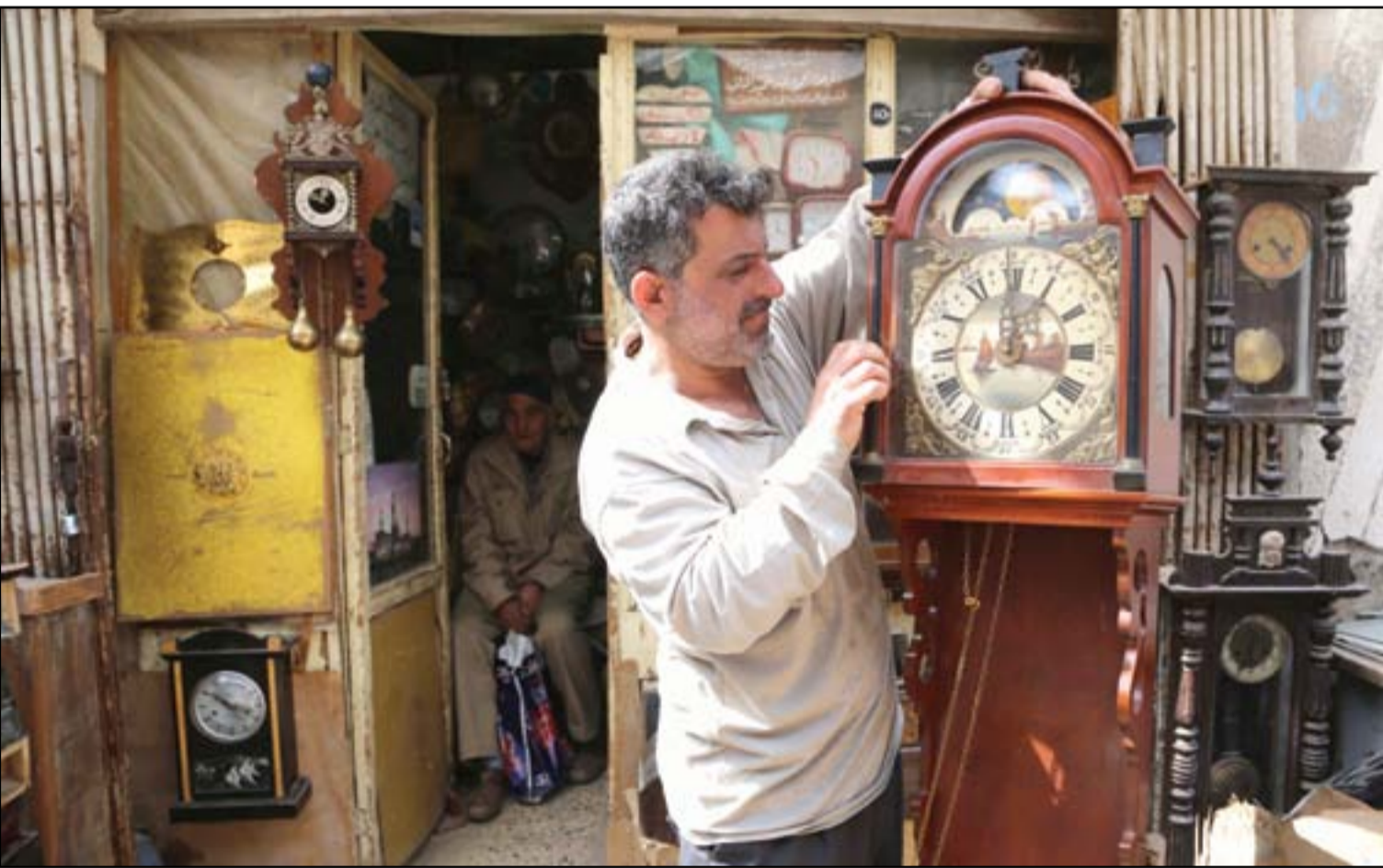
إصلاح الساعات "الأنتيكة" مهنة لا يجيدها إلا محترف...

6 ثامر الهيمص يكتب: ظاهرة العشائرية.. وآفاق التنمية