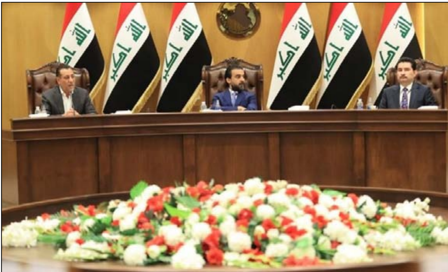
رئاسة البرلمان تقرر تأجيل رئاسة اللجان لما بعد تشكيل الحكومة

واللجنة الواحدة بما لا يزيد عن 17 عضواً، والبرلمان الذي سبقه 24 عضواً.