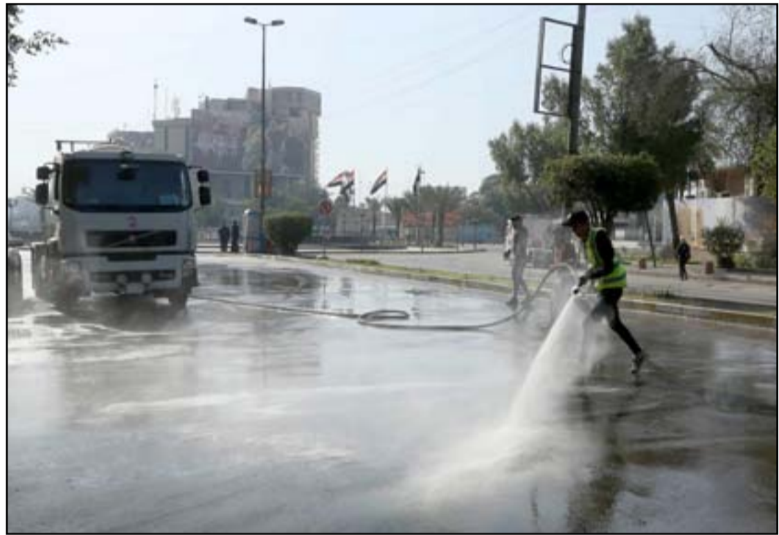
امانة بغداد تباشر بحملة تنظيف لشوارع العاصمة بعد زيارة الامام الكاظم..

أكد وزير الشباب والرياضة، رئيس الاتحاد العراقي لكرة القدم، عدنان درجال، أن الاتحاد الدولي للعبة أعلن موافقته الرسمية على إقامة مباراة منتخبنا الوطني أمام نظيره الإماراتي في ملعب المدينة الدولي في بغداد، وهي مباراة تقام ضمن التصفيات الآسيوية المؤهلة إلى نهائيات كأس العالم. وقال درجال: أبلغت رئيس مجلس الوزراء، مصطفى الكاظمي، هاتفياً بالإنباء، وقدم التهنئة للرياضة والرياضيين العراقيين، مؤكداً أن بغداد وجميع المدن العراقية مستعدة لاستقبال الأشقاء والأصدقاء من كل العالم بترحاب كبير.