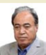
البيدييات المدرسية في علم المجتمع تلقي باللائمة على النخب التي تقود تلك الاقدار وتحمل الجمهور اوزارها وانانياتها واحلامها المريضة