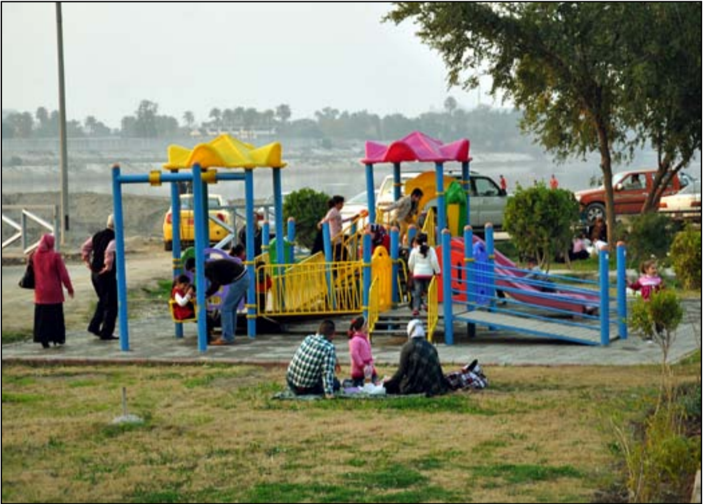
المنزهات تستعد لاستقبال الربيع في بغداد .. عسدة: محمود رؤوف