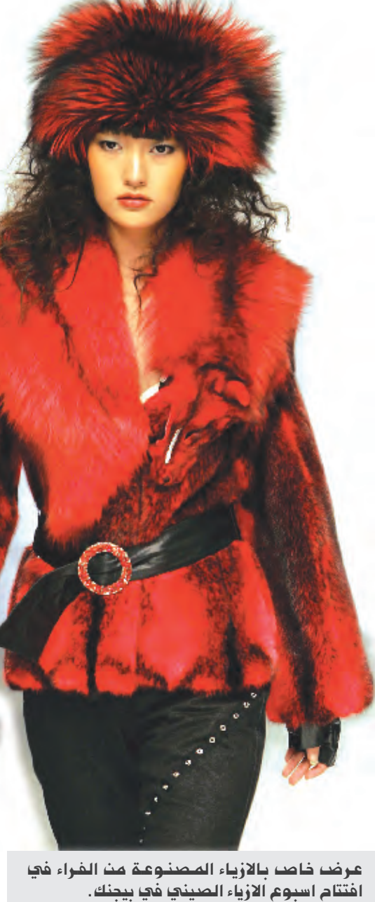
عرض خاص بالازياء المصنوعة من الفراء فيا افتتاح اسبوع الازياء الصيني فيا بيجنك.

الحالات. لكن وعلى الرغم من أن الاضرار التي لحقت بساعة الرمل نتيجة سقوط حامل الكاميرا لا تذكر إلا أن الحادثة سببت استياء كبيرا واعتبر اهمالا وعدم تقدير للمعتقدات الدينية القديمة. وماشو بيشو من المناطق التي تضم أكثر المعالم الدينية لشعوب انكا وتقع تحت رعاية وحماية منظمة الأونسكو حيث يجري العديد من البيرونيين طقوسهم الدينية فيها. وبنى شعوب انكا الساحة الواسعة جدا في القرن ال 15 ميلاديا على جبل يرتفع حوالي 3300 متر من أجل منع هجوع شعوب الامازون، ويعتقد انها استخدمت كي تكون مدينة دينية لهم. والحجر الذي يتوسط الساحة واسمه حجر الشمس انتهبوا اتانا كان مركزا لعلم الفلك والاجراء المراسيم الرسمية عند الانتقال من فصل الشتاء إلى فصل الصيف، لذا يمنع منعاً باتا دخول السواح إليها وهم سكارى.