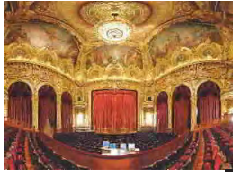
قاعة (اوبرا غارنو) فيا مونت كارلو بعد تجديدها.. وقد افتتحت من قبل الامير البروت الثاني امير موناكو.. صممت القاعة عام 1879 من قبل المصمم جارسيس غارنو، وقد كلف تجديدها 26.٠ مليون يورو واستمر العمل فيها مدة سنتين.

زينا مت تصميم احد المصممين الصينيين خلال اسبوع الازياء السنوي، حيث لم يكن تصميم الازياء شائعا اثناء فترة الحكم الشيوعي، لكنه ازدهر منذ عقدين من الزمان بعد بداية الاصلاحات الاقتصادية حيث اصبحت الصين سوقا عالمية جديدة للازياء