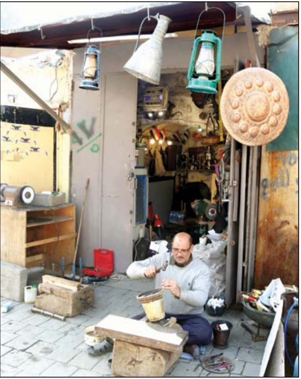
مهنة النقش على المعادن تكافح من أجل البقاء...

تعتزم اطراف في مجلس النواب تقديم المسؤولين عن حوادث العنف التي رافقت تظاهرات تشرين التي جرت قبل عامين الى القضاء، فيما يشكك ناشطون بتلك المساعي. وصوت البرلمان قبل ايام على تشكيل لجنة حول ما جرى في تظاهرات 2019، لكن شكل الاخيرة لم يتم تحديد ملامحه حتى الان، وهناك تفاوت في الاراء بين النواب حول طبيعة اللجنة. ويتوقع ناشطون، ان يكون مصير اللجنة كالسابقات بسبب تدخل جهات سياسية في عملها وعدم قدرة الجهات الحكومية على تنفيذ اوامر الاعتقال بسبب تلك الضغوطات.