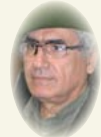
■ رشيد الخيون

استهل الرئيس الروسي فلاديمير بوتين، الهجوم على أوكرانيا، بخطاب حشد فيه التاريخ، طامحا في العودة إلى ما قبل حقبة الاتحاد السوفييتي، معرجا على المذهب الديني، جاء في خطابه: «أوكرانيا ليست دولة جارة فحسب، إنما هي جزء من تاريخنا، بروسيا القيصرية كان هناك ما يسمى الروس والمسيحيين، وهذا كان تاريخ روسيا القيصرية. لكن أوكرانيا المعاصرة بشكل كامل ومفصل قد شكلت من قبل روسيا الشيوعية، التي قامت عام ١٩١٧ بانتهكات بحق روسيا، وحولت إلى كيان الاتحاد السوفييتي، وستالين ضم لأوكرانيا أراضي روسية.. ثم جاء خروشوف ومنح أوكرانيا جزيرة القرم، ولكن كل ذلك كان الاتحاد السوفييتي» (بث الخطاب من قناة العربية مترجما)، معلوم أن فكرة قيام الاتحاد السوفييتي كانت تقوم على مبدأ «الأممية، والتي تتجاوز الوطنية، على اعتبار أن الطبقة العمالية، التي هي عماد النظام، لا تؤمن بالحدود الجغرافية، وحسب خطاب بوتين كان ستالين يُهدّي «الأراضي والشعوب» لتشكيل الاتحاد الأممي السوفييتي، فالحدود للعقيدة لا للجغرافيا، وبهذا يحتج القوميون عندما كانوا يناصرون مصر النصرانية داخل العراق، وحيث يمتد بتطلعاتهم، رافعين الشعار وصورة الزعيم القومي ضد بلدهم.