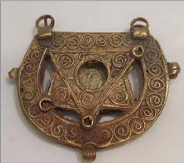
قرط مكتشف في الحلة، بين القرنين ١١م - ١٢م

هذا القرط محفوظ في متحف المتروبوليتان برقم ٩٥.١٦.٢ (٣٠)، مصنوع من الذهب، الأبعاد: الارتفاع: ٢,٢سم. القرط يعز عن المرويات والسرديات في الكتب التاريخية عن حلي المرأة، خاصة القرط والشنف. في لسان العرب أن «القرط هو