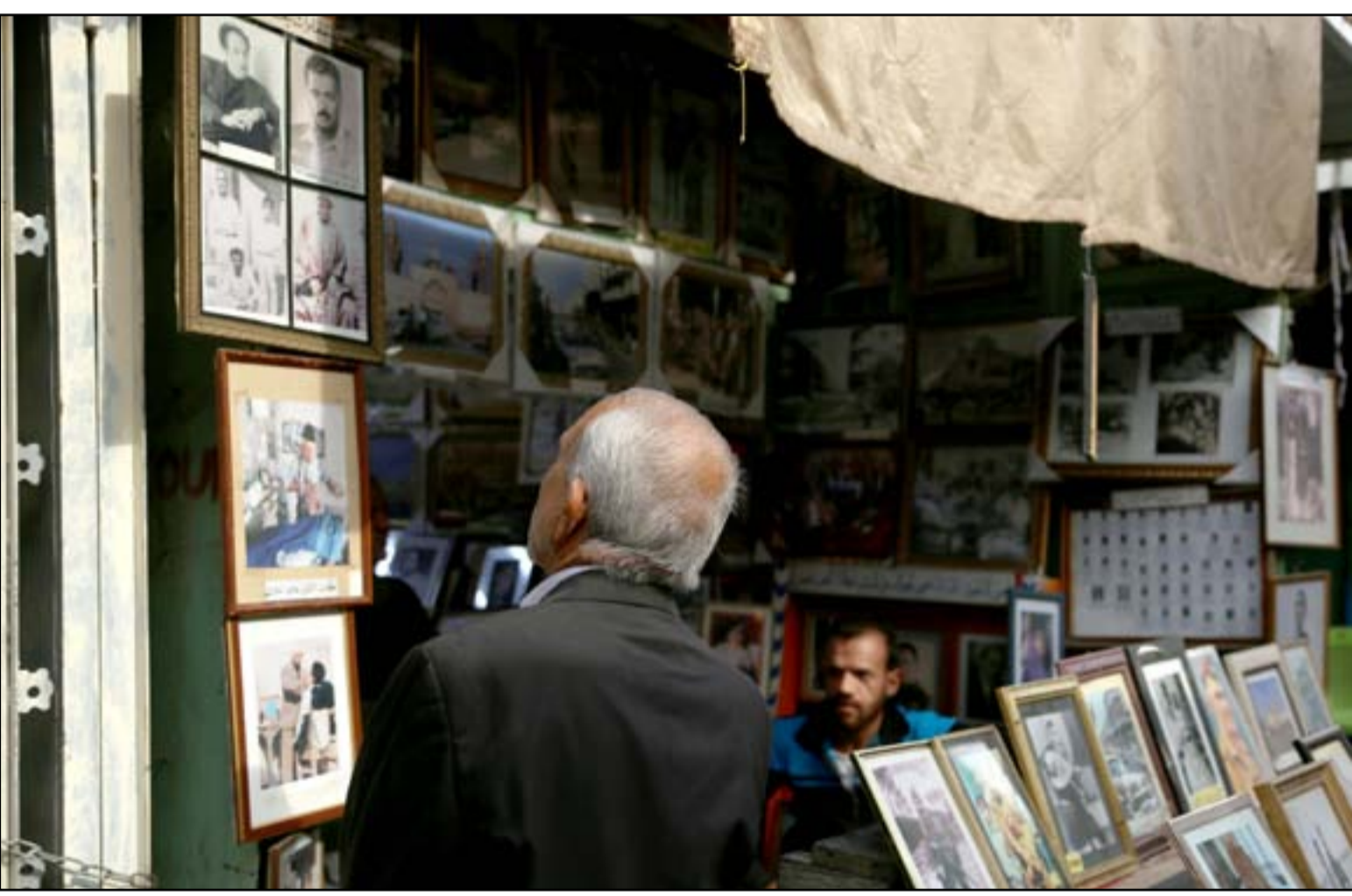
صور تاريخ العراق تلقى رواجاً في الاسواق...

6 محمد حميد رشيد يكتب: طائفون... ليسوا إسلاميين 6