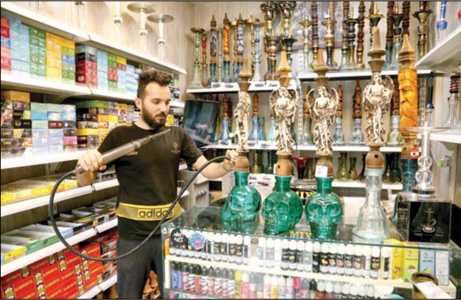
رغم المخاطر الصحية.. تزايد اقبال الشباب على "الراكيل" ... عسة: محمود رؤوف