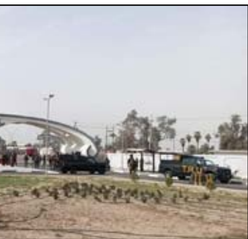
احتجاجات كركوك يوم أمس

مصطفى الكاظمي، بأن الوقت قد حان لتحقيق حلم مواطنينا، افتتاح مطار كركوك منجز لجميع العراقيين".