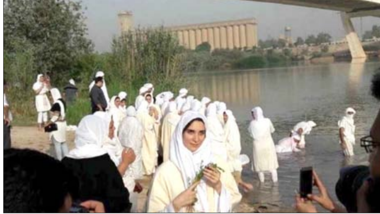
جانب من احتفالات الصابئة على ضفاف الانهر

وتأتي البنجة بعد الثلاثين من شهر شملته المندائي وقيل اليوم الأول من شهر قينة وأيامها غير متطابقة مع التقويم الميلادي فهي تتغير كل أربعة أعوام كون أشهر التقويم المندائي تتكون من ثلاثين يوما فضلا عن أيام البنجة الخمسة. ويقدر عدد أبناء الطائفة المندائية في محافظة ذي قار قبل عام ٢٠٠٣، بنحو ثلاثة آلاف نسمة، إلا ان اعدادهم تقلصت الى نحو ١٠٠٠ نسمة في الاعوام الاخيرة بسبب الهجرة الى الخارج او النزوح الى اقليم كردستان لأسباب أمنية وتجارية وغيرها، وهم يتوزعون حاليا على مناطق الناصرية وسوق الشيوخ والشرطة وغيرها.