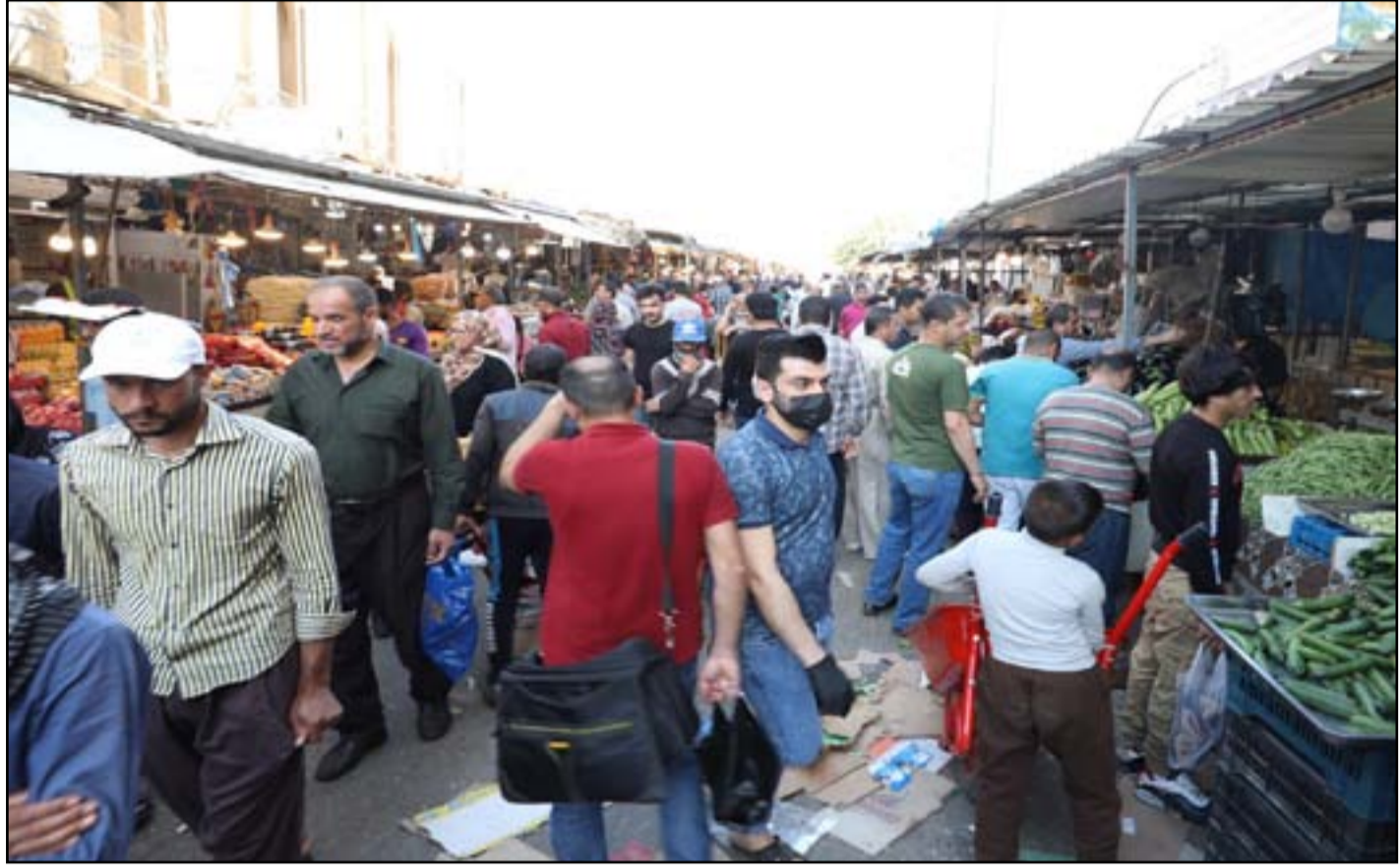
جهود حكومية للسيطرة على ارتفاع الاسعار