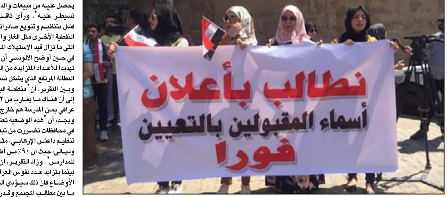
تزايد معدلات البطالة في العراق بحسب المؤشرات العالمية

هذا يعني ان على الحكومة ان تخلق وبشكل عاجل فرصا بمعدل متعذر تحقيقه، خصوصاً في القطاع الخاص، هذا من شأنه ان يترك شريحة الشباب غير مهية للتنافس للحصول على وظائف على المستوى الإقليمي والعالمي، وسبب ذلك يعود لعدم امتلاكهم المهارات الضرورية التي تتطلبها الشركات والمؤسسات الخاصة الأهلية". ونقل التقرير، عن مراقبين تأكيدهم "أن الحكومة العراقية تواجه تحديات ضخمة على مختلف الأصعدة في تهيئة البلاد إزاء تزايد تعدادها السكاني تتراوح ما بين تحديات الامن الغذائي والتنوع الاقتصادي وتنمية وتطوير البنى التحتية، وأن توفير السلة الغذائية يشكل أصلاً عبءية كبيرة في البلاد رغم امتلاكها أراضي زراعية واسعة". وأوضح، أن "عوائل الزراعة في العراق خلال حقبة الحرب على داعش بين عامي 2014 و2017 تراجعت بمعدل النصف تقريبا وذلك من 15 مليار دولار إلى 7.6 مليار دولار، استناداً لتقرير صادر عن المجلس الأطلسي للبحوث في الولايات المتحدة".