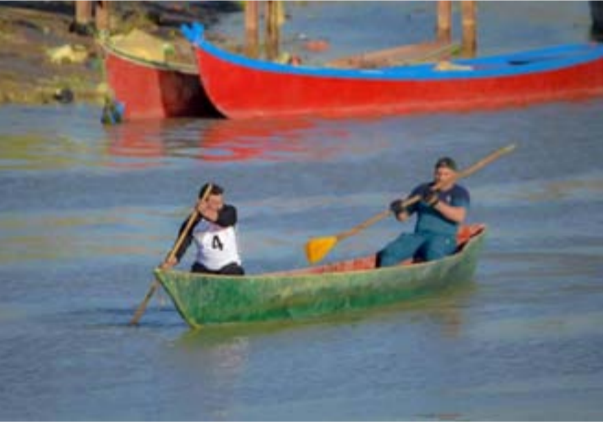
تنافس ودي شهدت فعاليات المشاحيف في ميسان