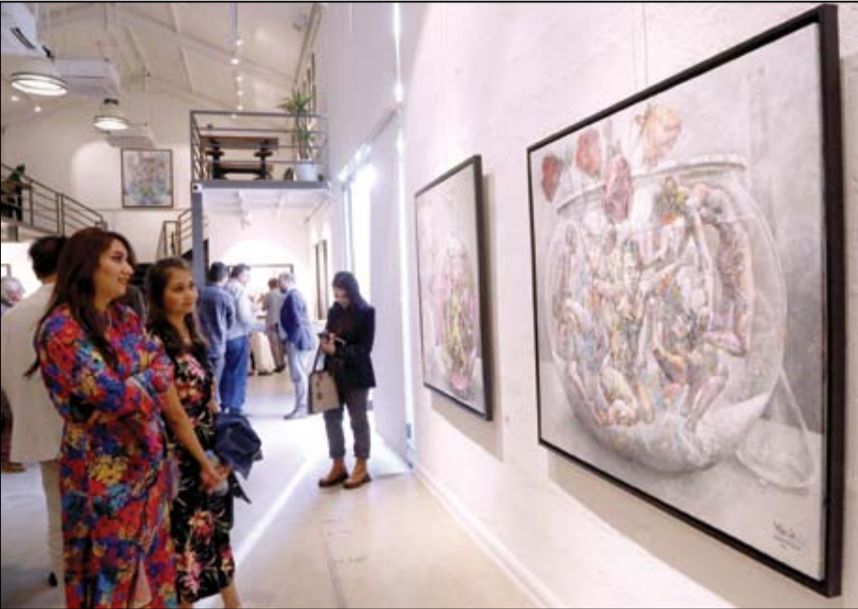
عودة الحياة الى صالات عرض اللوحات الفنية في بغداد ... عدسة: محمود رؤوف

والأعراف الدولية، والتوجيه بتشكيل لجنة من مستشارية الأمن القومي وعدد من القيادات الأمنية، لتقديم تقرير عن تداعيات القصف وجمع الحقائق والأدلة". وتابع أن "الكاظمي تفقد الموقع الذي تعرض للاعتداء الصاروخي والتقى بالأهالي الذين يؤول لهم الموقع، واستمع لشرح مفصل قدمه عن المكان وما يحتويه وعائديته". وأكد الكاظمي بحسب البيان، "ضرورة احترام سيادة العراق