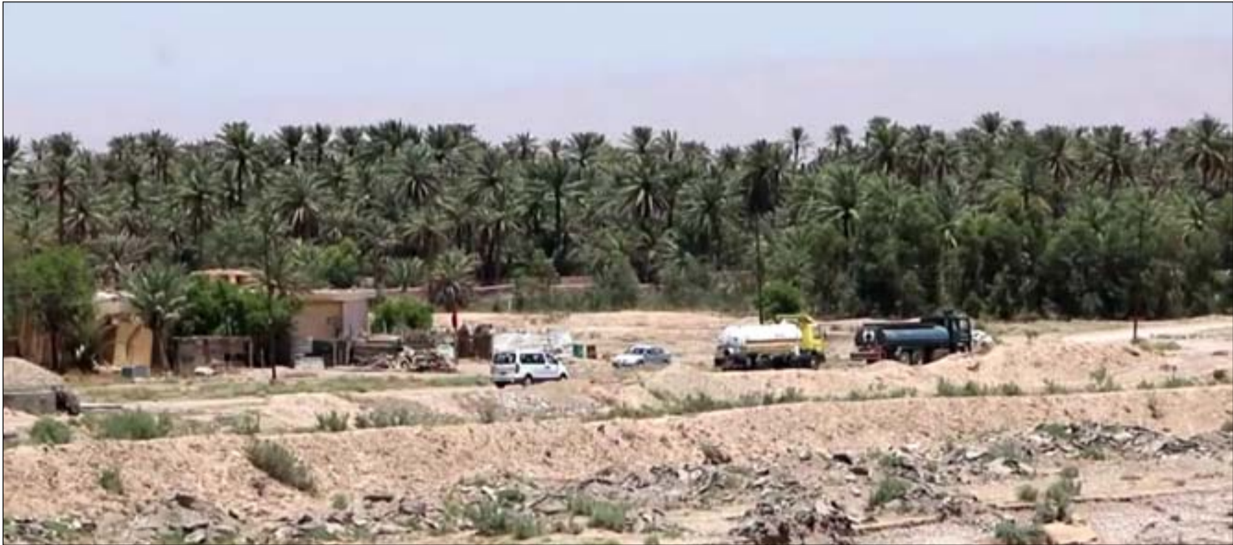
مناطق واسط الزراعية تعاني من أمهال واضع

مياه الشرب والاستخدامات المنزلية. وأكد، أن بقاء الحال بهذه الصورة لن يستمر طويلاً وستكون هناك وقفة للأهالي تبدأ بالتظاهر السلمي والمطالبة بالحقوق المشروعة وقد يصاحب ذلك تصعيد في حال استمر الإهمال وعدم الاهتمام بالمطالب المشروعة لأبناء القرية التي أصبحت لا تتعدى غير حصولهم على الماء متناسين نقص الخدمات الأخرى".