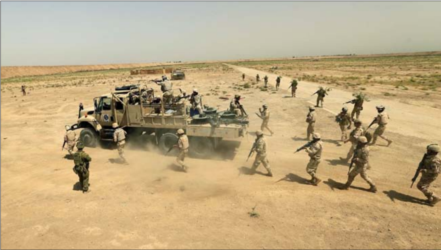
الجيش العراقي يواصل ملاحقة عناصر داعش في المناطق الصحراوية

وتسبب التقرير، على أن "الإجراءات الأمنية المحلية المتخذة في العراق قد حدثت من تأثير التنظيم واقتصر عملياته على المناطق النائية والريفية". ونوه، إلى أن "القاء القبض على المسؤول المالي للتنظيم في تشرين