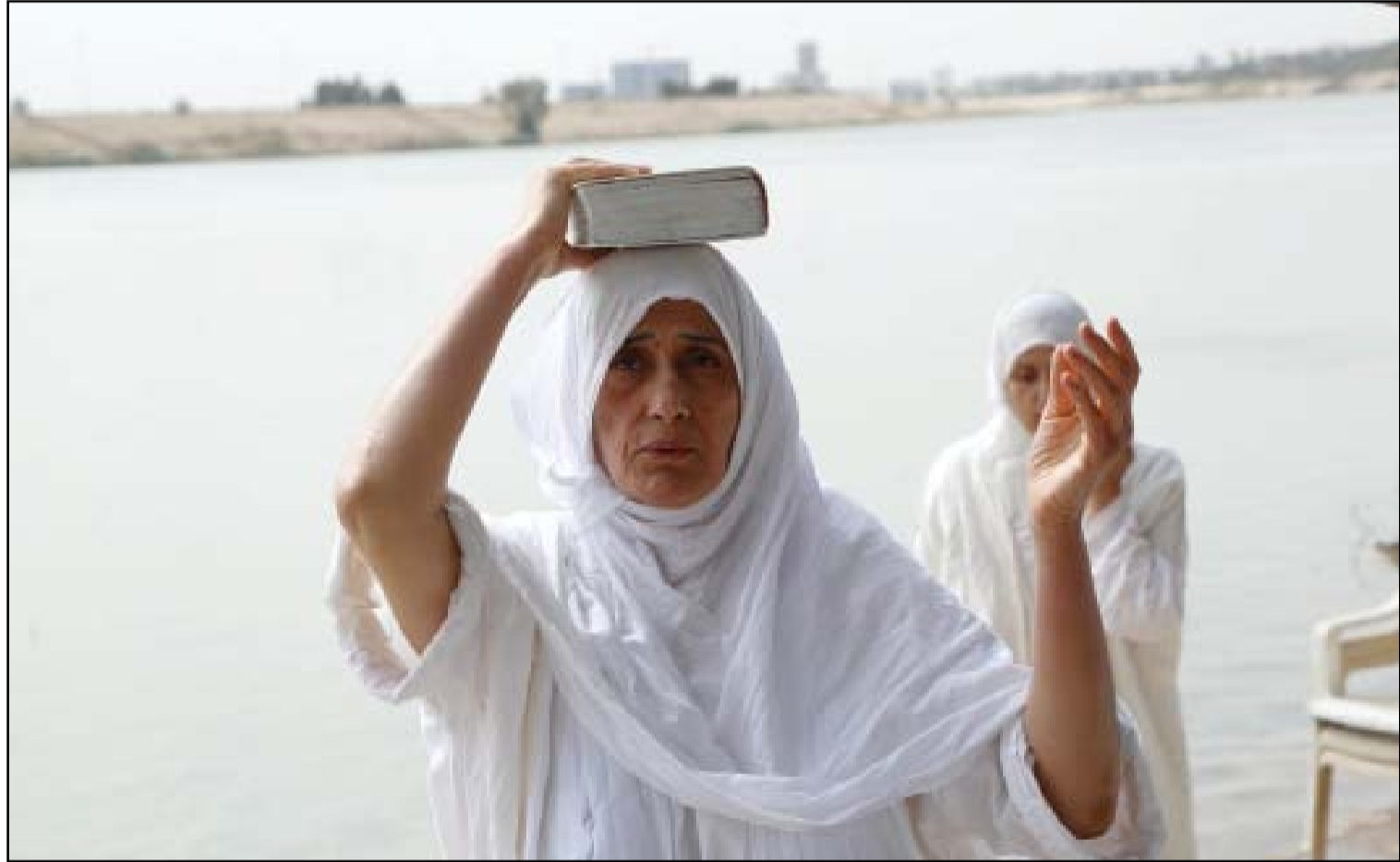
ابناء الصابئة المدائنية يحيون طقوس عيد الخليفة.