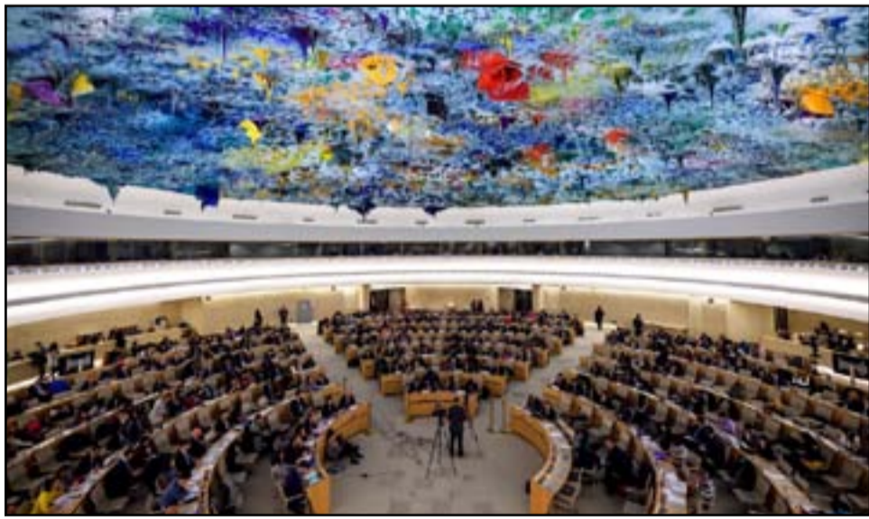
اجتماع سابق لمجلس الامم المتحدة لحقوق الانسان

نوعية بإسناد من الخارج. وزعمت الحكومة الروسية أيضاً الخميصة بأن أوكرانيا كانت بطور إنتاج سلاح نووي وإن الولايات المتحدة كانت على علم بذلك.