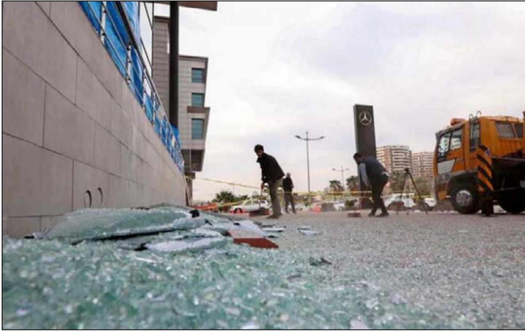
أضرار الهجوم الإيراني في أربيل