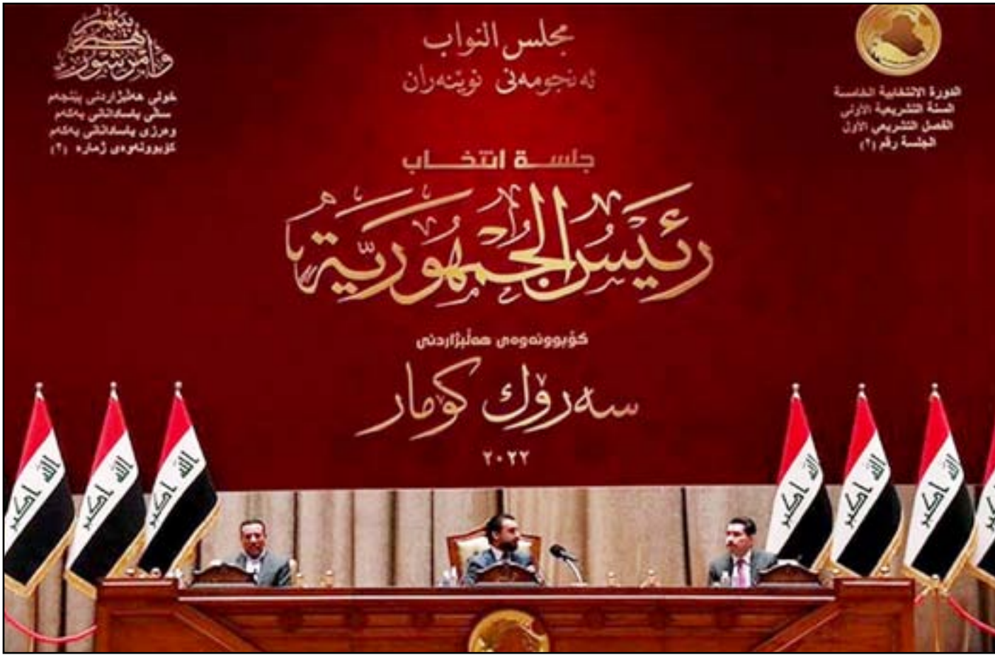
رهان النصاب يسمم جلسة انتخاب رئيس الجمهورية السبت المقبل

وتشير مصادر من داخل التحالف إلى أن الأخير "سيقاطع جلسة السبت" ويعول على قوى أخرى في تحقيق الثلث المعطل وهو ١١٠ مقاعد على الأقل. ويخشى تحالف الإطار التنسيقي، ما يعتبره مؤامرة «خليجية-غربية» لإبعاد الشيعة عن الحكومة بشكل تدريجي. ويفترض "التنسيقي" وفق المصادر أن هناك محاولات لإقناع الرأي العام بأن ليس من الضرورة أن تكون مسيطرا عليها من الشيعة، ونم الحكومة التي تليها يمكن أن لا تكون شيعية". ويستند "الإطاريون" في ذلك إلى أن السنة هم من يسيطرون على الحكومة التي يرغب "الصدر" في تشكيلها مع التحالف الثلاثي.