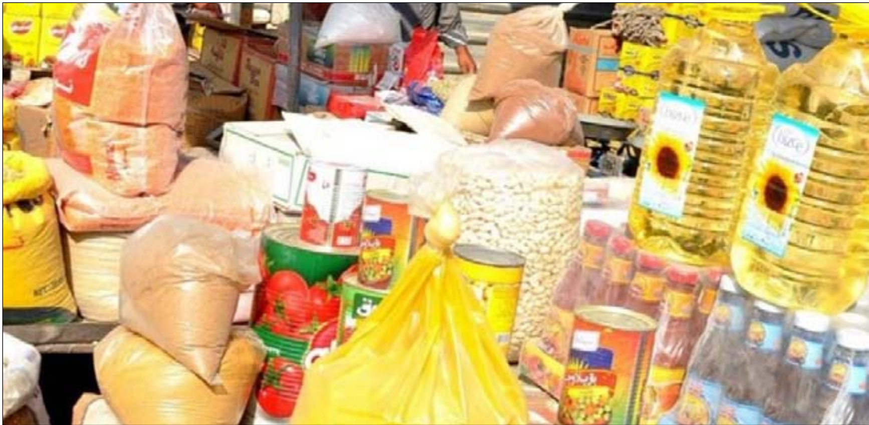
الحكومة تواجه ارتفاع الاسعار بتوزيع مفردات البطاقة التموينية

وأضاف التقرير، أن "معدلات أسعار المواد الغذائية ارتفعت بنسبة 20.7% عن معدلاتها في العام الماضي". وأشار، إلى أن "أثار جائحة كورونا بينما بدأت بالتراجع على مستوى العالم وتعافى الاقتصاد العراقي من أثار هذا الوباء، فإن انحسار هطول الأمطار للموسم 2020-2021 وفشل زراعة المحاصيل في المناطق المعتمدة على الأمطار كان له تأثير سلبي على اقتصاد المناطق الريفية". وشدد التقرير، على أن "احتياجات البلد المائية في حوضي دجلة والفرات قد تراجعت كثيراً جراء موسم جفاف لم يشهده البلد منذ 40 عاماً". ونوه التقرير، إلى أن "الحكومة اضطرت لتقييد زراعة محاصيل الحبوب وخفضها بنسبة 50% عن معدلات العام الماضي لغرض تأمين مياه الشرب كأولوية". ونوه، إلى أن "المحاصيل التي تتطلب زراعتها كميات وفيرة من المياه مثل الرز والذرة فقد تم تقييدها أيضاً للموسم 2021-2022". وأكد التقرير، أن "أسعار المواد الأساسية الغذائية وغير الغذائية تتأثر جداً بتقلبات الأسعار الدولية، وتقدر منظمة الأغذية والزراعة، الفاو، تراجع انتاج محاصيل الحبوب في العراق للموسم 2020-2021 بنسبة 38% عن الموسم السابق 2019-2020. وأن معدل الاستيرادات للحبوب للعام 2021-2022 ازادت بنسبة 35% عن السنة التسويقية التي قبلها".