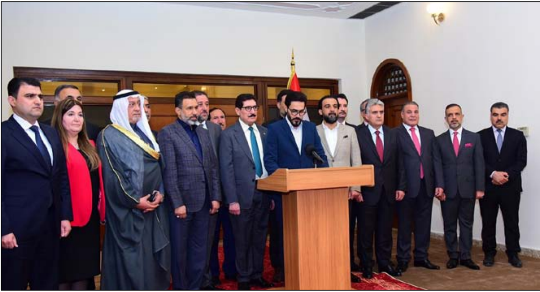
تحالف انقاذ وطن عازم على تحقيق النصاب في جلسة الغد

ووصف ما حدث في الجلسة الاخيرة للبرلمان، بأنه «أخطاء» في التواصل مع الجماعات الحايمة والتي لاتزال متحيرة بين طرفي النزاع.