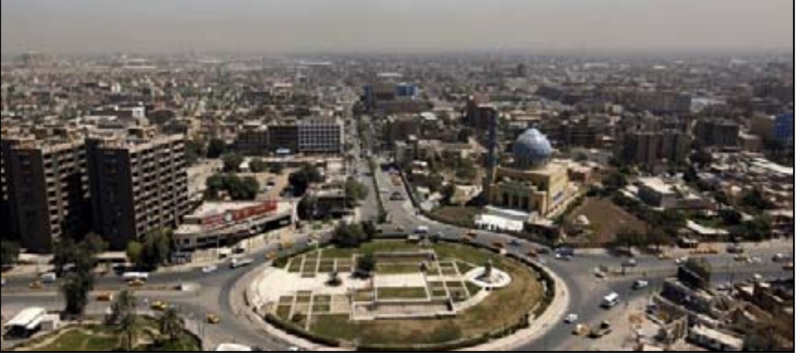
عقارات الدولة ملف تسيير عليه الاحزاب الكبيرة

وتنص تلك المادة على، لـ«البلدية المختصة بعد موافقة وزير البلديات والأشغال العامة وأمانة بغداد بيع الأراضي المخصصة للإسكان ببدل حقيقي وحسب الأسعار السائدة لمثلثاتها والمجاورة تقدره لجنة التقدير المنصوص عليها في هذا القانون وبدون مزايده علنية إلى العراقيين الذين لا يملكون هم أو أزواجهم أو أولادهم ممتلكات عامة إلى ممتلكات شخصية».