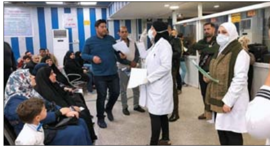
معدلات التفقيح ما زالت دون مستوى الطموح