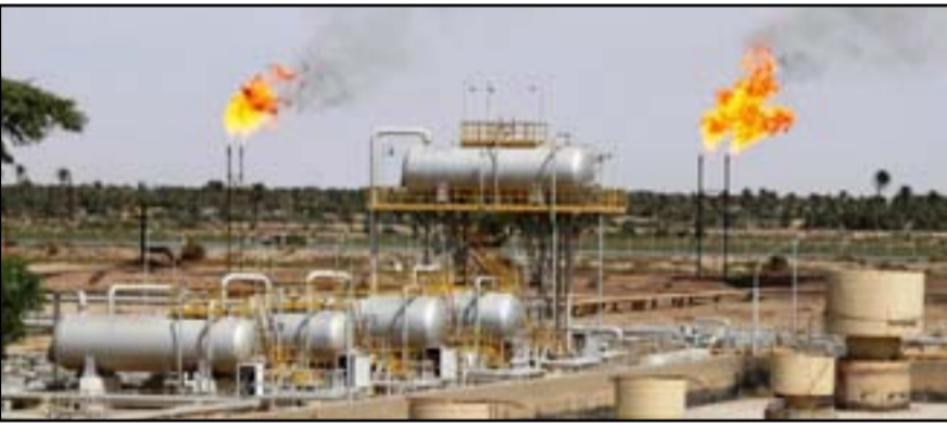
نحو 9 مليارات دولار عائدات العراق النفطية الشهر الماضي

وأشارت الإحصائية إلى أن «مجموع الكميات المصدرة من النفط الخام لشهر شباط الماضي بلغت 91 مليوناً و314 ألف و828 برميلاً، فيما كانت الكميات المصدرة من نفط كركوك عبر ميناء جيهان مليوناً و475 ألفاً و345 برميلاً، لافتاً أن «معدل سعر البرميل الواحد بلغ 94.936 دولاراً».