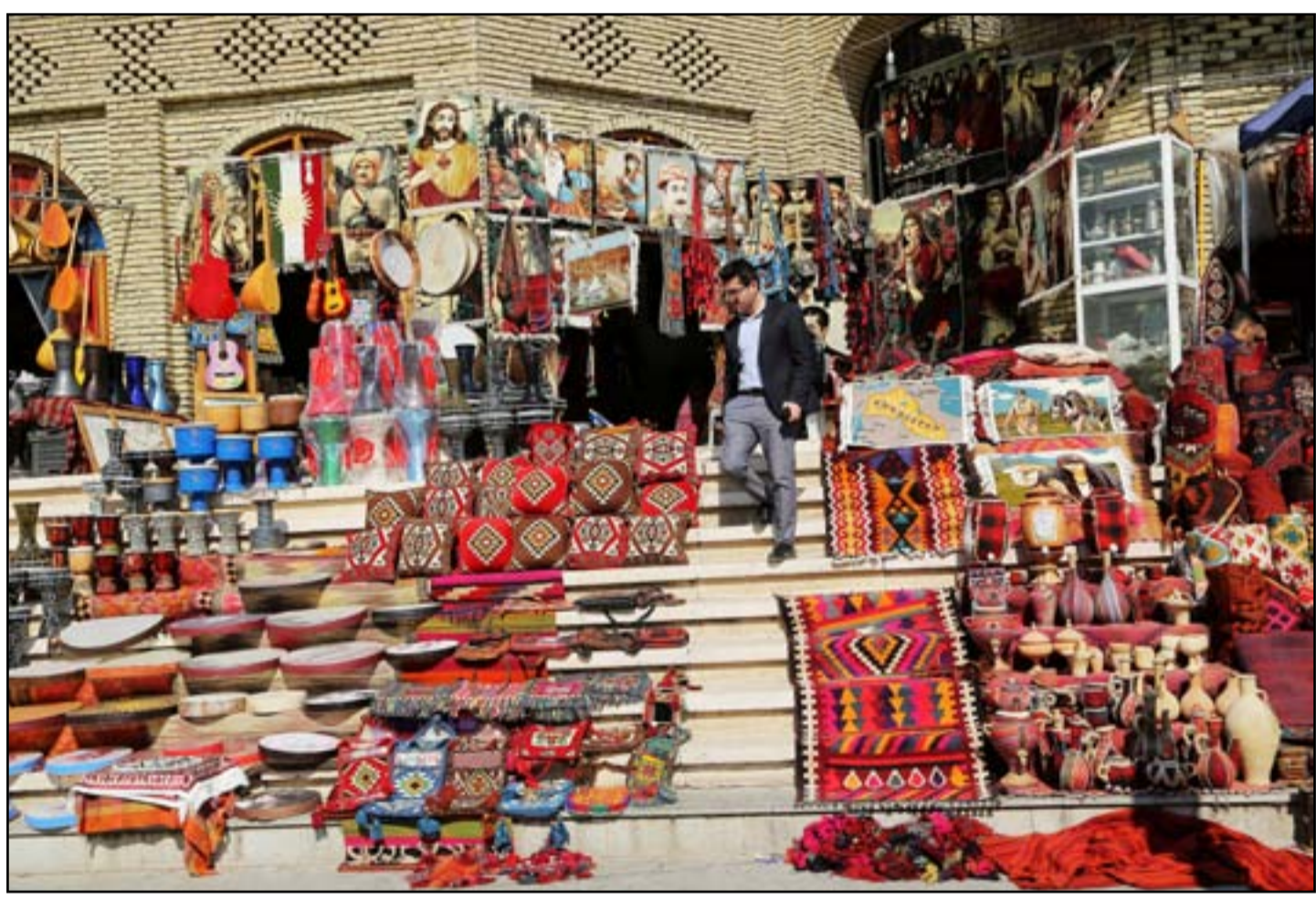
الصناعات الشعبية تزدهر في اسواق اربيل...