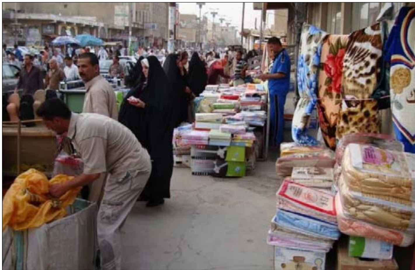
واسط تواجه غلاء الاسعار بمجموعة اجراءات

- منع دخول البيض والدجاج والأسماك إلى واسط وذلك لأن