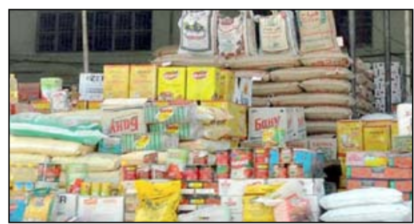
العراقيين يعتمدون على البطاقة التموينية في أمنهم الغذائي

ويجد الحلو، ان "حل هذه المشكلة من خلال تأمين وصول الحاصل التموينية إلى المواطنين بأسرع وقت ممكن".