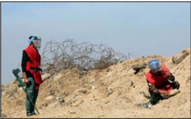
الالغام من أهم التحديات في البلاد

ثمانينيات القرن الماضي وأثار احتلال تنظيم داعش مناطق عراقية.