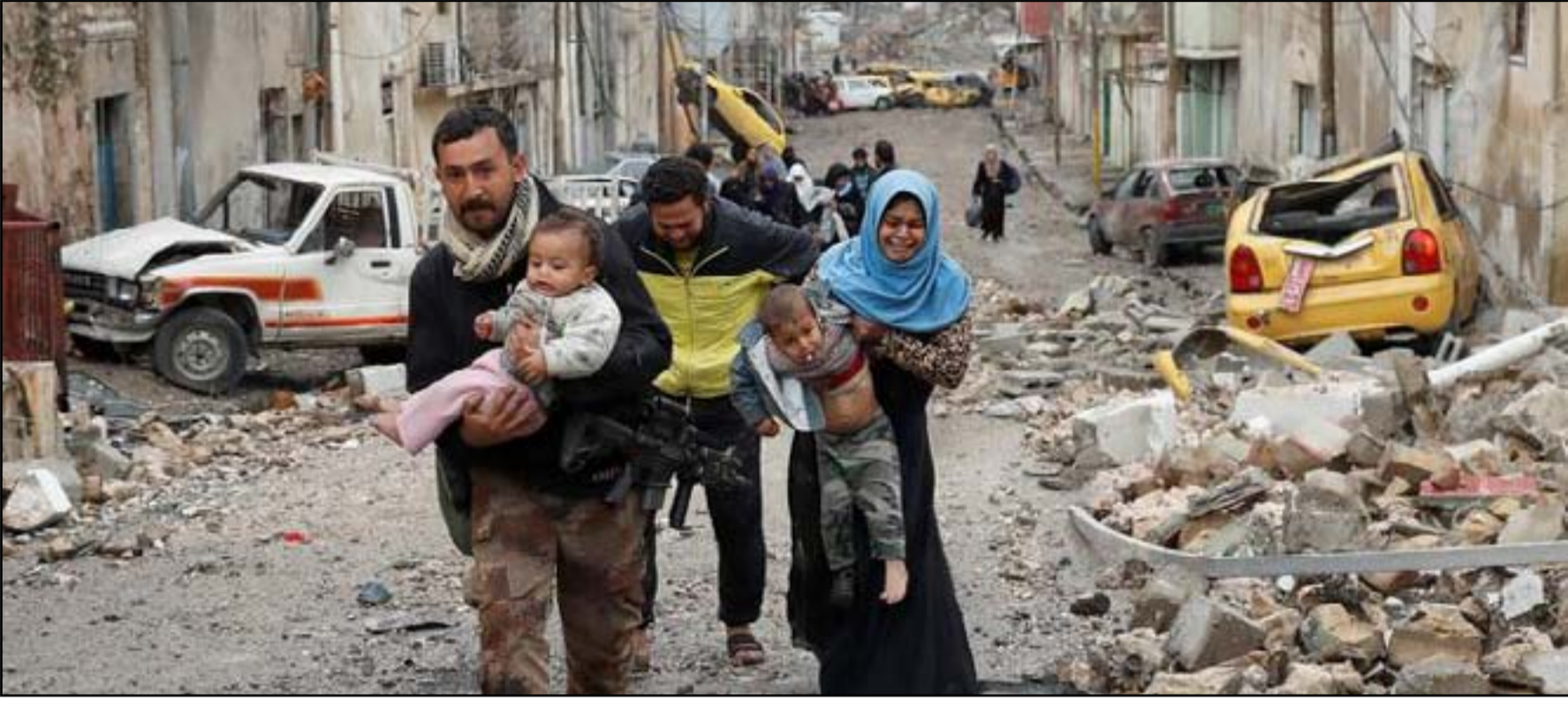
عنصر أممي يساعد مدنيين على الهرب أثناء معركة تحرير الموصل

أيضاً معالم بارزة أخرى في العراق مثل القصر الجمهوري وساحة الفردوس التي شهدت حادثة إزالة وإسقاط تمثال رئيس النظام السابق من قبل القوات الأميركية يوم التاسع من نيسان عام ٢٠٠٣. ولفت التقرير، إلى أن "الطالب البريطاني مهتم بالبحث في الحروب