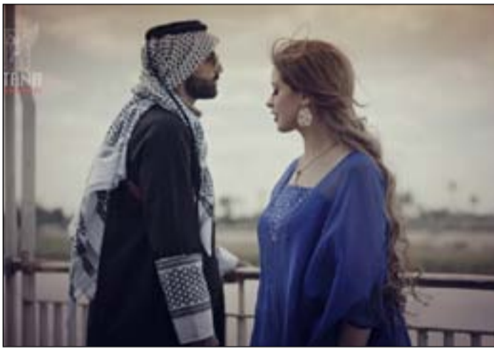
لمعيد كلية الفنون الجميلة بجامعة بغداد مضاد الأسد، قال خلالها: بعض منتجي المسلسلات الدرامية يستغلون وسائل التواصل الاجتماعي بطريقة

وجه مركز الإعلام الرقمي، تحذيراً إلى جمهور مواقع التواصل الاجتماعي في العراق، بشأن الأعمال الدرامية والبرامج الرمضانية. وقال المركز في بيان حصلت (المدى) على نسخة منه، إنه "بالترزامن مع حلول شهر رمضان المبارك، ندعو جمهور وسائل التواصل الاجتماعي في العراق إلى عدم الانسياق وراء الدراما غير الهادفة، ووضع حد لتهاشات منتجي المسلسلات الدرامية على تفاعلية وسائل التواصل الاجتماعي بعيداً عن التوعية بقضايا