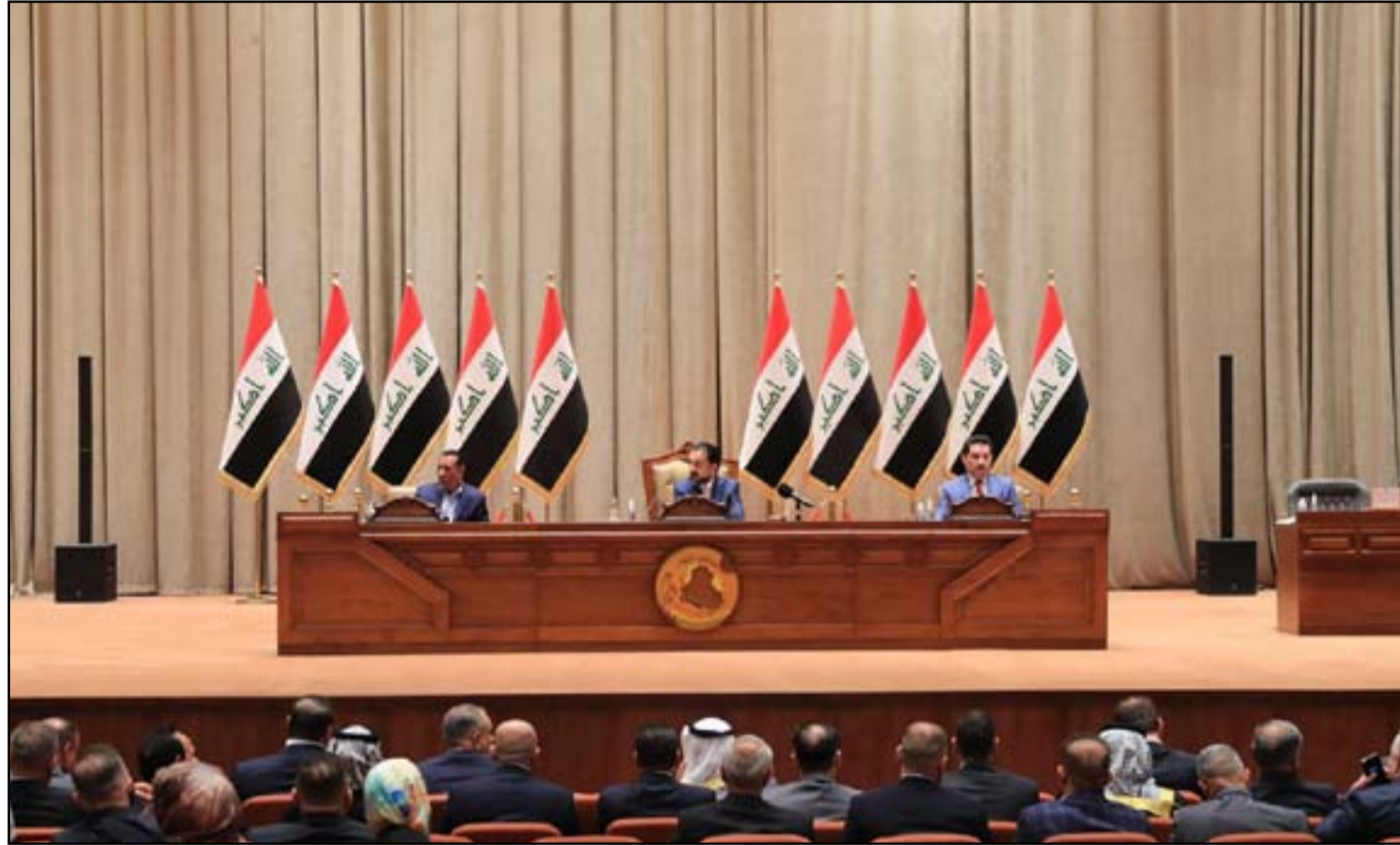
توقعات بعودة جلسات البرلمان منتصف الشهر الحالي

«إطاريون» يحاولون اقتحام بوابة الحنّانة لإعلان المبادرة الجديدة