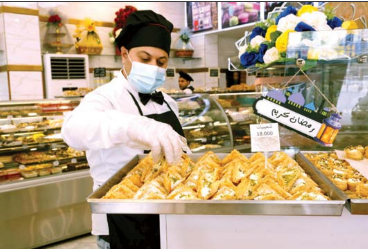
مواد رمضان تدفع الناس للاقبال المتزايد على متاجر بيع الحلويات في بغداد...

رسمياً دخلت مجموعة "الخفاف"، وهو جناح اغتبيالات لأحد الفصائل، على خط الأزمة السياسية بعد تسجيل محاولة اغتيال شمالي العاصمة. وجرت الحادثة التي طالقت 3