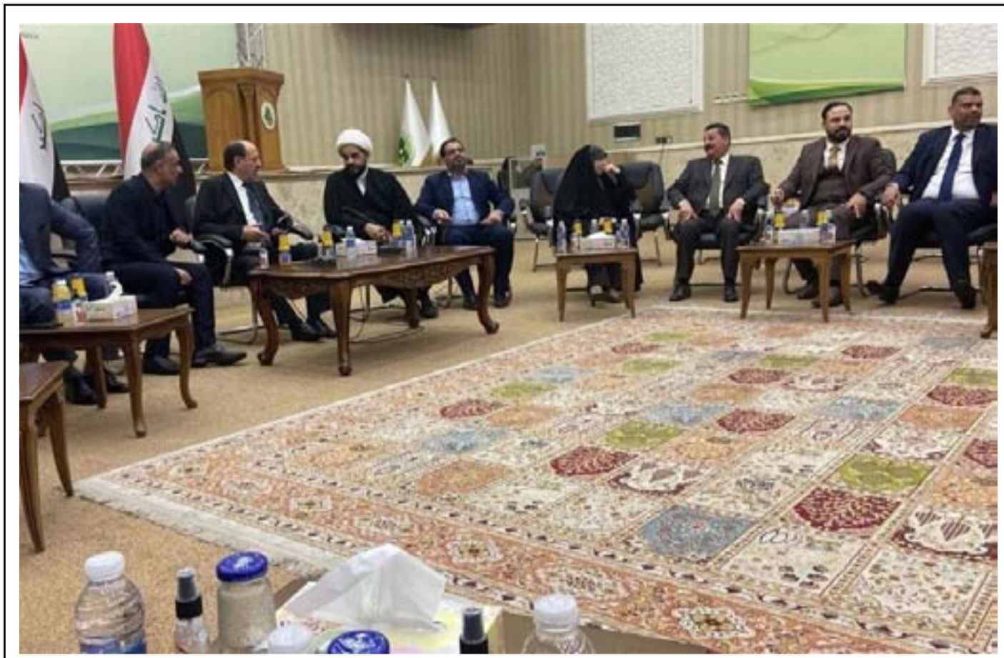
الإطار التنسيقي في حرج كبير بعد توقف مفاوضات الأغلبية

توقع مراقبون أن تستمر أزمة تشكيل الحكومة لمدة أشهر في تكرار السيناريو انتخابات عام 2010، مشيرين إلى أن الإطار التنسيقي لن ينجح في الاستفادة من مهلة زعيم التيار الصدري مقتدى الصدر بتشكيل الأغلبية في ظل تمسك أطراف أخرى بالتحالف مع الصدر. ذكر تقرير لموقع ذي ناشنال الاخباري، ترجمته (المدى)، أن "خبراء ومحليلين سياسيين أكدوا أن الجمود السياسي الذي يمر به العراق الآن قد يمتد لأشهر عقب قرار زعيم التيار الصدري مقتدى الصدر بالتوقف عن أي نشاط سياسي يتعلق بتشكيل الحكومة ومنحه مهلة 40 يوماً للطرف المناهض لتشكيل حكومة جديدة".