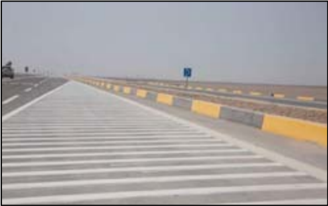
الطريق المؤدي إلى أرصفة ميناء الفاو بعد افتتاحه أمس الأول

أحد مسؤولون حكوميون، أن المرحلة الأولى من إنشاء ميناء الفاو تسير بوتيرة متسارعة، لافتين إلى أن خمسة أرصفة ستكون جاهزة لاستقبال السفن في عام 2024، فيما تحدثوا عن عمليات جديدة تجري حالياً بتهيئة قاع البحر للرصف بالصخور، بعد إنجاز طريق مهم تستخدمه الشاحنات. وقال مدير عام شركة الموانئ العامة ورحمان الفروسي، إن «أحد مشاريع ميناء الفاو الكبير الثلاثة التي تم توقيعها في 2019 والبدء بها بعد عام، تم استلامها رسمياً وافتتاحها لغرض الفحص التجريبي».