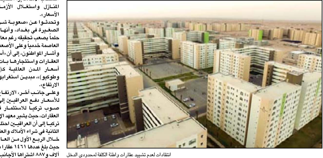
انتقادات لعدم تشييد عقارات واطئة الكلفة لمحودوي النخل

وتحت حديته بالقول إن «الزيادة السنوية المتوقعة للسكان في العراق تصل إلى المليون سنوياً»، مشيراً إلى أن الحكومة وضعت الخطط الضرورية للحد من ارتفاع العقارات. ويتوقع العراقيون، أن «الأسباب الرئيسية التي تقف وراء ارتفاع الأسعار تعود إلى الفوارق الكبيرة التي تولدت بين طبقات المجتمع، فالطبقات السياسية تزاد ثراء