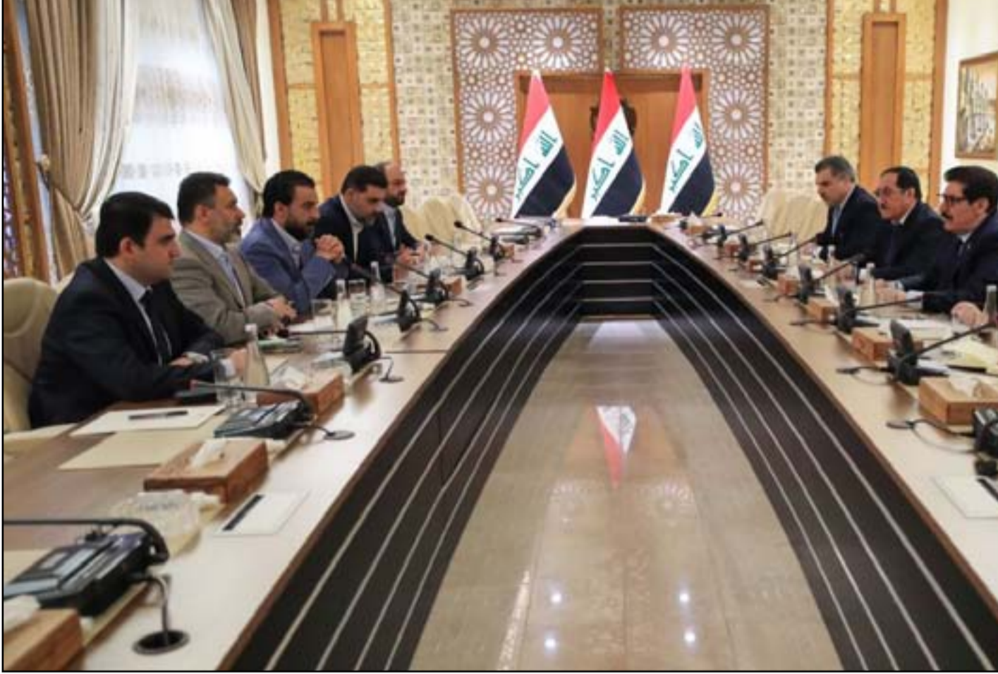
التحالف الثلاثي يواجه موجة جديدة من التهديدات الأمنية

وشدد الصدر على أنه لن يقف «مكتوف الأيدي» ويسمح للإرهاب والفساد بالتحكم في العراق. وكانت أطراف في الإطار التنسيقي، قد شككت برواية «الصدر» حول وجود تهديدات، وطالبت بإظهار الدليل. وقال زعيم ائتلاف دولة القانون نوري المالكي حينها: «ما شهدناه وسمعناه مؤخرًا في وسائل الإعلام عن وجود تهديدات لحياة بعض الشخصيات السياسية، نحن نرفضها بشكل قاطع، لكننا في الوقت ذاته نستغرب من كثرة الحديث عن التهديد من دون تقديم أدلة» وأضاف المالكي في تغريدة نشرها في شباط على «تويتر» «فأما إذا كان التهديد صحيحاً، فنطالب هذه