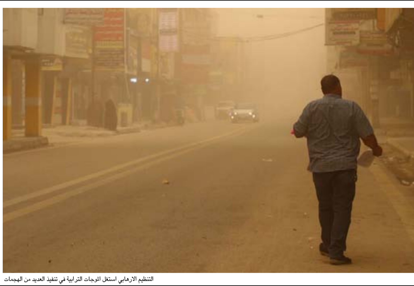
التنظيم الإرهابي استغل الموجات الترابية في تنفيذ العديد من الهجمات

والغام تشكل مشكلة أمنية في مختلف مناطق العراق وأنها تسببت خلال الأشهر الأخيرة بقتل عدد من الجنود والعناصر الأمنية في المحافظة". وأضاف، أن "التحالف الدولي بقيادة الولايات المتحدة كان قد لعب دوراً كبيراً بإسناد القوات العسكرية في حربها ضد داعش في العراق منذ العام