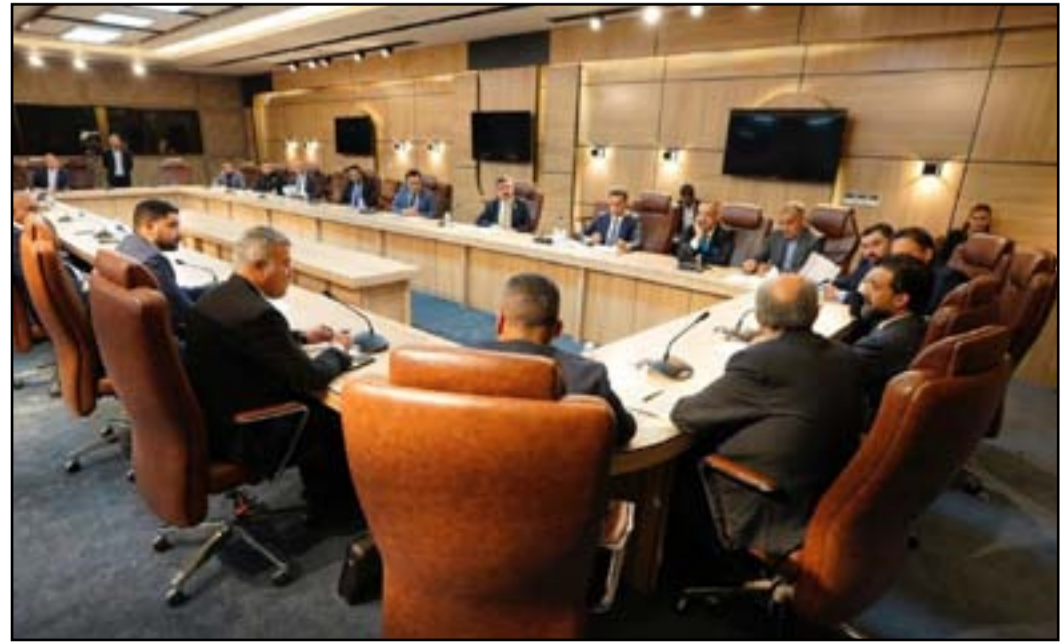
النقاشات مستمرة بشأن قانون الدعم الطارئ للأمن الغذائي

ونوه، إلى أن «السكان هناك قاموا بحفر الآبار من أجل سد احتياجاتهم من الزراعة، لكنها أوشكت