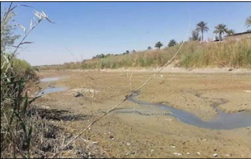
نهر ديالى يفقد مياهه بالكامل

على الجفاف ايضا بسبب عدم وجود المياه، ويوجد البياتي، أن «الجهات المسؤولة داخل السلطتين التنفيذية والتشريعية ملزمة بطرح هذه الازمة أمام الحكومة المركزية بوصفها المعنية بإيجاد الحلول المناسبة الحدودية لإجبارها على تقاسم الضرر».