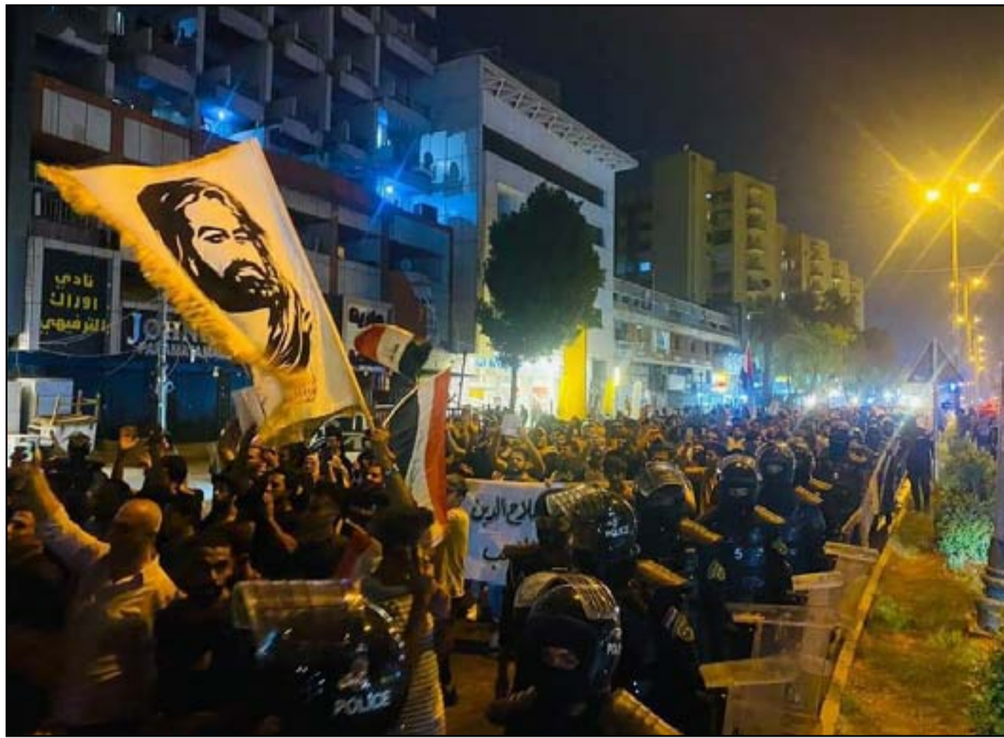
تظاهرات في بغداد للاسراع بتشكيل الحكومة

حكومة اقلية، ويصر على المشاركة ضمن مبدأ «التوافق». وفي نهاية الاسبوع الماضي، حذر عمار الحكيم زعيم تيار الحكمة، من حرق مراحل الانتقال من «التوافقية» الى «الغلبية».