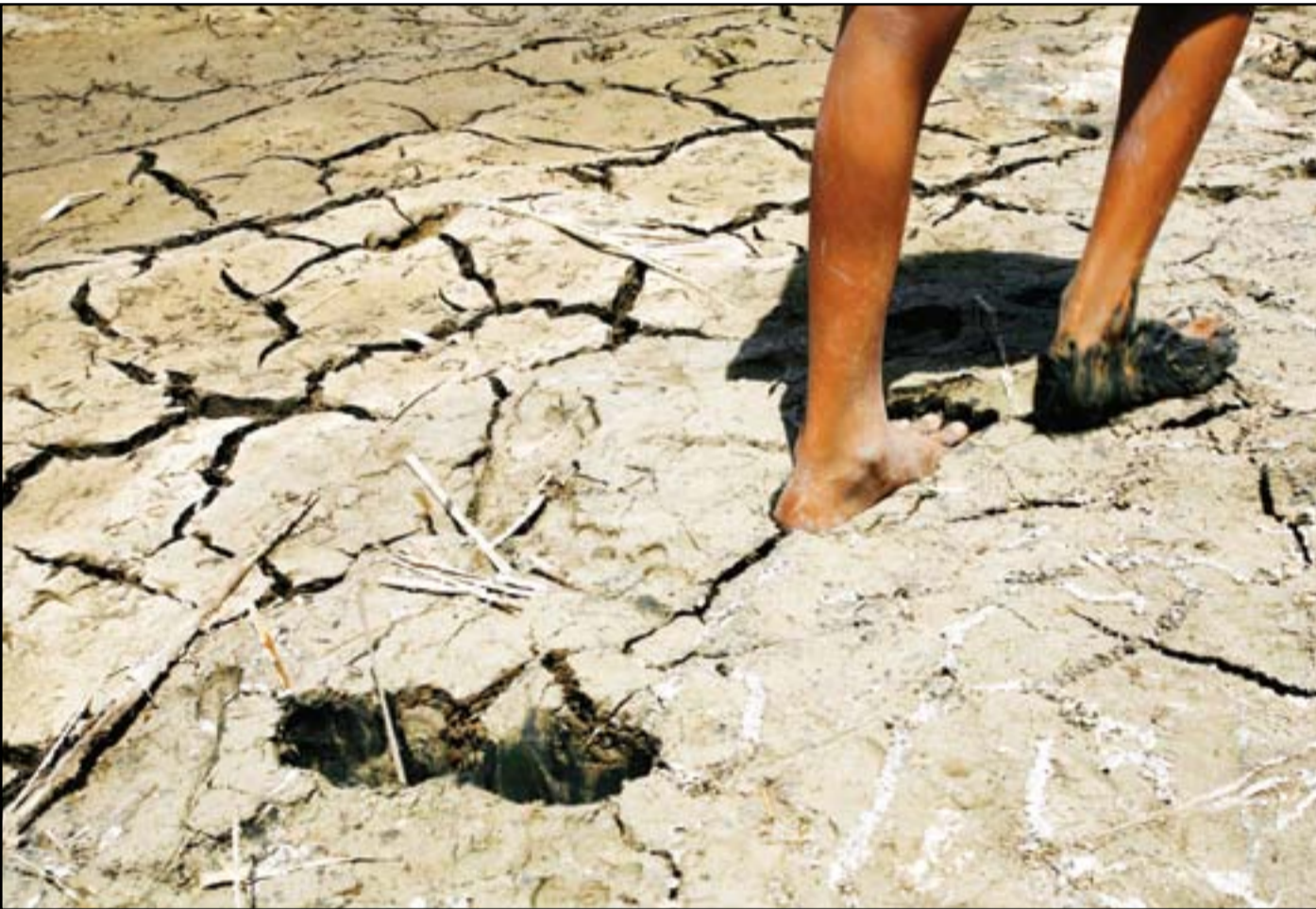
بحيرة ساوه الواقعة في محافظة المثنى جنوبي العراق، وهي تعد إحدى البحيرات التاريخية، جفت بشكل تام بسبب شحة الأمطار وحفر عدد كبير من الآبار الارتوازية قربها