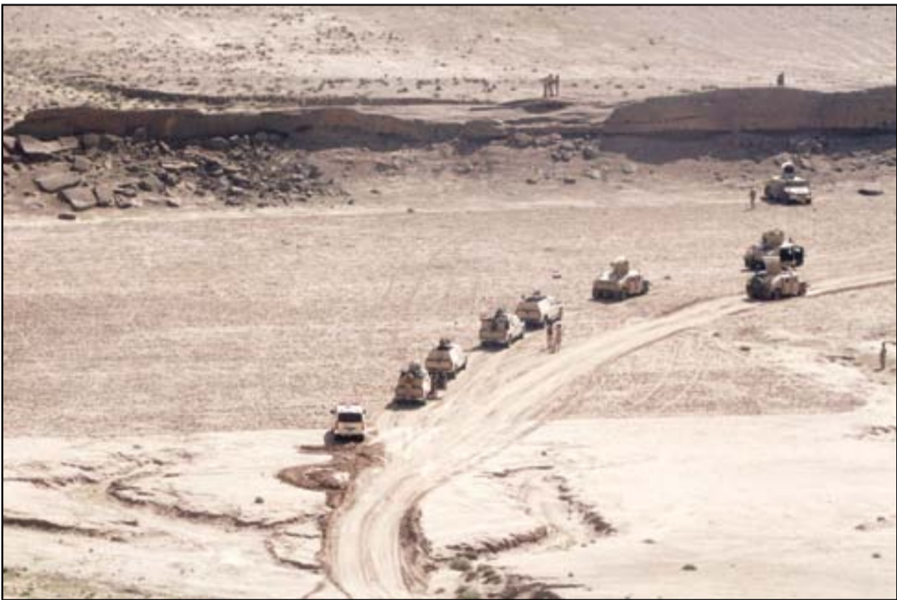
استمرار عملية الإرادة الصلبة لتطهير مناطق في الانبار وصلاح الدين من فلول داعش.. (أرشيف)

تعود للعهد العثماني تضررت على يد تنظيم داعش الإرهابي وخلال الحرب والمعارك لتحرير المدينة، وأضاف التقرير، أن “ذلك خلال برنامج يرعاه الاتحاد الأوروبي ضمن مبادرة منظمة اليونسكو لاعادة احياء الموصل”، وأشار، إلى “دور متدربات من أهالي الموصل يشاركن بهذا المشروع في كيفية استخدام تقنية البناء بحجر الرخام المحلي الذي تتميز به ابنية مدينة الموصل التراثية”. وأوضح التقرير، ان “مشروع إعادة احياء روح الموصل، بالنسبة لشور عمار 25 عاماً،