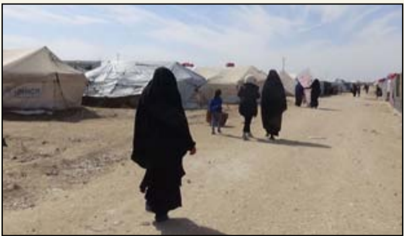
مخيمات النزوح ما زالت من الملفات الشائكة في العراق