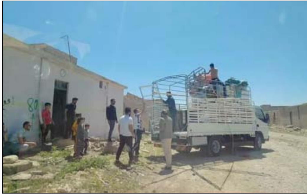
جانب من عودة النازحين إلى سنجار

ووصف الخريجون اقدام القوات المسلحة على تجريف خيامهم بالخطوة غير المدروسة التي ستزيدهم اصراراً على التمسك بمطالبهم واوضحوا في بيان تابعته (المدى)، "لقد اكتفينا من المناشدات وطرح المعاناة وطرق الأبواب، وقد حدث يوم (السبت) ما حدث من اعتداء على