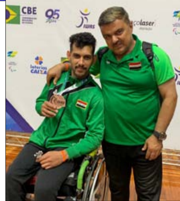
البطل زين العابدين مع مدربه

في الدورة البارالمبية بباريس، وهذا يتحقق من خلال زيادة الرصيد في البطولات العالمية، فكيف أخطط لذلك والمؤسسة البارالمبية تشكو ضعف الميزانية؟ من المؤسف أن اللاعب الضعيف الذي يحتل المراتب الأدنى بعدنا ينجح في مضاعفة رصيده في خمس بطولات ويتأهل إلى الدورة في حين لن أتمكن من تحقيق طموحي إذا ما حُرمت من