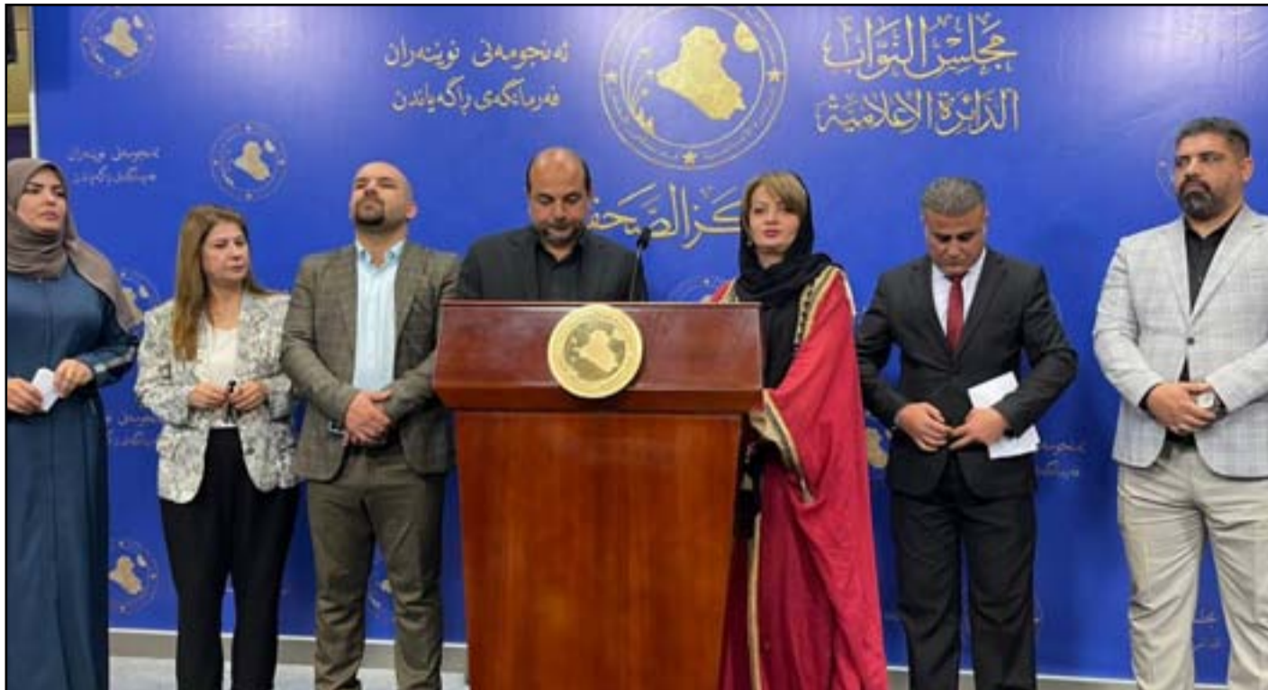
مؤتمر تحالف من أجل الشعب أمس للمطالبة بعقد جلسة للبرلمان

وبعد الانتخابات الاخيرة قرر الخنجر، الذي قاد تحالف عزم، ان يدخل في تحالف مع «تقدم»، الذي يقوده رئيس البرلمان محمد الحلبوسي، ضمن التحالف الثلاثي، مبتعداً عن الشركاء السابقين. وكانت أطراف في «التنسيقي» تتوقع من «صفقة الإنبار» ان يتسبب ذلك بمنزلة الحلبوسي على مشروع زعامة القوى السنية، او يعود «الخنجر» الى اصدقائه القدامى. لكن زياد العرار وهو باحث في الشأن السياسي، نفى ان تكون الصفقة التي يتم تداولها في الاوساط السياسية، مؤثرة على قضية تشكيل الحكومة. العرار قال ل(المدى)، ان «تلك