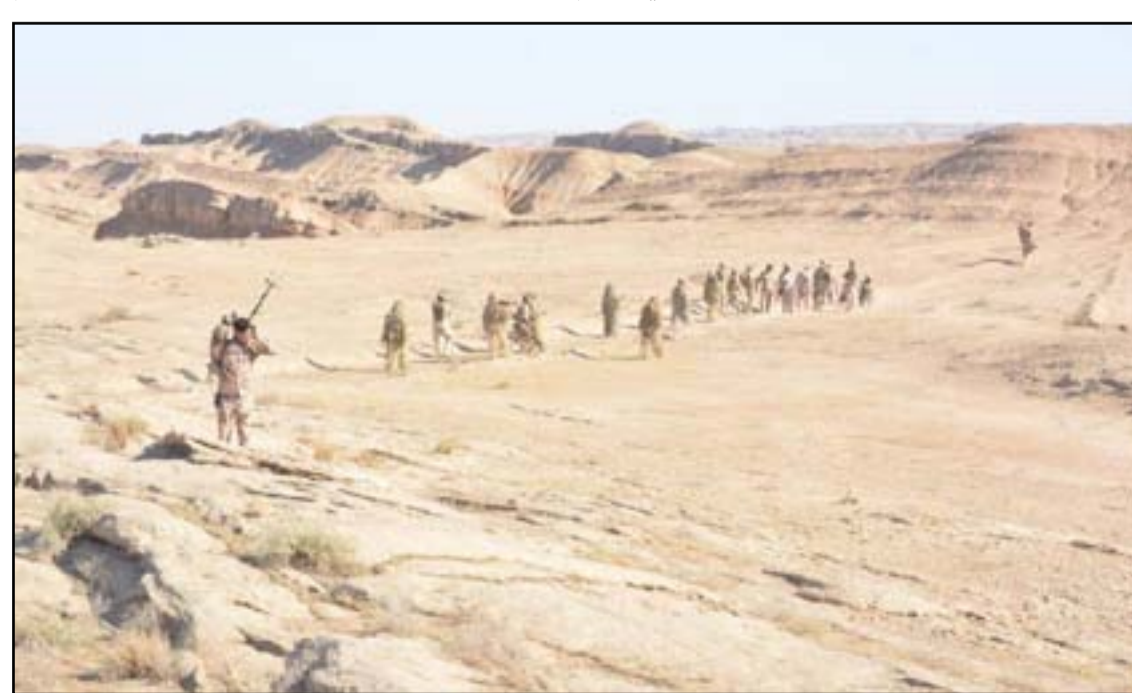
من عملية الصفحة الثانية لعملية الإرادة الصلبة في صحراء الانبار