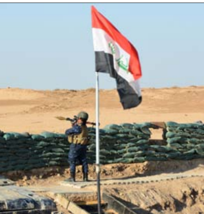
تحصينات على الشريط الحدودي مع سوريا

وأقر مجلس النواب في ٣١ آذار مشروع قانون الموازنة العامة للبلاد للعام ٢٠٢١، بعد أشهر من تعطيل العمل بالحكومة والبرلمان، فيما رفع حجم الموازنة قبل إقرارها إلى أكثر من ١٠١ تريليون دينار عراقي، ما يعادل نحو ٦٩ مليار دولار، بارتفاع عن تقديرات الحكومة التي