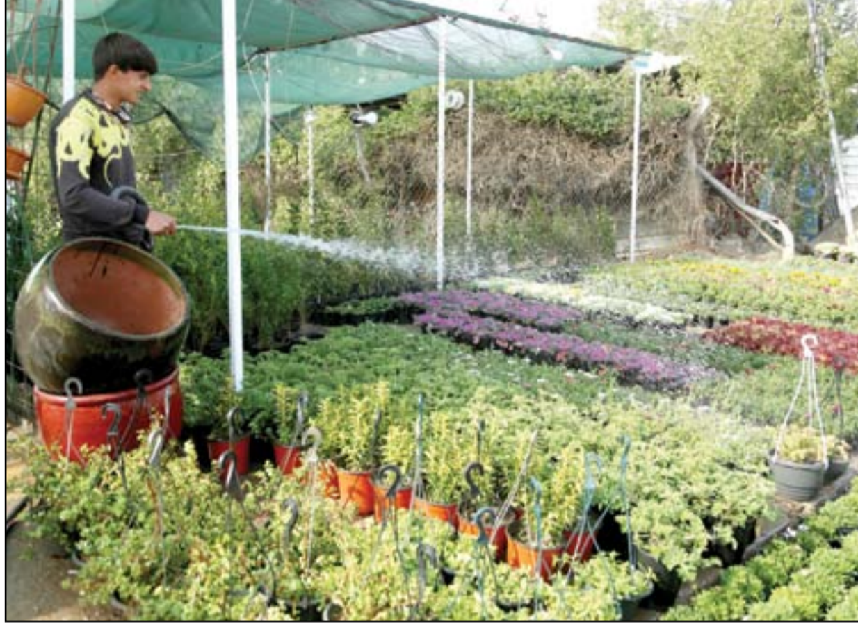
ظاهرة الازدحام بحدائق المنازل أو حدائق الشوارع، وزراعتها من قبل الأمالي، هي ظاهرة صحية وإيجابية.

وأشار كامل، إلى أن "المواد التي تأتي إلى هاتين المحافظتين هي الكريستال في أكثر الأحيان إضافة إلى الحشيشة عن طريق إيران". التفاصيل ص 3