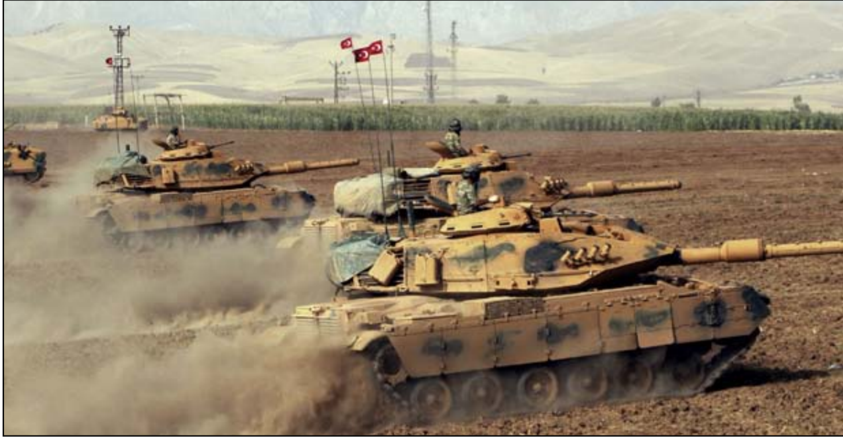
قوات تركية داخل الأراضي العراقية

ويسترس، أن البرلمان العراقي أصدر قراراً في العام ٢٠٠٩ أشار فيه أيضاً إلى عدم وجود اتفاقية بهذا الصدد، بل أنه نسخ جميع التفاهات السابقة قبل عام ٢٠٠٣ التي كانت تجيز للجانب التركي الدخول لأراضيها. ولفت الصحاف، إلى وجود محضر اجتماع بين العراق وتركيا قبل عام ٢٠٠٣ يسمح للأخيرة بدخول قواتها إلى عمق ٥ كيلو مترات داخل أراضيها لأيام محدودة لتحصين حزب العمال الكردستاني، والقيام ببعض العمليات