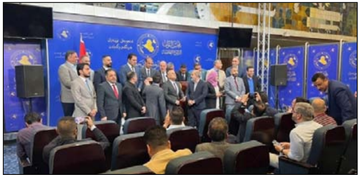
المؤتمر الصحفي الخاص بإعلان مبادرة النواب المستقلين

وتحدث، عن «خطة واحدة زراعية مع وزارة الزراعة لاسيما بشأن سقي البساتين وزراعة الخضار وبعض المحاصيل، ما عدا المحاصيل