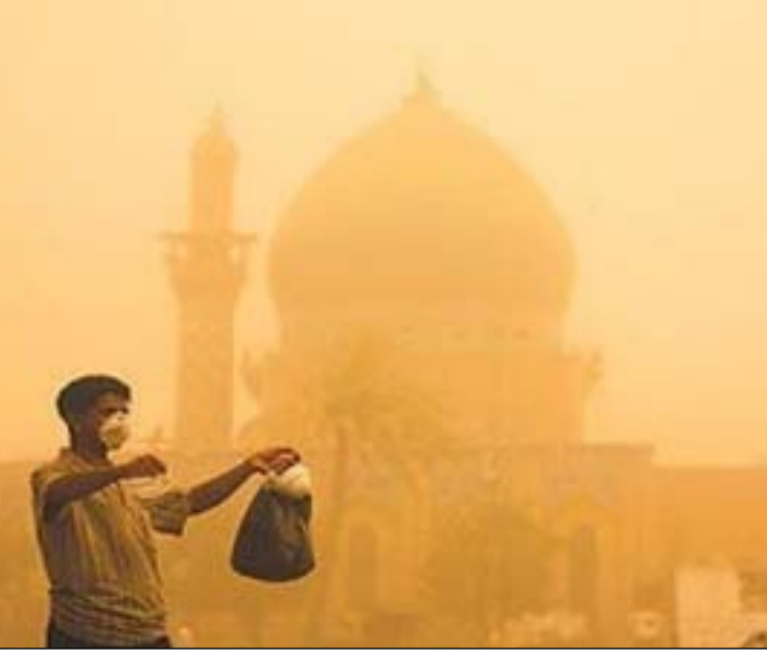
جانب من العواصف الترابية ليوم أمس وسط بغداد

كما أفادت الوزارة في بيان آخر، تلقته (المدى)، أن "وزير الصحة هاني العقابي وجه كافة الدوائر في بغداد والمحافظات باستنفار جهودها للتعامل مع الحالات الطارئة نتيجة العواصف الترابية وعلاجهم واجراء اللازم لهم". وأكد العقابي، بحسب البيان، على "الالاقات الطبية والصحية الخافرة تقديم أفضل الخدمات لمرضى والمرجعين وابداء كافة التسهيلات لهم من الفحوصات والعلاجات الأخرى حتى تماثلهم للشفاء التام". من جانبه، أفاد بيان مطار بغداد الدولي تلقته (المدى)، ان "إدارة المطار أصدرت