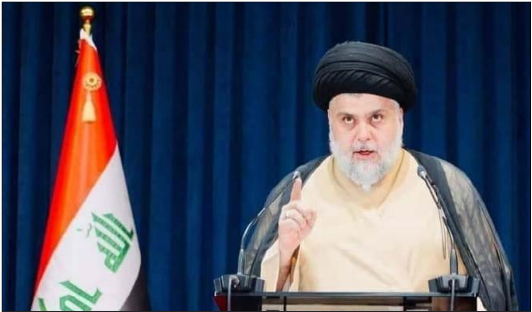
الصدر في خطاب تلفزيوني يوم أمس

وهو التحول إلى المعارضة الوطنية لمدة لا تقل عن الثلاثين يوماً، فإن نجحت الأطراف والكتل البرلمانية، بما فيها من تشرفنا في التحالف معهم، بتشكيل حكومة لرفع معاناة الشعب، فيها ونعمت، وإلا فلنا قرار آخر نعلنه فيها حينها».