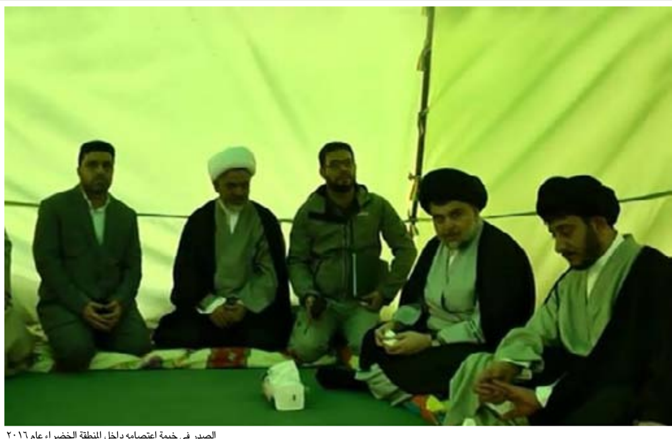
الصدر في خيمة اعتصامه داخل المنطقة الخضراء عام ٢٠١٦

واجتاحت عاصفة ترابية شديدة العراق يوم الاثنين الماضي، تسببت بتسجيل العديد من حالات الاختناق، فيما اضطرت الحكومة إلى تعطيل الدوام الرسمي.