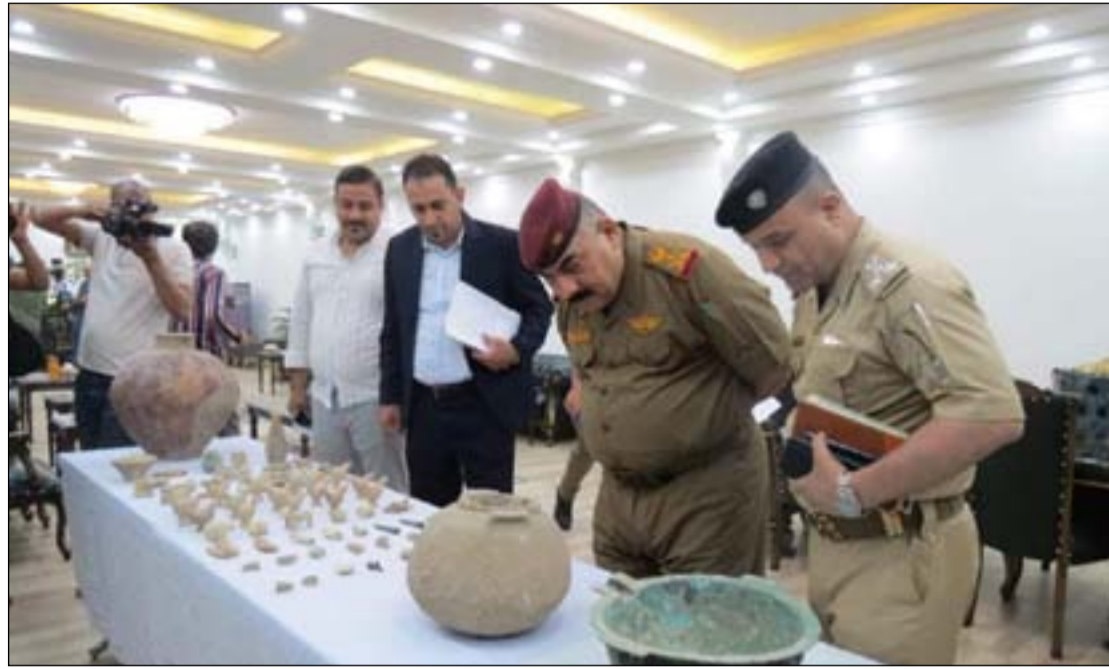
مجموعة من الآثار المسلمة إلى القوات الأمنية في ذي قار

ذي قار والمواطنين من أجل الحفاظ على آثار المحافظة. وبدوره، أكد قائد عمليات سومر وشرطة محافظة ذي قار الفريق سعد علي عاتق الحربية، "فتح طرق التواصل مع المواطنين وكسب ثقتهم بقانون حماية الآثار رقم (٥٥) أسهم بتسليم عشرات القطع الأثرية. وأضاف الحربية، خلال مؤتمر صحفي مشترك مع مفتش آثار ذي قار، أن "القانون يوفر الحماية القانونية للمواطنين عند تسليمهم القطع الأثرية للجهات الرسمية". وتضم محافظة ذي قار نحو ١٢٠٠ موقعاً آثارياً يعود معظمها إلى عصر فجر السلالات