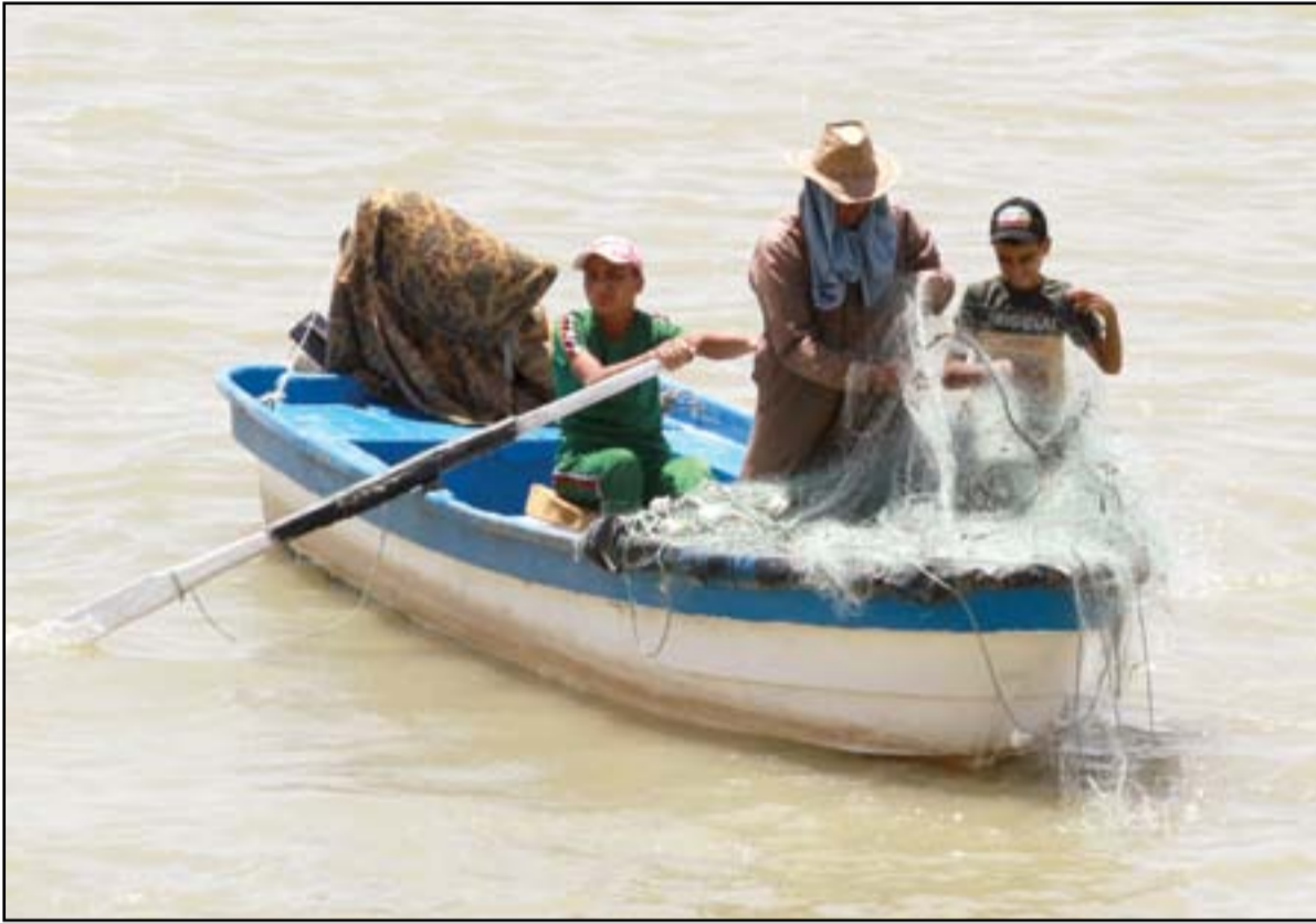
صيادو السمك يمارسون مهنتهم رغم انخفاض مناسيب المياه..