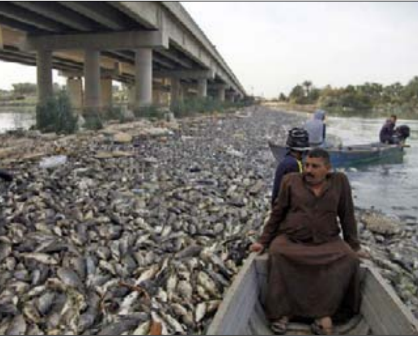
الأمراض الفايروسية تهدد الثروة السمكية في ديالى

ورغم كل تلك المشاكل التي تتعرض لها الثروة السمكية التي تشكل مورداً مالياً للكثير من العاملين في هذا القطاع فضلاً عن كونها مورداً غذائياً محلياً وتأمين الغذاء للمواطن العراقي، خاصة وأن هناك إمكانات كبيرة وخبرات علمية في هذا المجال، لكنها تحتاج لمن يأخذ بيدها، ويوفر لها الدعم المالي والمعنوي