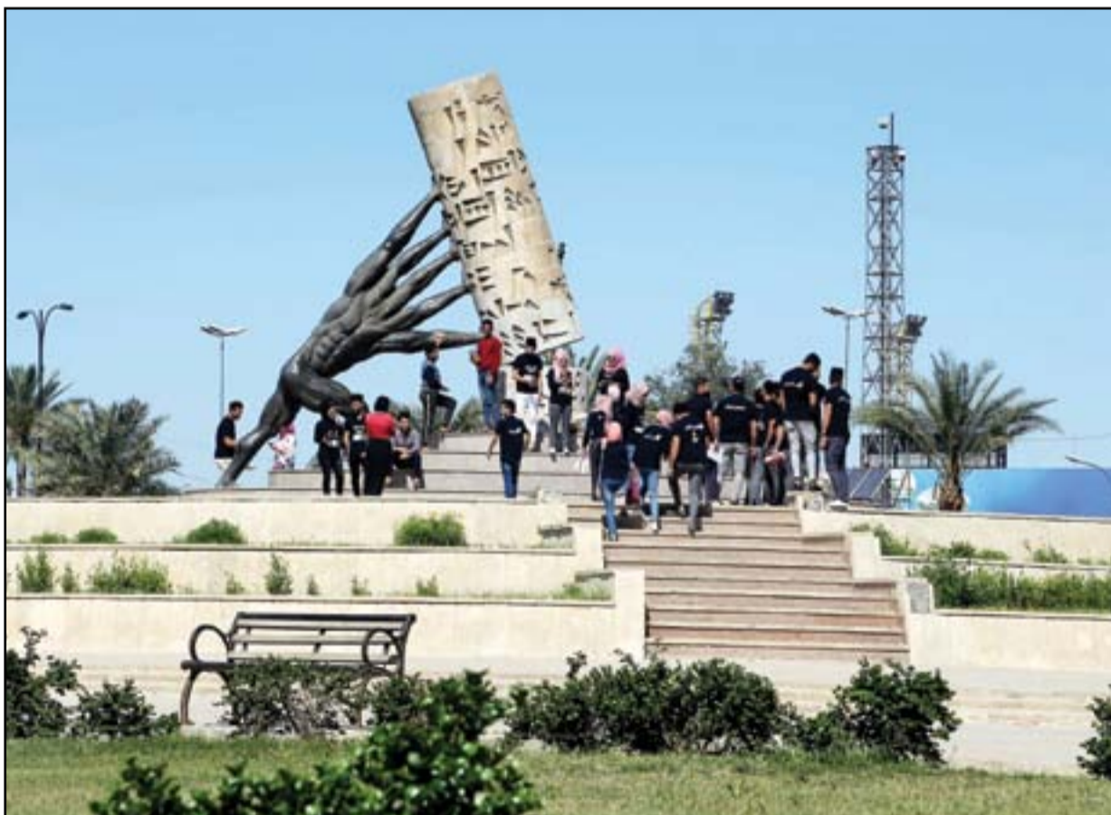
طلبة إحدى الجامعات يتجمعون حول نصب انقاذ العراق لانقاص صور خزيهم..