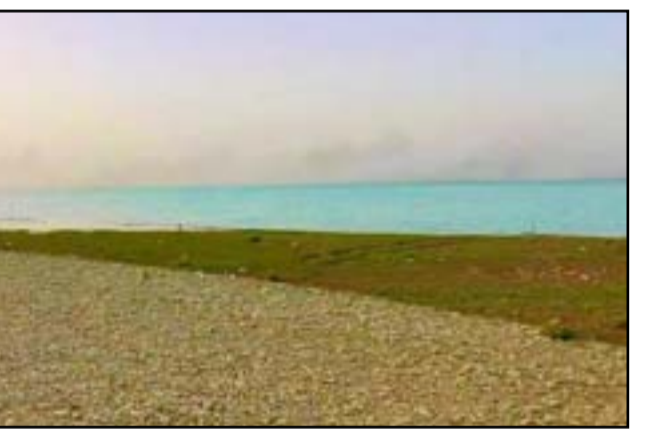
بحيرة حميرين بعد ارتفاع المناسيب في مياهها

وأوضح، أن «عام 2019 شهد هطول كميات جيدة من الأمطار، فاستطعنا نستثمر هذه المياه ونستخدمها خلال 3 أعوام لاحقة»، مبيناً أن «الأعوام الثلاثة الأخيرة لم تشهد هطولاً جيداً للأمطار». ورأى ذياب، أن «ذلك دليل على نجاح العراق في تشغيل الكميات المخزونة بشكل عقلاني لتأمين الاحتياجات»، مؤكداً أن «كميات المياه للشرب والاستخدامات البشرية إضافة إلى سقي البساتين والخضر وبعض المحاصيل الصيفية ستكون متوفرة». وشدد، على «عدم وجود كميات كافية من المياه لزراعة محصول الرز في منطقة الفرات الأوسط، ولهذا السبب تقلصت مساحته بشكل كبير في هذا العام»، وتحدث عن اتفاق على «زراعة 10 آلاف دونم، بواقع 6500 دونم في النجف و3500 دونم في الديوانية». ونوه ذياب، إلى أن «هذه الرسالة مهمة ينبغي أن يتلقاها الشارع العراقي بأنه لا يوجد هناك قلق بشأن المياه، وبأننا قادرين على توفير الاحتياجات المهمة بالرغم من درجات الحرارة والتبخّر، لكننا لدينا الكمية التي من خلالها نتجاوز هذه الأزمة». ويواصل المستشار الوزاري، أن