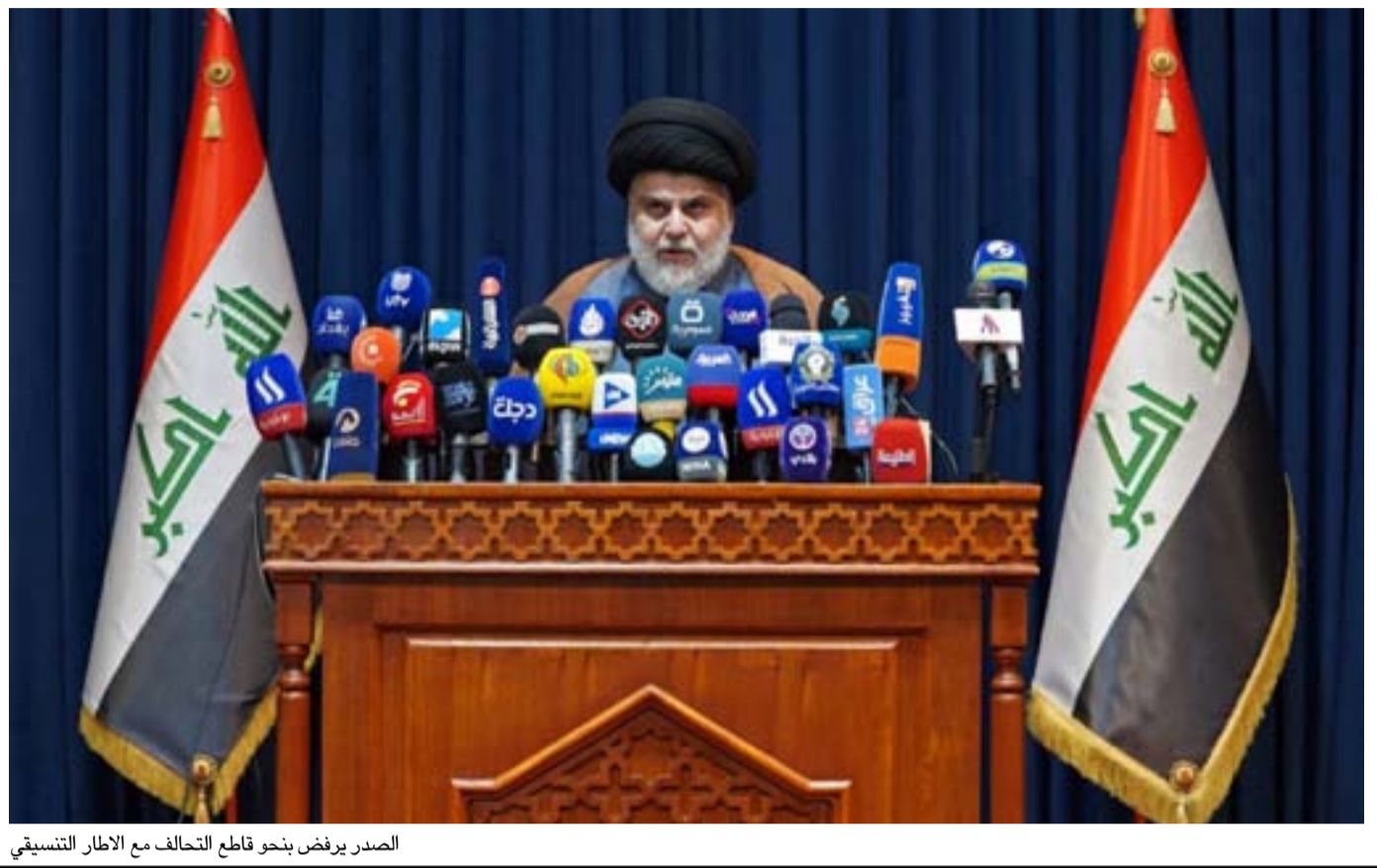
الصدر يرفض بنحو قاطع التحالف مع الإطار التنسيقي

بتاريخ ١٦ أيار ان يتبنوا ستراتيحية جديدة". ويقول أحد القياديين في الإطار التنسيقي، بحسب التقرير، إن "ستراتيحية احتواء الصدر يجب ان تنتهي لأنها تدفعه لاتخاذ مواقف متشددة". وتابع القيادي، أن "الصدر يعتقد باننا نخشى مواجهته، وانه باستطاعته الانفراد بكل ما يريده هو ومجموعته. انه على خطأ تام".