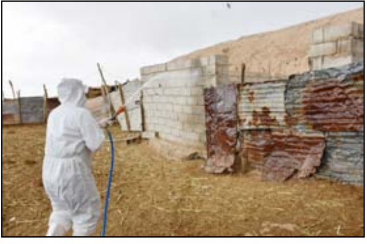
اجراءات مشتركة للحد من انتشار الحمى النزفية

في 2019، ثم سقوط الحكومة، هو ما يدفع القوى السياسية إلى مشروع «الصدر»، كما تحدثت المصادر. وتشدّد المصادر، على أن «لا أحد من حلفاء زعيم التيار يرغب بتشكيل حكومة لا تستمر أكثر من 6 أشهر، إذا كانت بنفس طريقة تشكيل الحكومات السابقة». وكان زعيم التيار، قد اعترف في منتصف أيار الحالي، بأنه لم يستطع تشكيل الحكومة بسبب «الثلاث الممثل»، لذا قرر الذهاب إلى المعارضة لمدة لا تقل عن الشهر. وبحسب ما فهم من «تغريدة الصدر» الأخيرة، بأنه سوف يبقى في إطار المعارضة إذا استطاع غريمه «الإطار