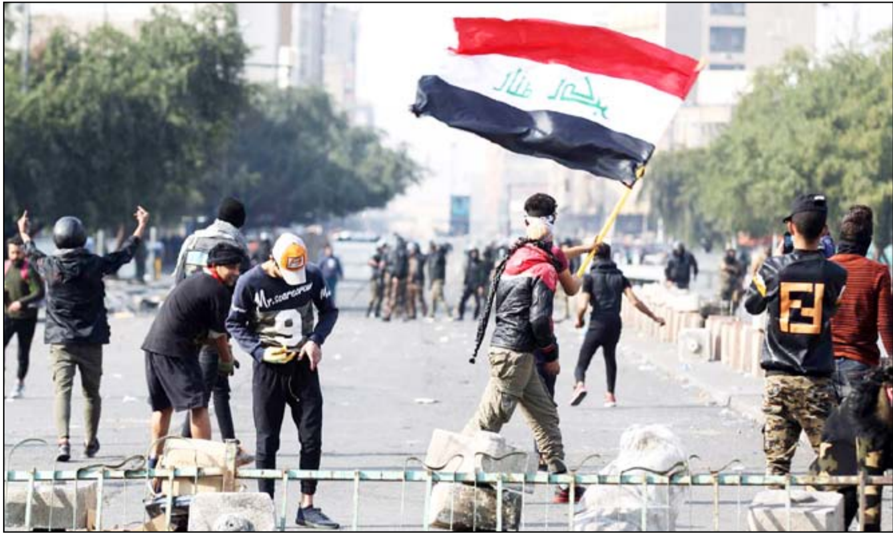
تظاهرات تشرين في 2019 التي أطاحت بحكومة عبد المهدي بعد عام من تشكيلها