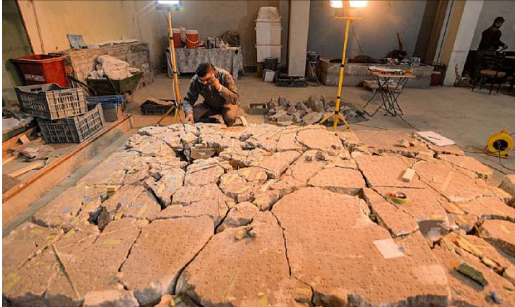
عامل في متحف الموصل يحاول تجميع أجزاء مكسورة من قطعة أثرية

أخذ على عاتقه تشخيص الأضرار ووضع خطة عمل لرؤية ما يستوجب عمله انطلاقاً من حالة الدمار التي وجدناها. وزادت توماس، مازلتنا نتولى مهمة جمع القطع المتناثرة، هناك عمل أكثر من 2000 عام، فأنها تحولت فجأة خلال لحظات إلى حطام، لافتة إلى أن "متحف اللوفر