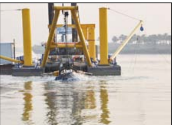
جانب من عمليات كربي نهر دجلة

ويواجه ارتفاع حاد في درجات الحرارة وزيادة معدلات التبخر والموجات الترابية». وأضاف: «أن الدعم المالي يذهب إلى القيام بأعمال استثنائية»، منها إلى أن «جميع أجهزة الوزارة مستنفرة في تطهير مجموعة كبيرة من الأنهر ونصب محطات ضخ وهننا عبور الصيف». وأضاف: «الدعم المالي يذهب إلى القيام بأعمال استثنائية»، منها إلى أن «جميع أجهزة الوزارة مستنفرة في تطهير مجموعة كبيرة من الأنهر ونصب محطات ضخ وهننا عبور الصيف». وأضاف: «الدعم المالي يذهب إلى القيام بأعمال استثنائية»، منها إلى أن «جميع أجهزة الوزارة مستنفرة في تطهير مجموعة كبيرة من الأنهر ونصب محطات ضخ وهننا عبور الصيف».