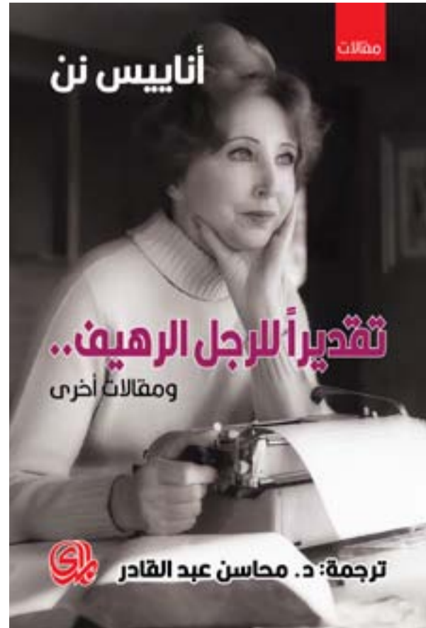
ترجمة: د. محاسن عبد القادر

تعد نون من أفضل كتاب الأدب الإباحي. حيث كانت من أول النساء اللاتي تعشقن في كتابه الأدب الإباحي، ولقد كانت بالتأكيد أول امرأة بارزة في الغرب المعاصر والتي عرفت بكتابة الأدب الإباحي. قبل ظهور نون، كانت كاتبات الأدب الإباحي نادرات، مع استثناء بعض الكتاب.