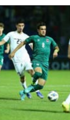
فريق المنتخب الوطني

وصولا إلى ركلات الجزء الترويجية التي كسبها (٢-٣) وتأهل الى المربع الذهبي. وسبق لسوكوب أن فشل في نهائي غرب آسيا تحت ٢٣ بعد الخسارة من السعودية