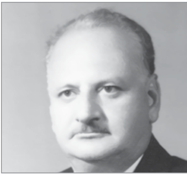
علي جواد الطاهر