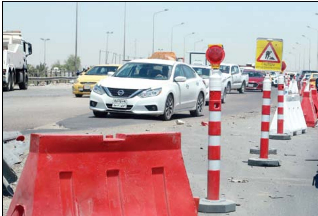
اعمال صيانة على طريق السريع محمد القاسم تسبب ازدحاماً مرورياً لساعات..