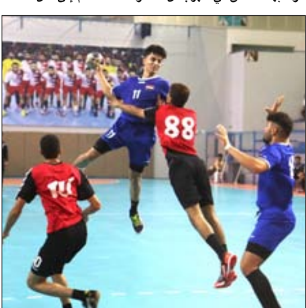
مباراة كرة اليد بين فريقين من الأشبال في المهرجان.

اليد العراقية، والانطلاق بها نحو البطولات العربية والقارية والعالمية، بهدف تحقيق النتائج الجيدة. وبين "نتوسم خيراً بالفرق التسعة المشاركة على دفع مواهبها للتألق في المهرجان، واكتشاف الواعدين منهم، وبذل مزيد من الجهود للارتقاء بقدراتهم، ضمن برنامج يضم أبرز المبدعين في اللعبة، ومواكبة مسيرتهم بالتنسيق مع مدربيهم".