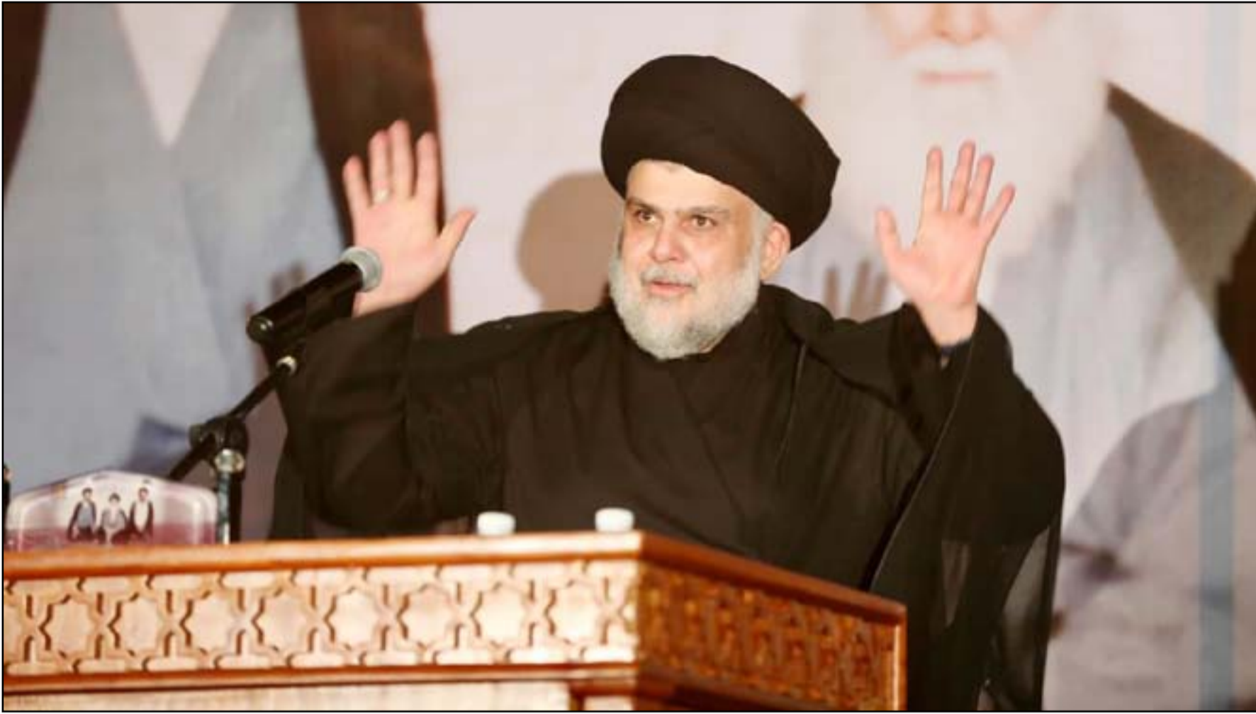
زعيم التيار الصدري يرحب الأطار التنسيقي مرة أخرى بشأن تشكيل الحكومة

وأن صدقت تلك الروايات أم لم تصدق، فإن أوساط الصدريين الذين تحدثوا لـ(المدى)، أشاروا إلى أن «الغضب