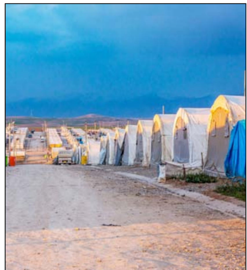
معرقات لوجستية وأمنية عطلت حسم ملف النزوح في العراق

وأضاف النوري، أن «العراق له دور متميز» ببقية دول العالم في إدارة أزمة النزوح التي بدأت في عام 2014 بـ170 مخيماً و850 ألف عائلة تضم 4.5 انسان». وأشار، إلى أن «المتبقي في الوقت الحالي هو 28 مخيماً فقط»، مشدداً على أن «العراق نجح في إدارة هذه الأزمة بشهادة منظمة الهجرة الدولية». ولفت النوري، إلى أن «البعض من المنظمات الدولية قد لا تستمر في دعم النازحين»، مؤكداً أن «دورنا هو إغاثة من تبقى في حالة النزوح». وأوضح، أن «الوزارة كادت أن تغلق هذا الملف