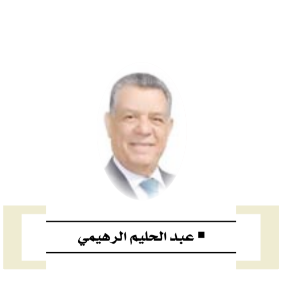
■ عبد الحلیم الرهيمي

خلال فترة الإغلاق الشامل للمؤسسات والمحلات ومنع التجمعات وأقامة الحفلات قبل نحو سنتين خشية انتشار وباء كورونا ، أقام رئيس الحكومة البريطانية بوريس جونسون حفلة ، أو حفلات ، ضمت عشرات الأشخاص في مقر الرئاسة الحكومي الشهير في شارع (داوننج ستريت) وهو الامر الذي كشف عنه لاحقا مما ادى الى اشارة حملة انتقادات واسعة لجونسون واستقالة خمسة من كبار مستشاريه احتجاجا باعتبار ما فعله خرقاً للقانون الذي أقرته حكومته ، وسمى الاعلام هذا الخرق بفضيحة الحفلات (بارني غيت) وأرتفعت الاصوات والمطالبات بمسائلة جونسون ومحاسبته من حزب العمال المعارض ومن حزبه (المحافظون) سيما وانه اول وزير في المملكة المتحدة يرتكب مثل هذا الخرق للقانون . وبسبب ذلك دعى المشرعون عقد جلسة استثنائية لهذا الامر ، والتي عقدت فعلاً في السادس من شهر حزيران الحالي ، وكانت