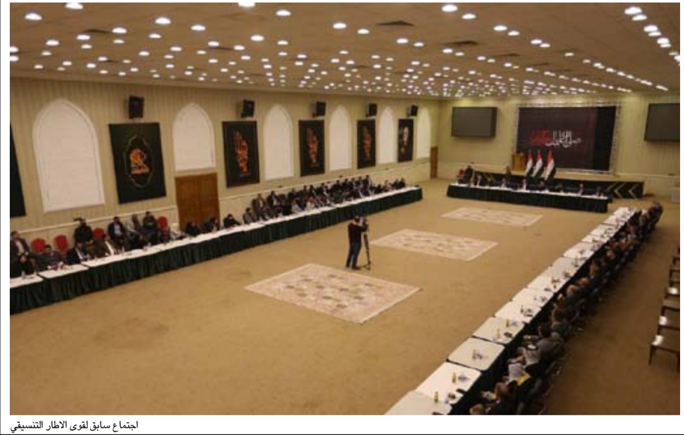
اجتماع سابق لغوى الإطار التنسيقي

ستقوم به المفوضية العليا المستقلة للانتخابات؛ وثانياً هل ان الصدريين قرروا فعلاً التخلي عن العملية السياسية؟ وأوضح، أن "البند الخامس من المادة ١٥ لقانون انتخابات مجلس النواب يشير بوضوح الى انه في حالة وجود مقاعد شاغرة فإن المرشح ذو النقاط الأعلى في الدائرة الانتخابية يمكن له ان يشغل المقعد". وتوقع التقرير، أن "يحصل أعضاء الإطار التنسيقي على مزيد من المقاعد سيما وانهم كانوا على هامش المنافسة للصدريين في المحافظات الجنوبية". واستدرك "حتى لو تقرب الاطاريون أكثر نحو تشكيل حكومة من خلال هذه المقاعد فانهم سيقعون بحاجة لجمع ثلثي مقاعد البرلمان والتي