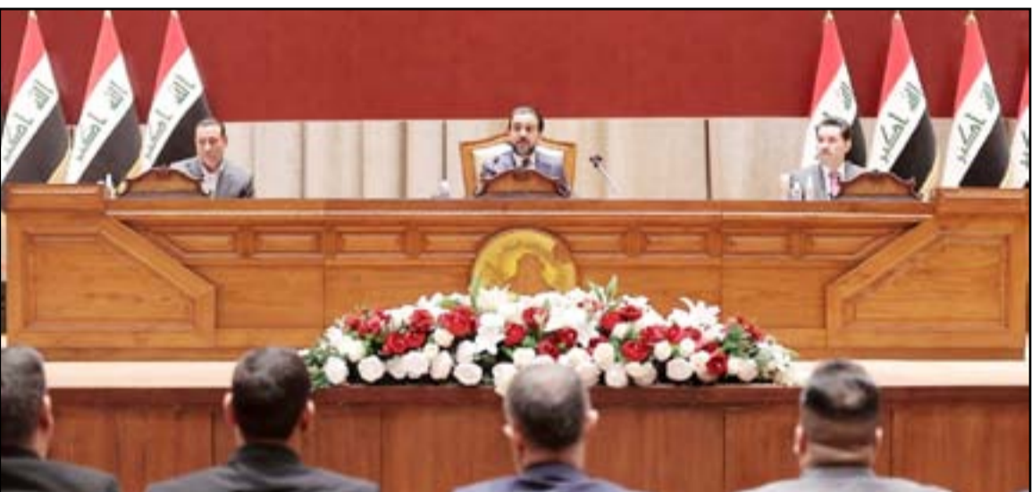
البرلمان في عطلة تشريعية تستمر لغاية شهر آب

الخارجية وديون استيراد وشراء الغاز والطاقة».