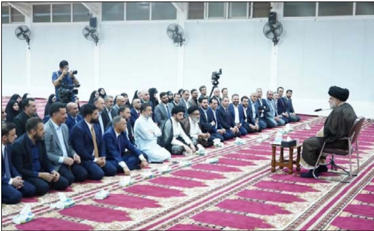
الصدر خلال اللقاء مع نواب كتلتها المستقبليين نهاية الاسبوع الماضي

دون انتظار الصدر، وهو امر يخالفه فيه جناح هادي العامري زعيم منظمة بدر. وحاول المالكي التغطية على الانباء الذي تظهر حماسه لغياب الصدرين عن المشهد السياسي، بالحديث عن «نقاط الالتقاء» مع التيار. ووصف زعيم ائتلاف دولة القانون في تغريدة على تويتر «الخلافت مع الصدرين عقب الاستقالة، بانها بسيطة وليست استراتيجية». واضاف ان علاقته مع التيار الصدري: «تفرض علينا دائما الحرص والبحث عن نقاط الالتقاء والتعاون والتكامل وهي كثيرة».