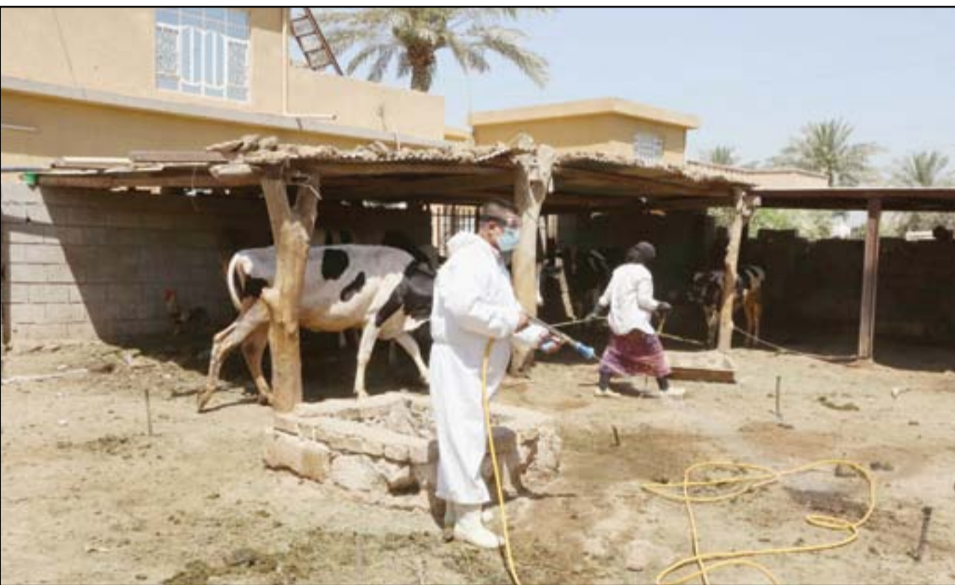
حملات وقائية وتعقيم لمكافحة الحمى النزيفية في المداخن .. عدسة: محمود رؤوف

المواطن بما هو أفضل من المواسم الصيفية السابقة، لكنها دعت المحافظات إلى عدم التجاوز على حصصها. قال المتحدث باسم الوزارة أحمد موسى، إن «العراق سدد مستحقات الغاز الإيراني كاملة وفق مساعي الوزارة والاهتمام الحكومي الكبير بقطاع الكهرباء». وأضاف موسى، أن «المبلغ قد تم توفيره من خلال الاقتراض الداخلي