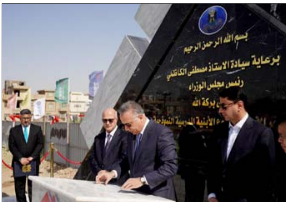
الكاظمي خلال مشاركته في احتفالية وضع حجر الأساس أمس

جاءت استجابة لتوجيهات الأمين العام لمجلس الوزراء حميد نعيم الغزي، الخاصة بتابعة مراحل تنفيذ مشروع الأبنية المدرسية النموذجية في عموم العراق، الذي يندرج في إطار مخرجات الاتفاقية العراقية - الصينية". وأشار، إلى أن "حصة محافظة الديوانية بلغت ٦١ مدرسة موزعة في كل أفضية ونواحي المحافظة"، مشيراً إلى أن "مراحل الإنجاز تسير في وتيرة متصاعدة، وأن جميع المواقع المتسلسلة مفتوح العمل فيها ومستمر، وفقاً للمواصفات الفنية المطلوبة". ولفت البيان، إلى أن "لوجستيات العمل من الجوانب الأمنية والفنية، في مواقع العمل مؤمنة بالكامل من قبل الأجهزة الأمنية في المحافظات وجميع الدوائر ذات العلاقة". وأوضح، أن "ممثل الأمانة العامة لمجلس الوزراء، أثناء محطات الجولة، نقل تحيات الأمين العام حميد نعيم الغزي، للملاكات العراقية والصينية العاملة في مواقع التنفيذ"، وحثاً على "ضرورة بذل المزيد من الجهود لإكمال بناء المدارس حسب السقوف الزمنية المحددة في بنود التعاقد". ومضى البيان، إلى أن "الغزي أولى أهمية كبيرة لهذا المشروع الحيوي، الذي سيقدم خدمة كبيرة في قطاع التربية والتعليم، عبر دخول الطلبة في تجربة التعلم داخل فضاءات حديثة وفعالة وعالية المواصفات".