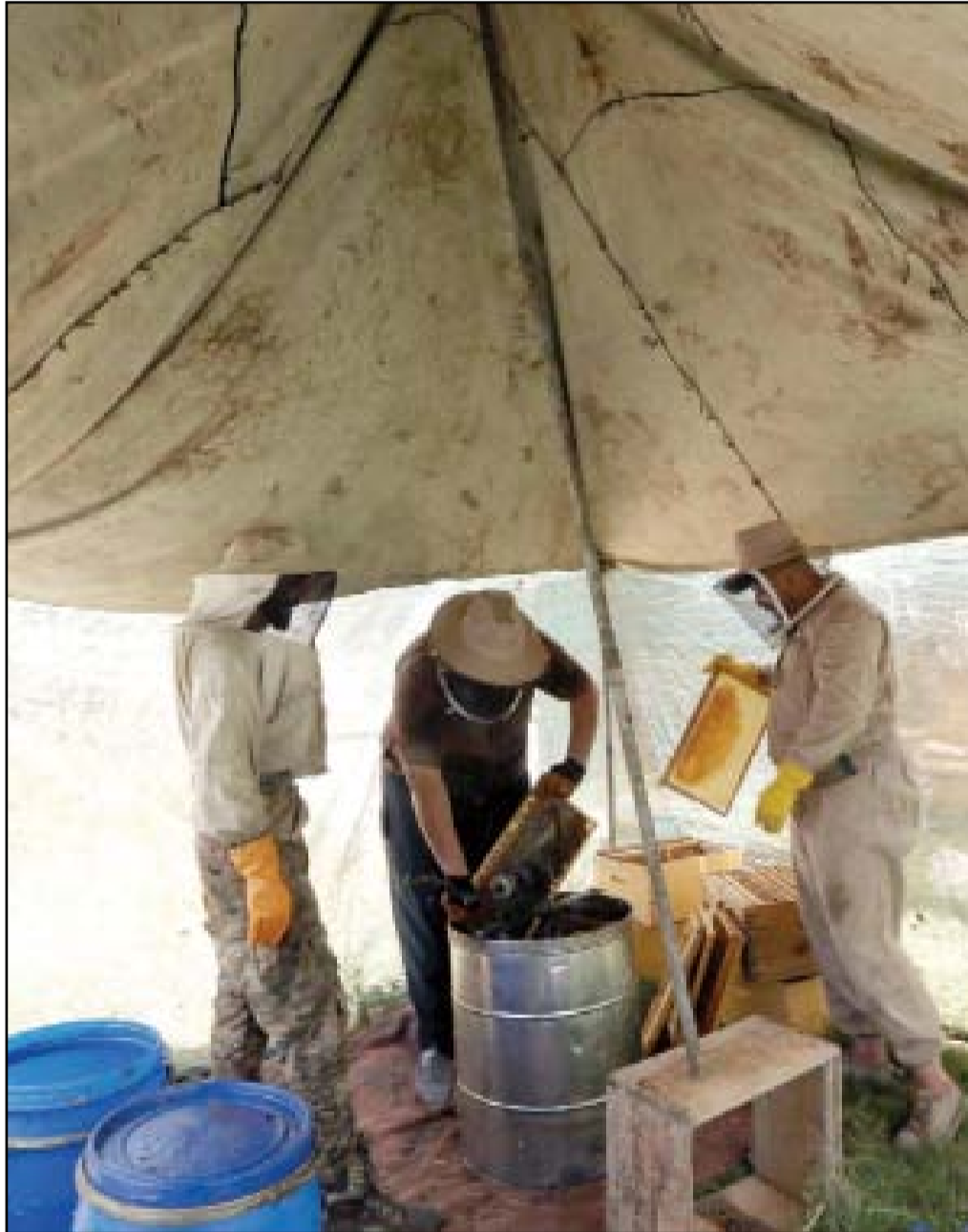
مربو النحل في بغداد.. عدسة محمود رؤوف

شهدت منطقة ناحية النهروان جنوب شرقي بغداد، مجزرة مروعة بقيام شاب بالهجوم على عائلة مستخدماً رمانات يدوية أدت إلى مقتل وإصابة عدد من الأشخاص، ومن ثم أقدم على الانتحار. وقال أحد الساكنين بالقرب من مكان الحادث، إن "الجانبي قذّر زار بيت عائلته في الساعة الواحدة ليلاً وكان الجميع يتوقع أن الهدف من هذه الزيارة التصالح معهم بعد خلافات سابقة". وأضاف، أن "الحديث فيما بينهم تطور ووصل إلى الشجار، وقد