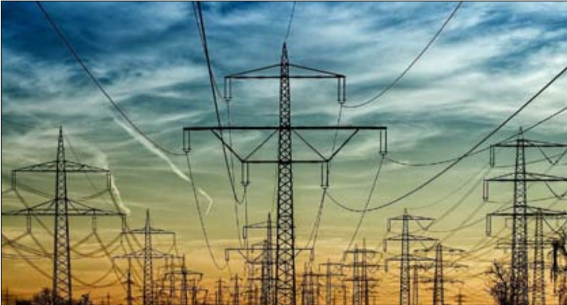
العراق يسعى لتحقيق مكاسب سياسية واقتصادية من الربط الكهربائي مع دول الجوار

وكان وزير المالية قد أدلى بتصريحات أثارت الاستغراب بأن العراق يفكر بتصدير الكهرباء في المستقبل، وهذه التصريحات أعادت إلى الذاكرة حديثاً مشابهاً أدلى به نائب رئيس الوزراء الأسبق حسين الشهرستاني.