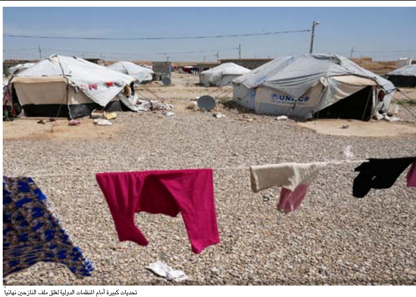
تحديات كبيرة أمام المنظمات الدولية لخلق ملف النازحين نهائياً

وبين، أن المانحين الدوليين وفروا ما يقارب من 8 مليارات دولار في هذه الجهود الطارئة، وتحدث عن تقديم مليارات أخرى ضمن هذا السياق، من نفقات التنمية وإعادة اعمار وتحقيق استقرار، ساعدت الحكومة العراقية في استخراج الطاقة الكهربائية ومنظومات تحلية المياه العامة وإعادة تشييد الطرق وإعادة بناء مدارس ومنشآت صحية وسكنية.