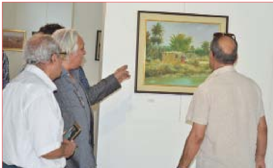
امكانية الفنانين تتفاوت مثل اي جانب آخر، فيوجد فنانون متمكنون ولكن يمارس تجربته الإبداعية على مستوى الخطاب الفني الاخر، وعن المشاركين في المعرض قال الزيدي ان أكثر من 70 عملاً