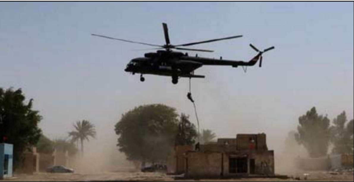
القوات الامنية تجلج للتعقب والازال الجوي في ملاحقة بقايا داعش

ولفت، إلى أن «جهاز المخابرات أصبحت لديه مجسات خارج الحدود تعطي نوعاً من الإنذار المبكر للقوات العاملة داخل الحدود بأن تهديداً قد وصل ويصار إلى التنسيق والمعالجة». وبين الشريفي، ان «الذين يحاولون التسلل مربيين على مستوى عالي ومسلحين بتسليح متميز وكانوا يشاغلون في محافظة ديالى ووصلوا إلى شمالي بغداد تحديداً قضاء الطارمية». ونذهب، إلى أن هذا «النوع من الإرهابيين لم تعد لديه القدرة بالمشاغلة والتعرض في المناطق الحيوية وهذا يدل على أن النشاطات العسكرية لقواتنا إيجابية اجهزت على الكثير من العمليات الإرهابية». وقال الشريفي، إن «إمكانية التطوير لقواتنا متاحة ولكن من