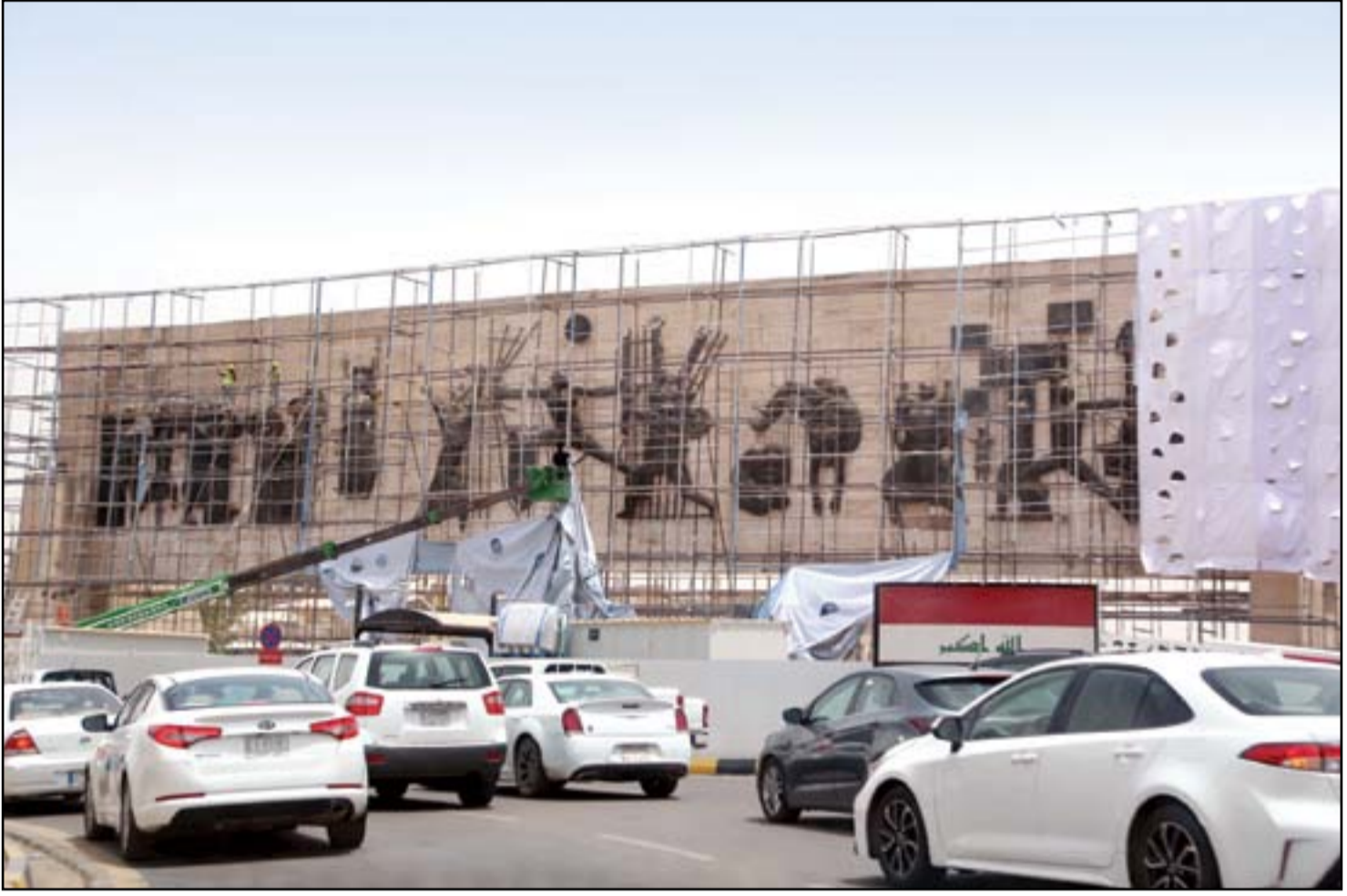
نصب الحرية وسط بغداد تحت الصيانة.