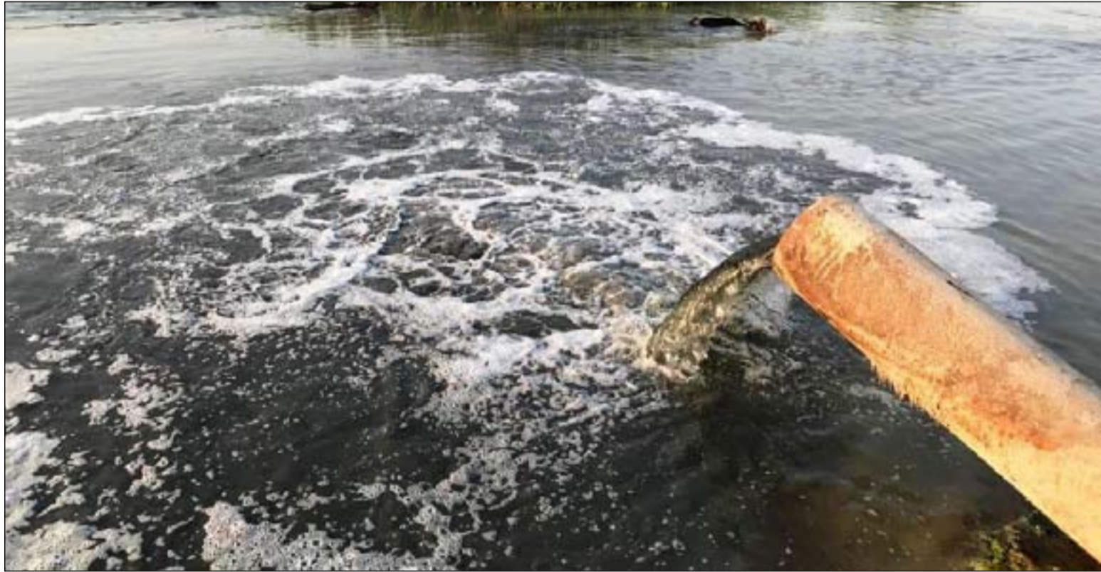
مخاوف من امراض خطيرة بسبب تلوث المياه في ذي قار

مجمعات الماء عن العمل نتيجة الانقطاعات المتكررة للتيار الكهربائي.