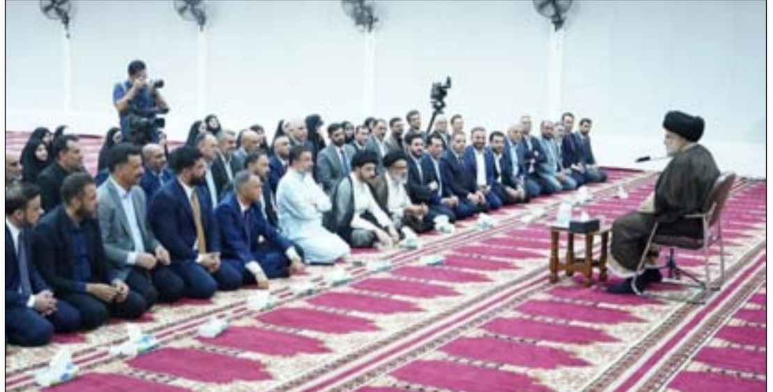
اجتماع الصدر مع نواب كتله بعد تقديم استقالاتهم