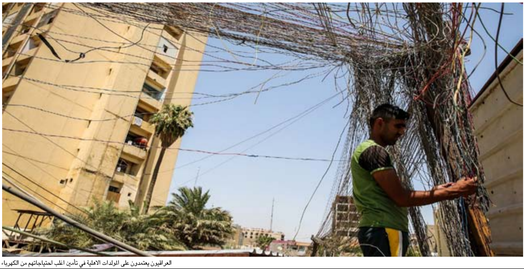
العراقيون يعتمدون على المولدات الاملية في تأمين اغلب احتياجاتهم من الكهرباء

يعمل على إنشاء ثلاثة مشاريع مهمة لتصفية الوقود