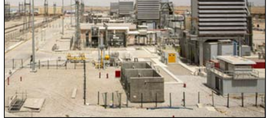
جهود مستمرة في تطوير قطاع الكهرباء

وبيّن، أن «كمية 800 إلى 900 مقيم كافية لإنشاء 3500 إلى 4000 ميغا واط ولذلك نضطر