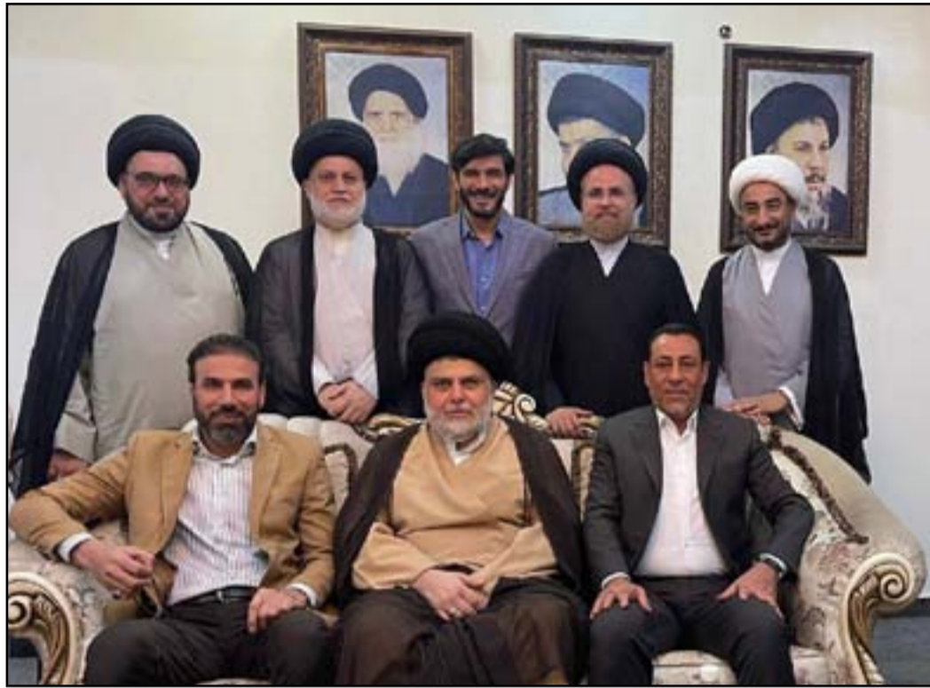
صورة تجمع الصدر مع أعضاء اللجنة المكلفة على تنظيم الصلاة الموحدة التي دعا إليها مؤخراً

بالمقابل، ان البيانات الحكومية العراقية التي صدرت عقب تلك الزيارات، أكدت بانها جاءت ضمن «الجهود التي يبرها العراق للوساطة بين المملكة العربية السعودية والجمهورية الإسلامية». وبحسب وسائل اعلام خليجية، ان