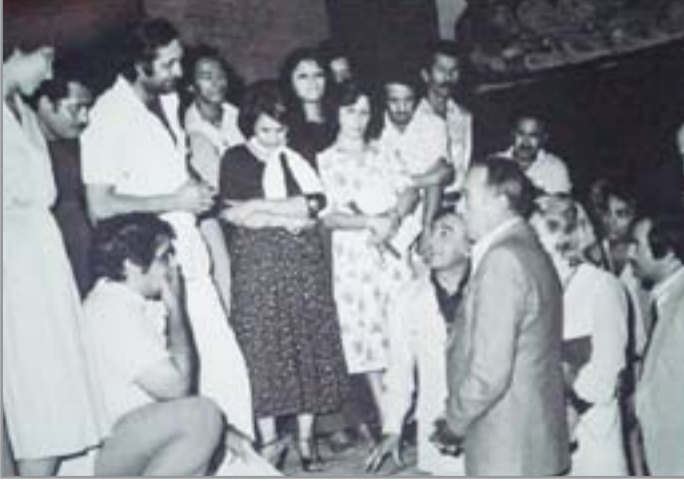
انتوني كوين ومجموعة من الفنانين