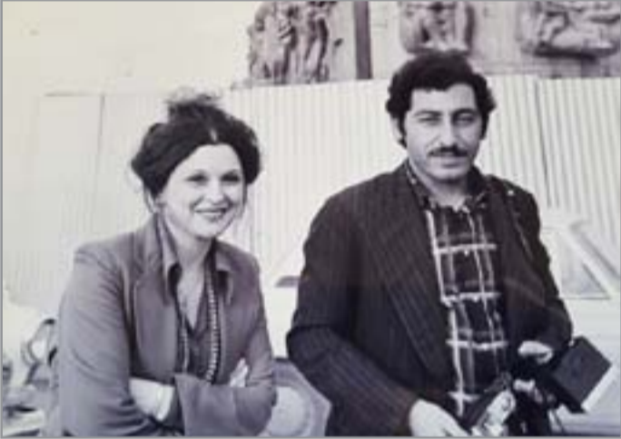
مع سعاد حسني

انتوني كوين ومجموعة من الصحفيين حسني، وليلى طاهر، وعزت العلابي، ومحمد صبحي، وعادل امام، وآخرين.. وكذلك من الفنانين العالميين، مصطفى العقاد، وانتوني كوين، واوليفر ريدي.. ومن المحطات المهمة هو تصوير مسرحيات الدائرة الى فرق أهلية كان لها دور بارز في الحركة المسرحية العراقية، مثل فرقة مسرح الفني الحديث، وفرقة مسرح اليوم، وفرقة المسرح الشعبي، وغيرها، الا ان الفرقة القومية اهتمت خاص مني كونها الفرقة التي تعود بشكل رسمي لدائرة السينما والمسرح، فقد كنت مصاحبا مؤثقا بصريا وفوتوغرافيا ابتداء من مسرحية (وحيدة) وحتى آخر مسرحية لهذه الفرقة.. فقد كنت أصور أحداث التدريب في مرحلة (الجنرال بروفة) واثناء العمل، من ديكورات وممثلين ومخرجين وحتى الفنيين المساندين، وبهذا عندي تصور كامل على نشاط هذه الفرقة منذ تأسيسها.. ومن نشاط اضع أمام المسؤولين بالدائرة، وايضا في وزارة الثقافة، بإصدار كتاب توثيقي مصور عن هذه الفرقة لتكون مرجعا للدارسين، وشهادة للتاريخ الثقافي. وهو جزء من الكثير من الأفكار.