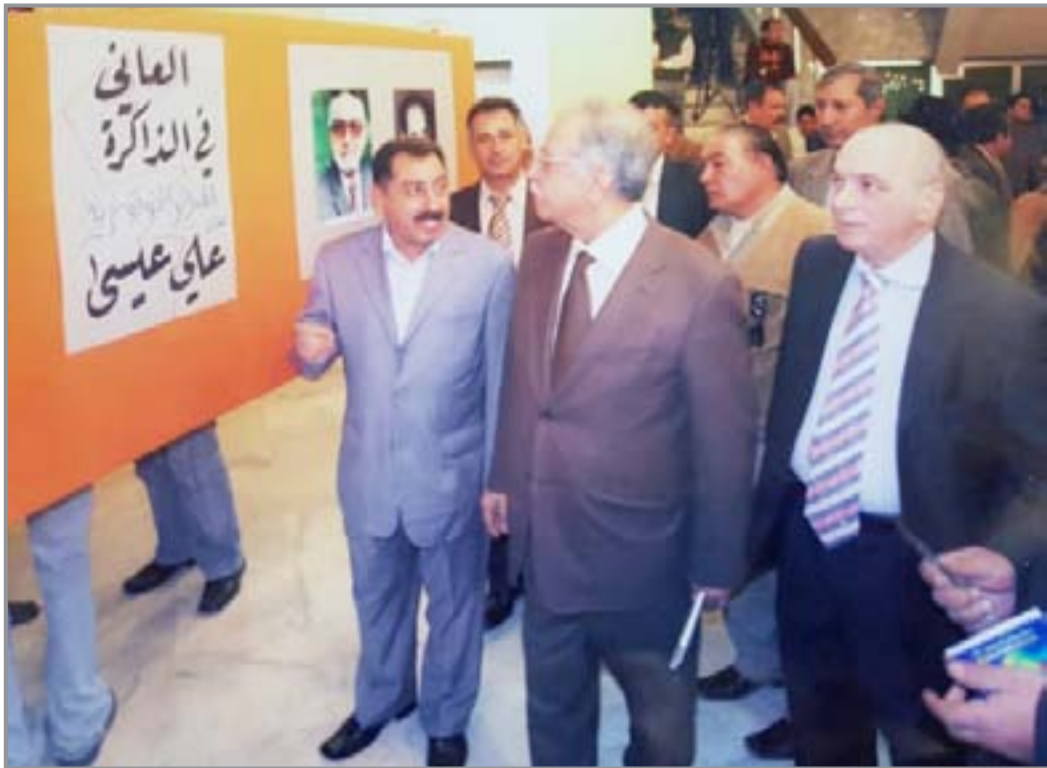
في افتتاح اسبوع المدى الثقافي الثالث في بغداد

وثقت الكثير من الافلام السينمائية التي أنتجتها الدائرة، ولكنني احتفظ بشكل خاص وبعتران بصور كثيرة للمخرج الكبير محمد شكري جميل، فقد شاركته جميع الافلام التي اخرجها، وبسبب عادة المخرج جميل بتصوير الاماكن والتفاصيل المهمة وحتى الكاستنج، قبل البدء بإخراج العمل، فقد كان حريصا ان يصطحبني الى مواقع تصوير كل افلامه، لذلك افكر يوما أيضا في أن اقيم معرضا لهذه الصور فقط.