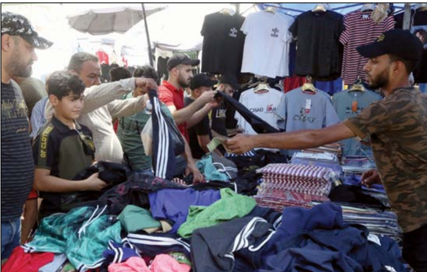
بغداديون في سوق الشورجة لشراء ملابس العيد... عدسة: محمود رؤوف

«الصدر» الاعتزال عن عملية تشكيل الحكومة، أزمة داخلية وخارجية. وفتح النقود المفترض لـ «الإطاريين» بالسلطة بعد انسحاب الصدرين، باب الإنشاقات والخلافات داخل تلك المجموعة بسبب شكل الحكومة والمناصب. التفاصيل ص 3