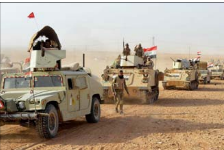
قوات عسكرية تنفذ واجبات ضد داعش في ديالى

دورا محوريا في عمليات تحرير ديالى في 2014 من خلال تدمير عشرات المفخخات عن بعد وسد الفراغات وإنهاء أية حركة لمركبات داعش بين القواطع الأمنية».