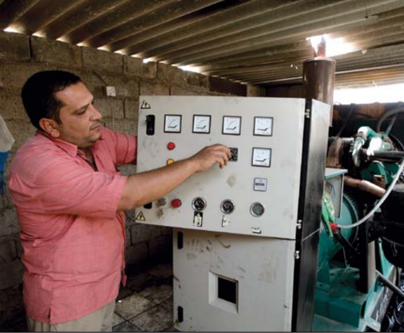
اصحاب المولدات الأهلية يرفضون الالتزام بالتسعيرة الرسمية للأميير