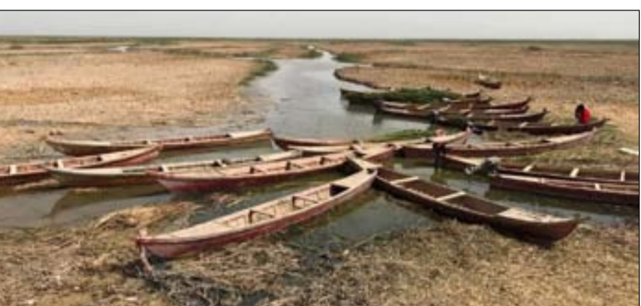
مخاطر بيئية كبيرة تهدد ذي قار