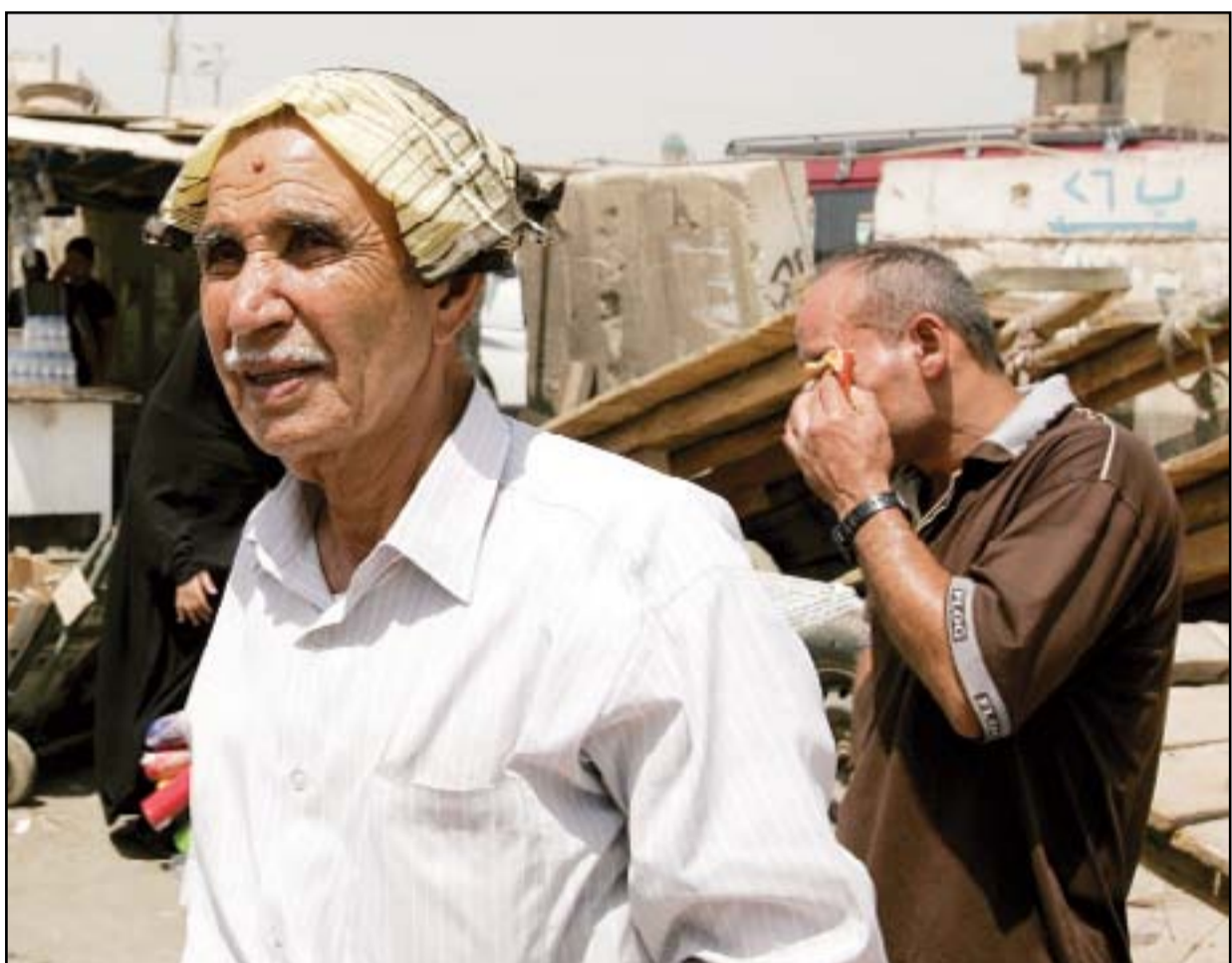
الطقس في العراق يسجل درجات حرارة خسبينة... عساة: محمود رؤوف