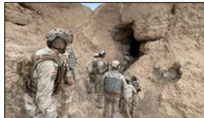
جنود عراقيون يلاحقون عناصر داعش في مناطق جبلية

وكانت القوات الأمنية قد أطلقت في وقت سابق ثلاث صفحات من عملية الإرادة الصلبة انتهت إلى تحقيق نتائج مهمة على صعيد قتل العديد من الإرهابيين وإلغاء القبض على آخرين والعبور على مضافات ومعلومات مهمة.