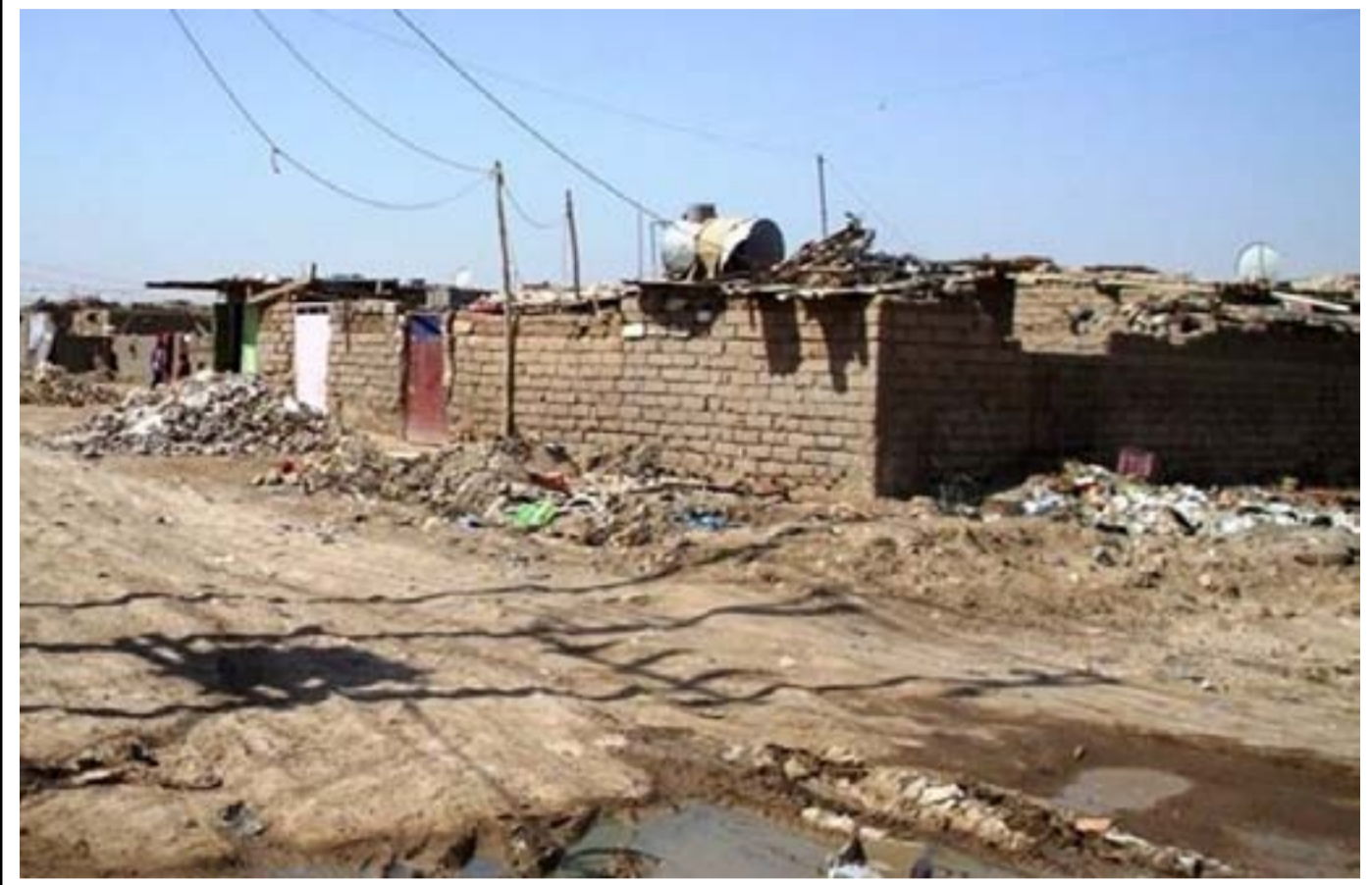
العشوائيات بيئة خصبة للجرانم والاعمال المخالفة للقانون

أفاد تقرير، بأن العقارات في العراق هي الأعلى ثمناً في دول المنطقة، فيما تحدثت عن تفاقم أزمة السكن والانتشار الكبير للعشوائيات والتجاوزات على ممتلكات الدولة، يأتي ذلك في وقت أشار مسؤولون حكوميون إلى القيام بالعديد من المشاريع من أجل معالجة أزمة السكن منها إنشاء مدن ضخمة وتقديم قروض ميسرة، فيما اتهمت لجنة نيابية، الحكومة بأنها فشلت في تنفيذ مبادرة (داري).