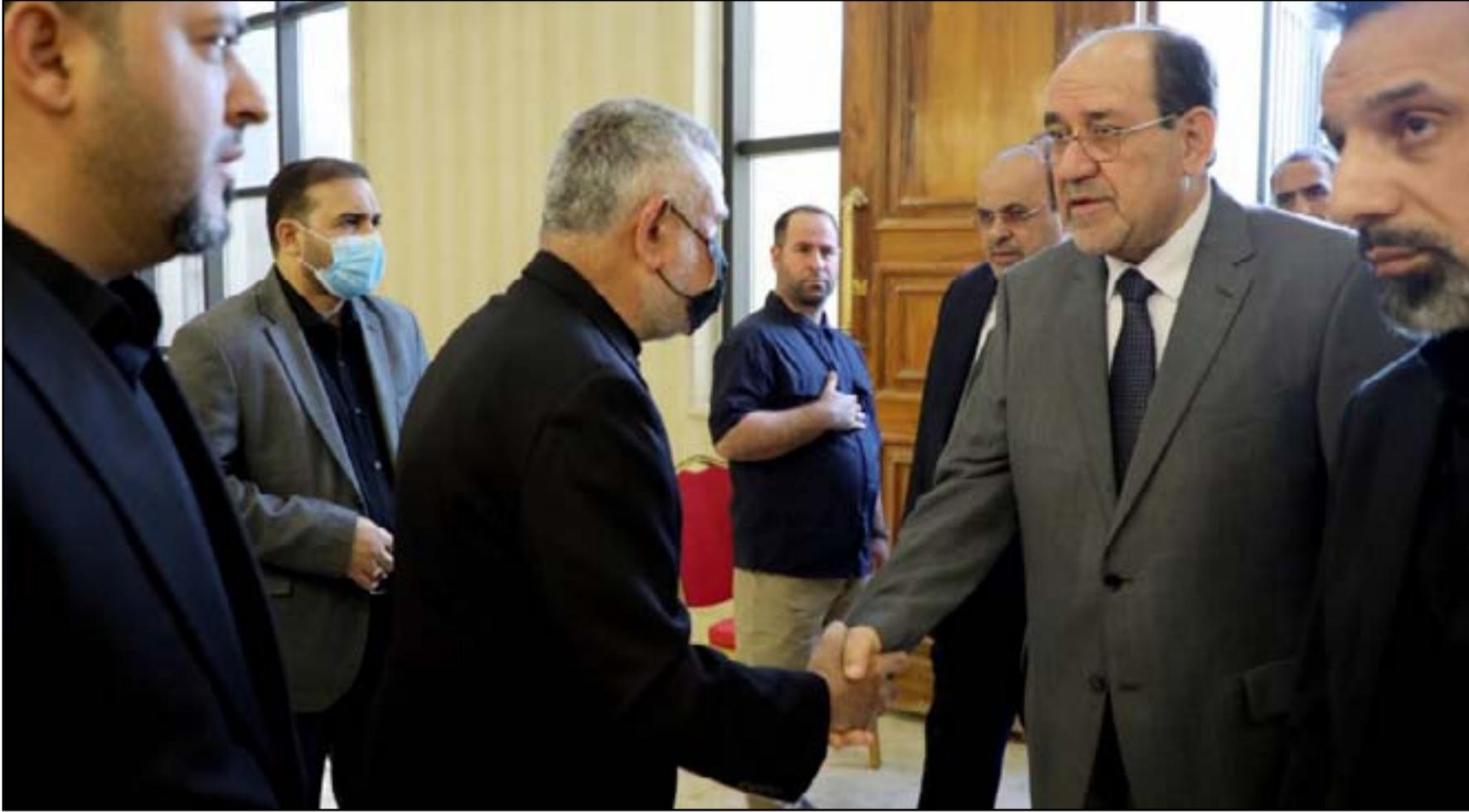
انتهاء حظوظ المالكي والعامري في الحصول على منصب رئيس الوزراء

وأضاف البيان أن «التحقيق الأصولي بخصوص التسريبات يجري وفق القانون». وهذه المرة الأولى من بعد 2003 يقرر