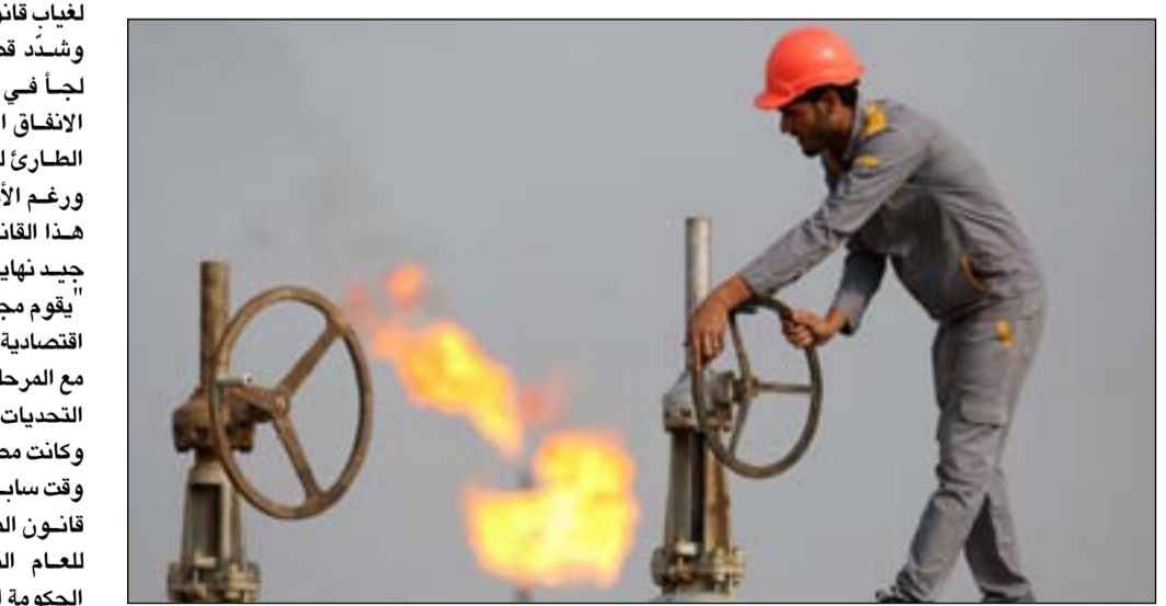
العراق يعتمد على النفط في معظم إيراداته المالية

وشرده. وشدد قصي، على أن "البرلمان لجأ في وقت سابق إلى تعزيز الاتفاق العام بسن قانون الدعم الطارئ للأمن الغذائي والتنمية، ورغم الأموال التي سوف يأخذها هذا القانون سيكون لدينا فائض جيد نهاية العام". ويتطلع، إلى أن "يقوم مجلس النواب بإقرار موازنة اقتصادية خلال العام المقبل تتناسب مع المرحلة وحجم الإيرادات وتعالج التحديات المالية والاقتصادية". وكانت مصادر حكومية قد أكدت في وقت سابق عن البدء بإعداد مشروع قانون الموازنة العامة الاتحادية للعام المقبل، على أن تتولى الحكومة المقبلة تقديمه إلى البرلمان وتشريعه.