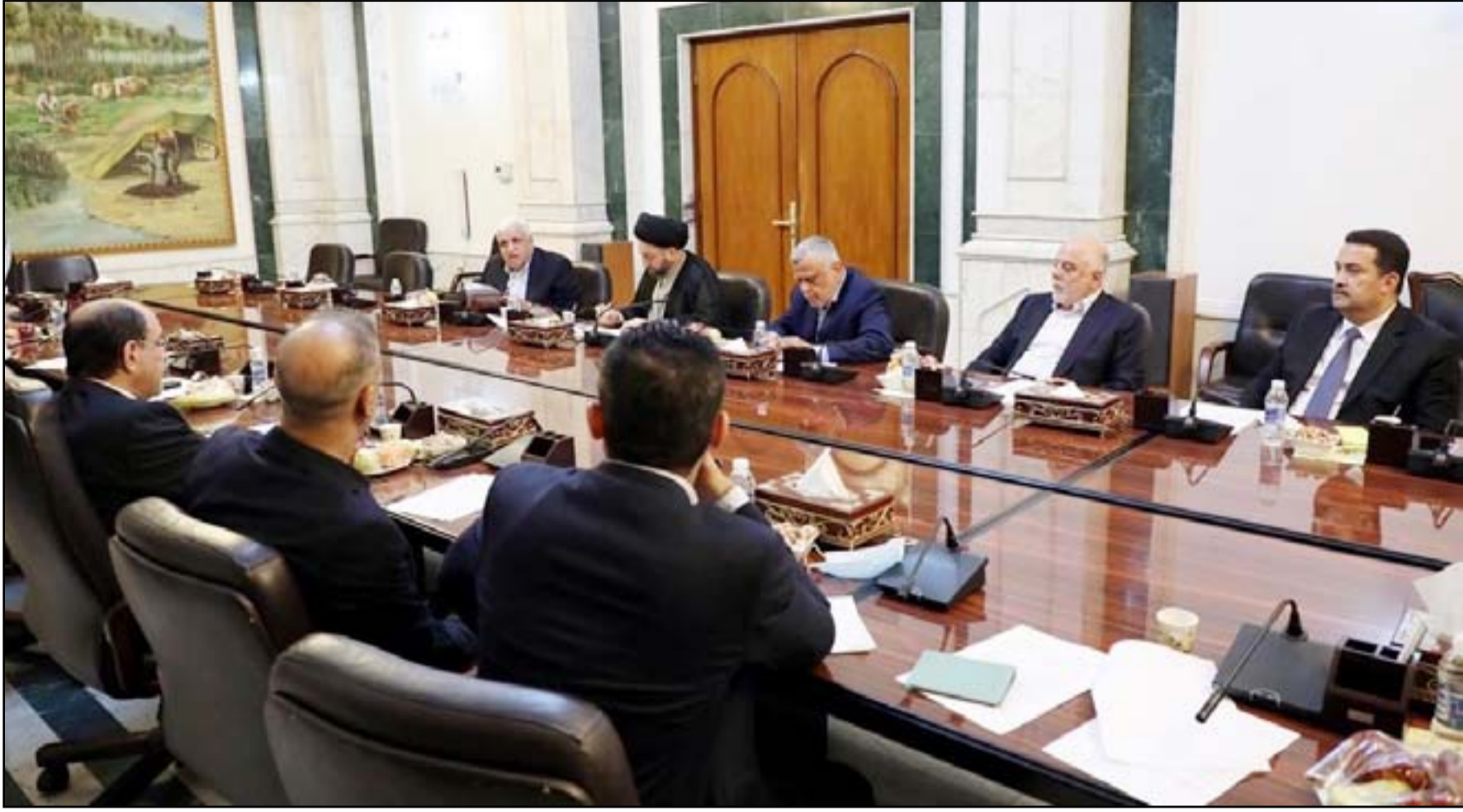
شركاء المالكي في الاطوار يبحثون عن آلية لاختيار رئيس الوزراء تبعده عن الترشح