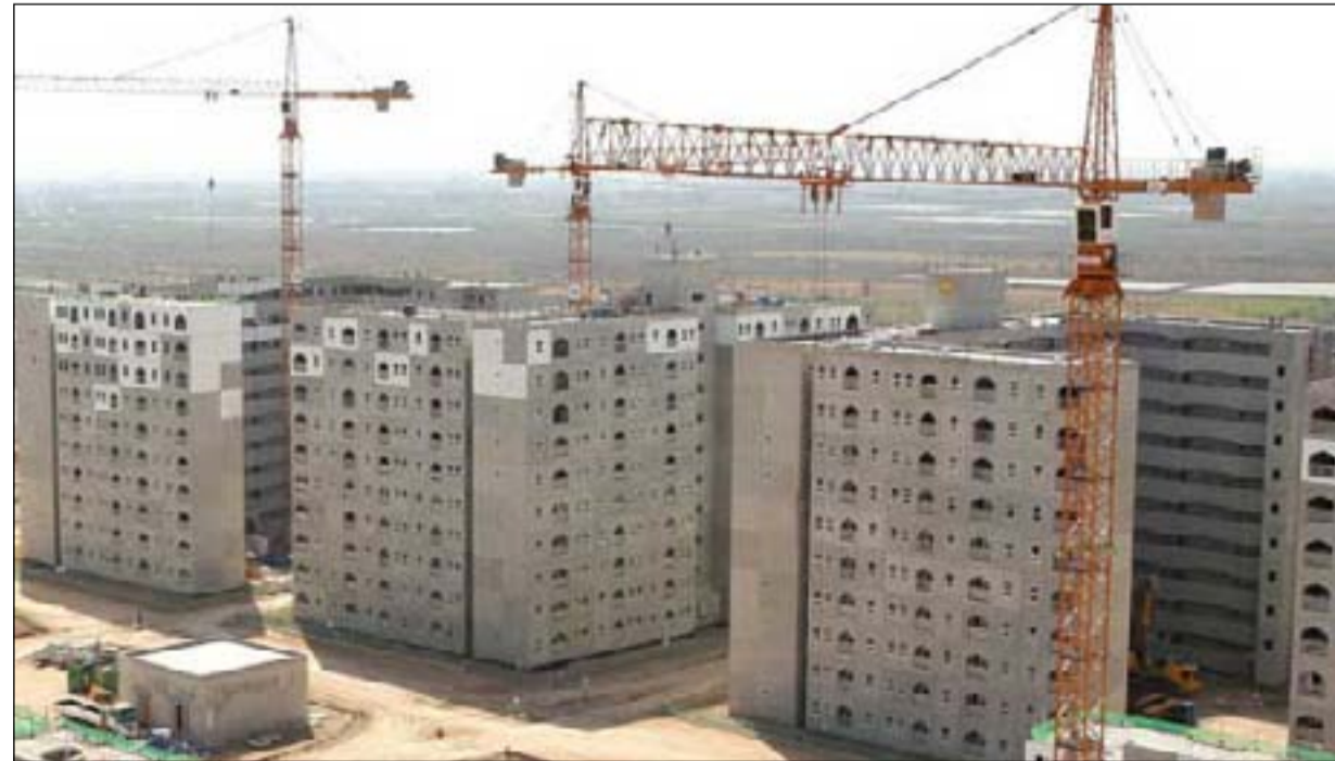
المنظمات الدولية توشر استمرار الفساد في المشاريع الاستثمارية بالعراق