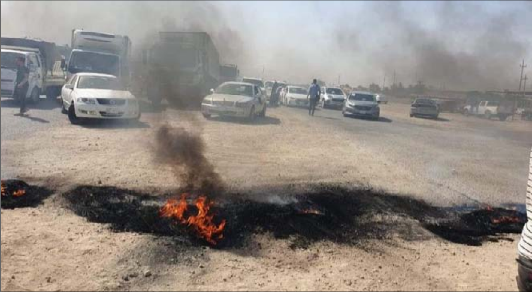
متظاهرون في الناصرية يقطعون الطريق المؤدي إلى بغداد