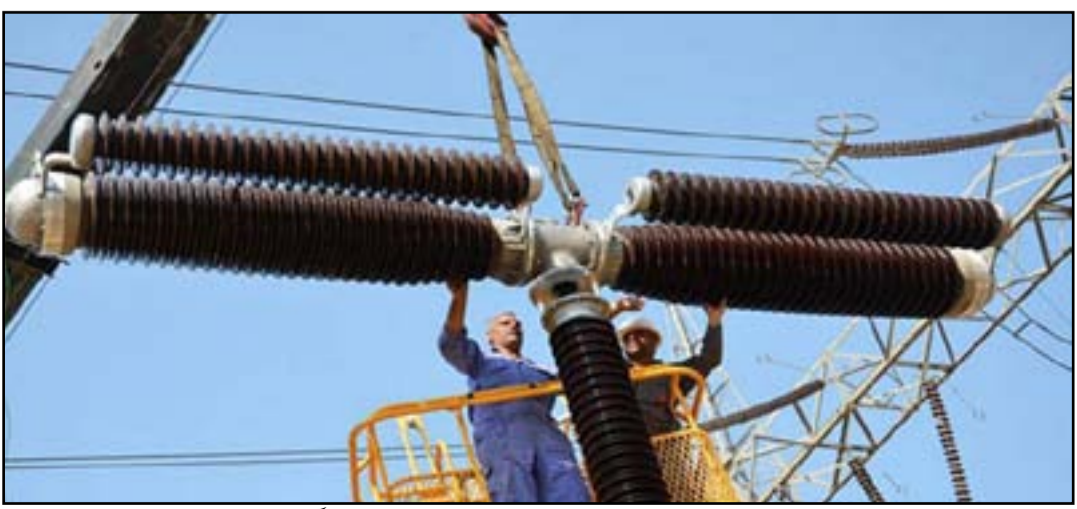
الكهرباء تؤكد انها تبذل جهوداً كبيرة لضمان استقرار الشبكة

التزام بعض المحافظات بحصتها المقررة من الطاقة ما زاد الأحمال على الخطوط وتصريفها وأثر سلبا على بعض المناطق الجنوبية وخصوصا البصرة وميسان وذي قار وتمت إعادة هذا الخط والعمل بعد إزالة العارض عن الوحدات التوليدية». ولفت موسى، إلى أن «الوزارة كما تواجه تراجعا في ساعات التجهيز، لكن هناك أعمالا وإنجازا لملاكات وزارة الكهرباء تتمثل في زيادة بنسبة 22% عما كانت عليه المعدلات العام الماضي». وشدد، على أن «المنظومة تتمتع باستقرار من حيث توفير الطاقة واستحسان نسبي من المواطن إزاء ساعات التجهيز، نتيجة إدخال طاقات توليدية جديدة مع خطوط نقل قد دخلت إلى العمل ودعم وتأهيل قطاع النقل». وأورد موسى، أن «الوضع ليس مثاليا من حيث ساعات التجهيز، لكن هناك فرقا ما بين العام الحالي والوقت الحالي»، مؤكدا أن «رئيس الوزراء مصطفى الكاظمي عند استضافة وزير الكهرباء عادل كريم والطاقم المتقدم في الوزارة، قدم شكره لجهود ملاكات الكهرباء».