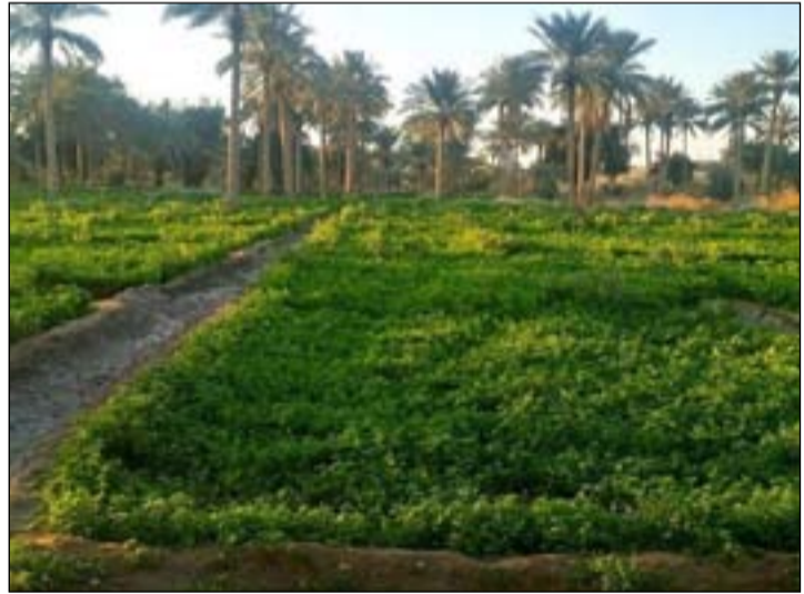
مزارع ديالى تودع الأفعى السوداء،

وأضاف عبد الرزاق، أن "هناك فوائد عدة للأفعى اليهودية أبرزها أن شحومها تستخلص منها دهن مغذية للشعر المساقط، بالإضافة إلى أن لحمها مفيد لمن لديه أمراض سرطانية، لكن الاستخدام