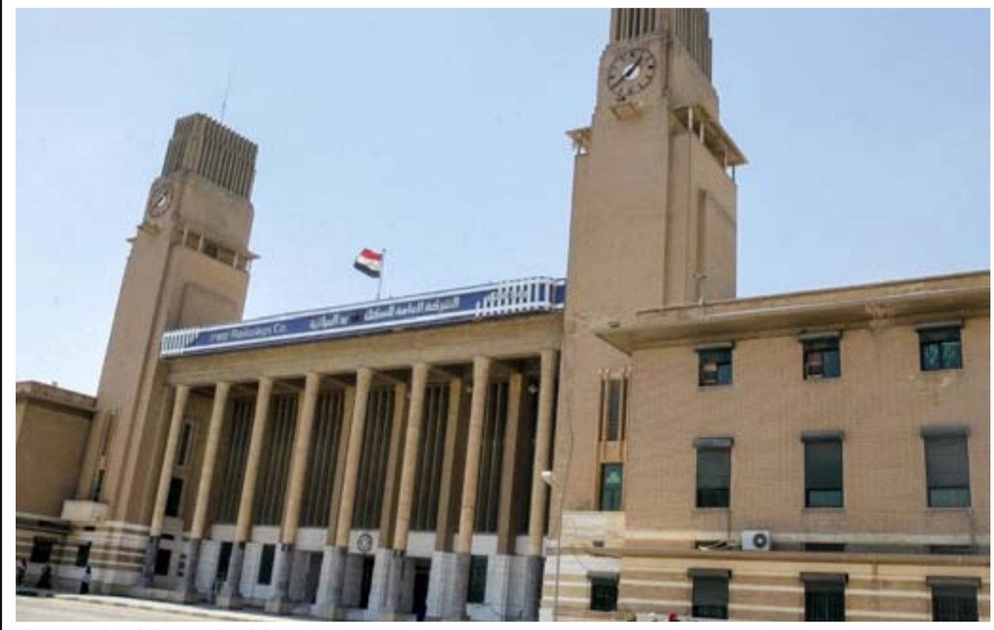
الواجهة الخارجية لمحطة السكك المركزية في بغداد

■ الطريق بين منطقتي العلاوي والشعب سيستغرق 23 دقيقة فقط