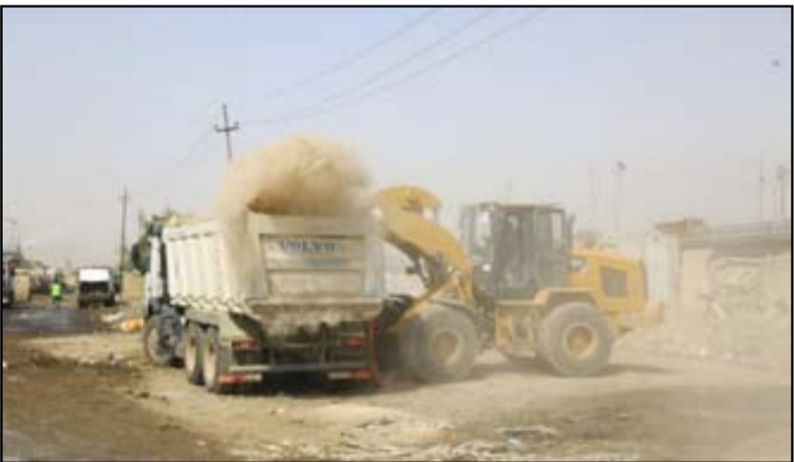
عجلات تابعة لأمانة بغداد ترفع الانقاض من معسكر الرشيد

هو بسبب وجود قوات أمنية، والتي طلبت التريث لحين نقل معداتهم وقوادعهم الى مناطق أخرى». بدعم من شخصيات هناك أرادت الاستثمار بمعسكر الرشيد، ولكن عمليات البناء تأخرت كثيرا، لافتا إلى أن «هيئة الاستثمار قدمت إنذارات عديدة للشركة ولكن شخصيات مهمة بالإمارات تدخلت وتم تسويق الموضوع».