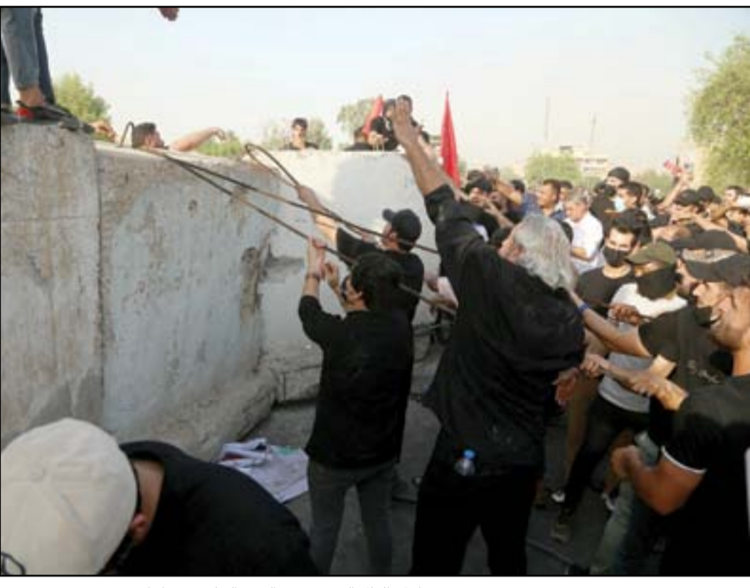
اتباع الإطاريين التمسوقي قرب الجسر المعلق في بغداد امس...

السياسية قبل نحو شهر، وتجلت مؤخرًا في خطاب "منفرد" لزعيم تحالف الفتح هادي العامري جدد فيه دعوات الحوار بين الطرفين (التيار والإطاري). وقدم "الصدر" مقابل ذلك شروطًا إلى صديقه القديم أيام التفاوض أثناء أزمة "الأشهر الثمانية" التي لحقت بالانتخابات التشريعية، لجلوس الأول إلى طاولة المفاوضات، فرتبت باتجاهين: بانها نقاط تعجيزية، أو موقف مرن بعد خطاب "تغيير النظام" التصديدي. ولترصين جبهة الصدر" يقول مقربون من التيار (المدى) أن: "الصدريين