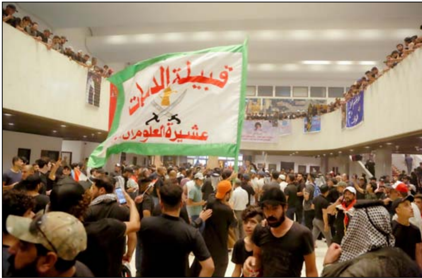
تجمعات عشائرية في البرلمان أمس

واضاف العراقي في تغريدة على «تويتر»: «تكررت دعوة الأخ العامري للحوار بين الإطار (الذي ينتمي له) وبين التيار الصدري الذي تخلى عنه». وتابع: «فأقول: إننا لو نزلنا وقبلنا الحوار فذلك مشروط بما يلي: أولاً: انسحاب الأخ العامري وكتلته من الإطار، ثانياً: استنكار صريح لكلام