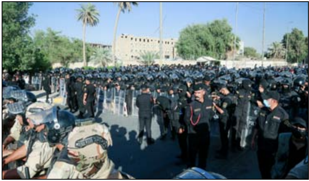
قوات عراقية توفر الحماية للمتظاهرين

ونكر الائتلاف في بيان تلقته (المدى)، أن «العراق واجه خلال الأيام الماضية تطورات خطيرة في تصعيد المواقف بين أطراف الأزمة السياسية والانتخابية ناسين