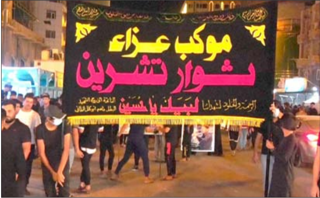
موكب حسيني يستذكر شهداء انتفاضة تشرين

وأضاف كريم، ان "الخطة تتضمن نشر المزيد من القوات الأمنية والدوريات الالية والرجالة في مواقع اقامة المواكب الحسينية والميادين العامة والاسواق