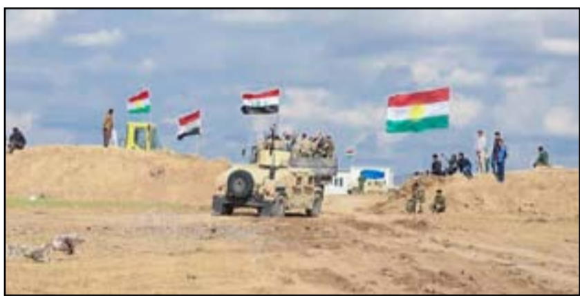
عمليات لملاحقة داعش

في اليوم ذاته القبض على 6 إرهابيين في نينوى، فيما أعلنت هيئة الحشد الشعبي، الأحد الماضي، تدمير ثلاث مضافات وزورق لعناصر داعش الإرهابي جنوب تكريت بمحافظة صلاح الدين، وتزامنا مع تلك الأحداث نفذت قوة أمنية مشتركة من الجيش العراقي والحشد الشعبي عملية تفتيش في محافظة الأنبار.