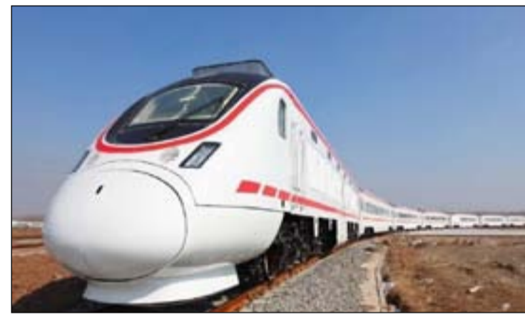
وزارة النقل تسعى للاهتمام بقطاع القطارات

وتابع: "وقعنا مع الشركة الإيطالية عقداً لوضع تصاميم جديدة تبدأ من ميناء الفاو إلى تركيا حيث الربط يكون ما بين الشرق والغرب وبين تركيا وميناء الفاو وهذا أيضا ستكون من خلاله عدة تفرعات الطرق"، مشيراً إلى أن "هذه المخططات سوف تنجز نهاية الشهر الثامن". وخصوصاً القطارات، قال الشبلي: