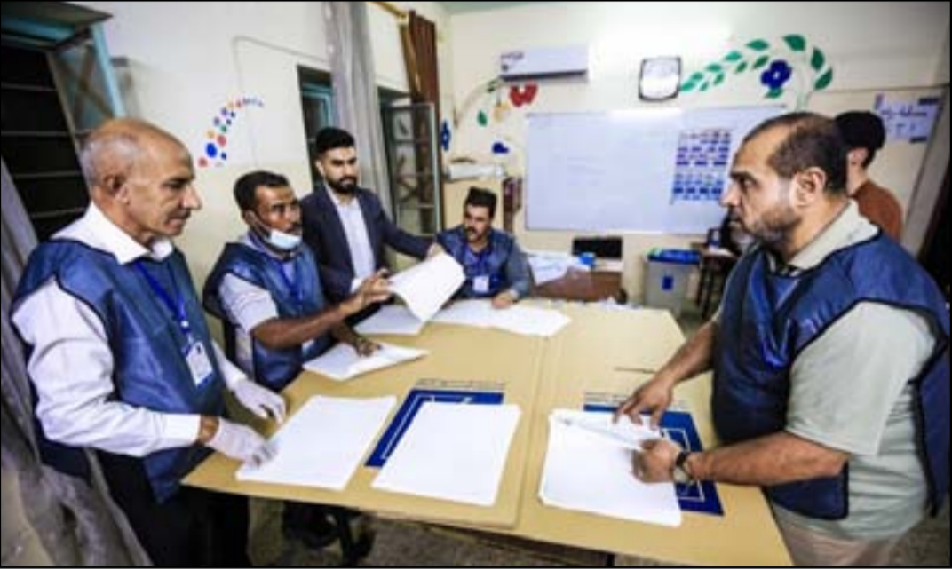
جدل سياسي كبير بسبب مطالبات إجراء انتخابات مبكرة