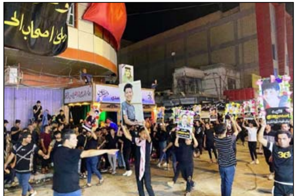
مواكب حسينية في ذي قار ترفع صور شهداء ومغيبين انتفاضة تشرين

وبدورهم، أعرب عدد من اسر ضحايا التظاهرات والمتظاهرون المشاركين في المواكب الحسينية عن استنكارهم