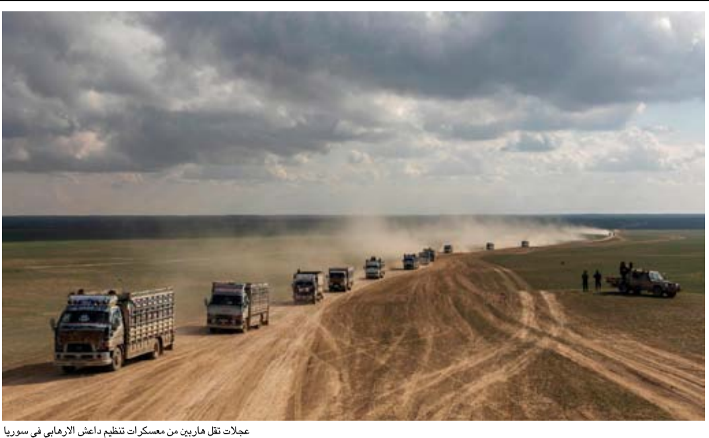
عجلات نقل هاربين من معسكرات تنظيم داعش الإرهابي في سوريا

العراق هي تدقيق أسماء النازحين وفقاً لقوائم من جهات عشائرية". وبين، أن "زعماء عشائريين من الإنبار شاركوا في جلسات حوارية أقامها معهد الولايات المتحدة للتسلم حول هذه القضايا واجتمعوا مؤخرًا مع مسؤولين حكوميين، قدموا أسماء ٦٥٠ شخصاً قريباً في المخيم يريدون إرجاعهم وعرضوا المشاكل التي تستوجب إعادتهم وأوضح التقرير، أن "أحدى الوسائل الممكنة لتعجيل عودة هؤلاء النازحين وعملية إعادة دمجهم في المجتمع داخل