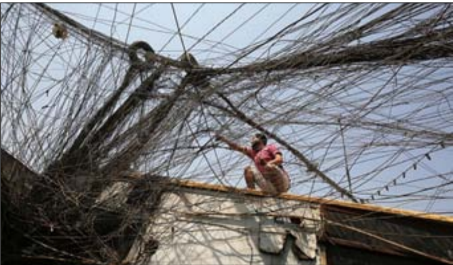
الكهرباء، تشكو كثرة التجاوزات على المنظومة الوطنية

وتعد أفة الفساد التي تختر مؤسسات الدولة أحد أسباب استمرار أزمة الطاقة، إلى جانب تعرض الشبكات لمشكلات فنية خارجة عن سيطرة الدولة، من بينها انخفاض مناسيب نهري دجلة والفرات وتوقف بعض محطات الطاقة في السودان، والعمليات الإرهابية التي تتعرض لها أبراج نقل الكهرباء بين الحين والآخر، إلى جانب استمرار الطلب المتزايد على التيار بمعدل سنوي يبلغ نحو ألفي ميغاواط.