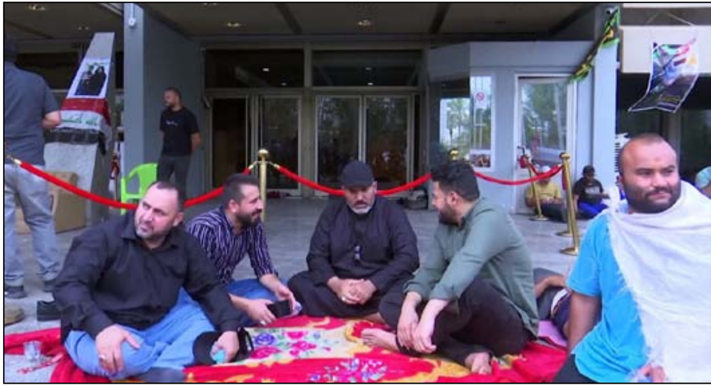
اتباع التيار الصدري يخلون مبنى البرلمان ويعتصمون أمامه

الحال، وفي خطابه المتلفظ الأخير قال: "استغلوا وجودي لإنهاء الفساد". لكن بالمقابل تقول أوساط التيار أنه "لا يوافق" بقاء انصاره في المنطقة الخضراء، الذي دعا إليه زعيم التيار الصدري، لكن قد تنقل مطالب تعديل الدستور والقضاء إلى البرلمان المقبل. وتتحدث أوساط الصدر عن امكانية بقاء حكومة مصطفى الكاظمي للعمل على إجراء "انتخابات مبكرة" بعد حل البرلمان. كما أكدوا امكانية "العمل وفق قانون الانتخابات الأخير ومفوضية الانتخابات الحالية".