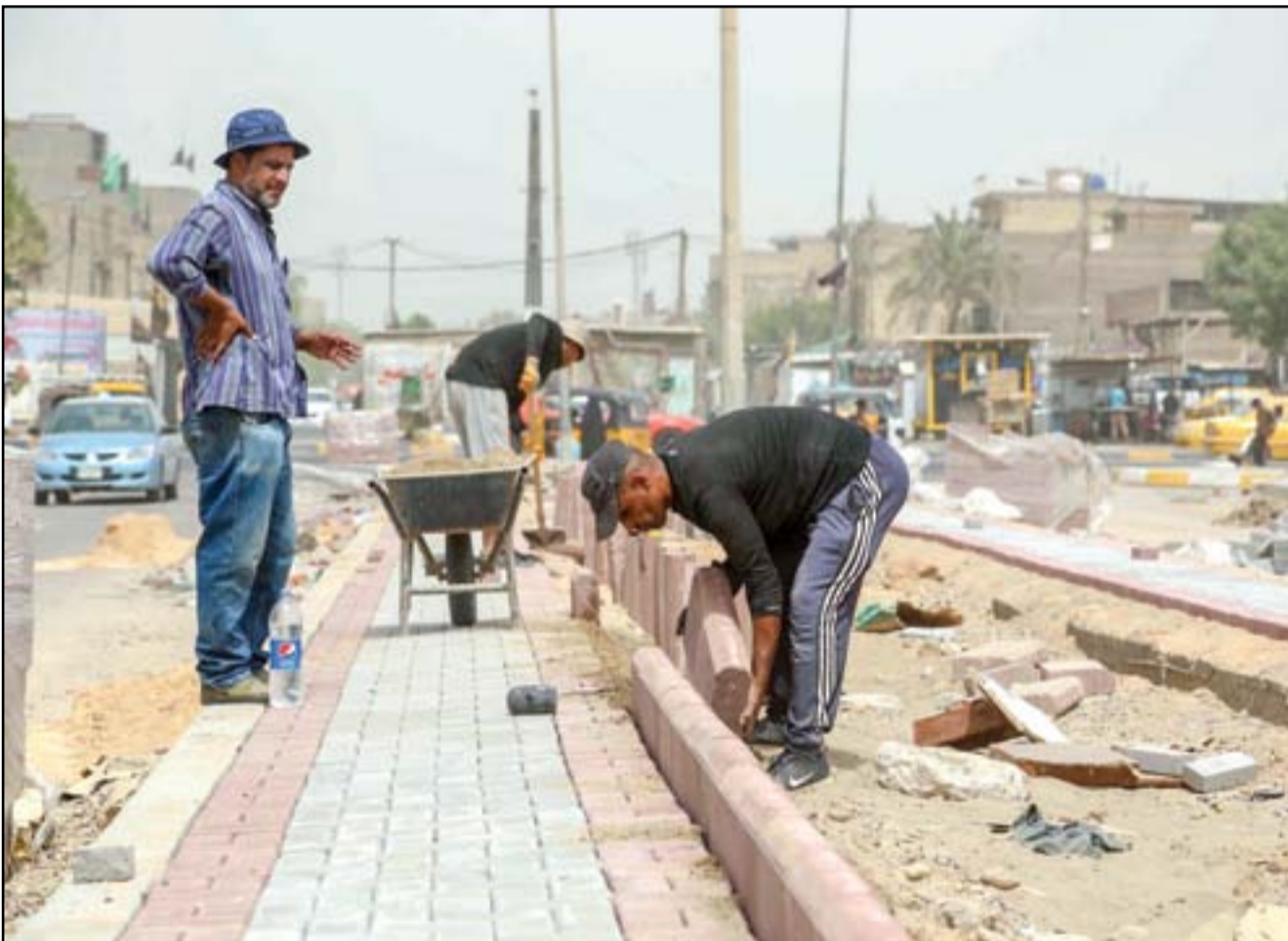
حملة خدمية في مدينة الصدر.. عسة: محمود رؤوف