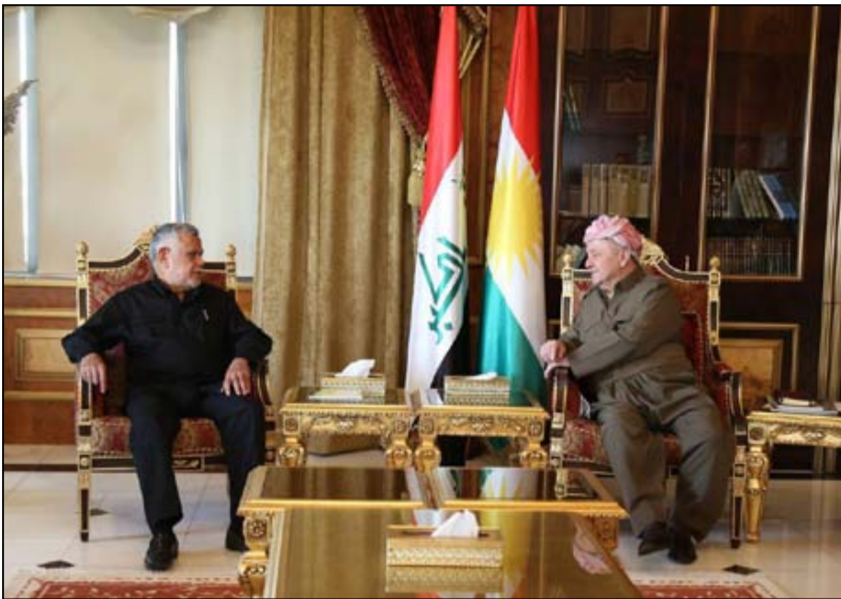
بارزاني يستقبل العامري أمس في اربيل

واستعرض المقرب من الصدر 7 مواقف لـ «الاطاريين» في الازمة الاخيرة وصفها بـ «فرض ارادات» وأبرز ما ذكره العراقي هي عبارة «ما نخطيها» وهي من أشهر عبارات زعيم دولة القانون