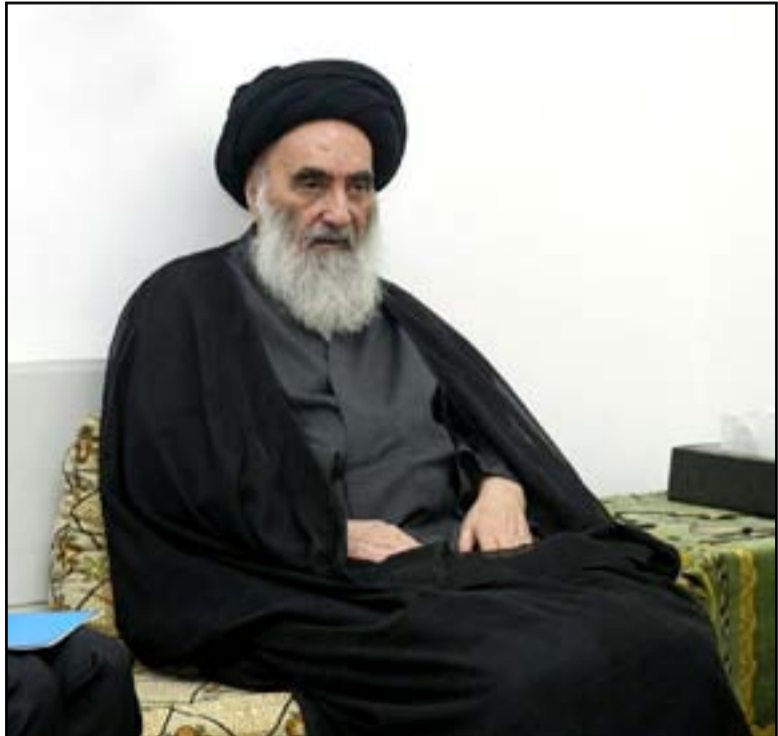
السيد السيستاني يراقب تطورات المشهد السياسي

ولفت، إلى «عدم وجود نية لأي من الطرفين أن يقدم تنازلات لإنهاء الازمة السياسية التي