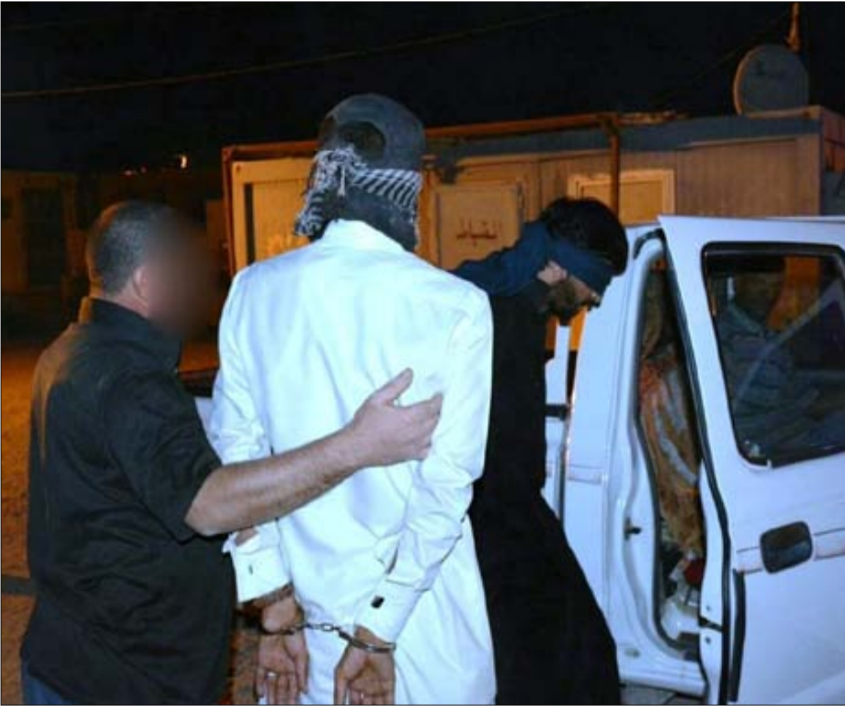
متهمان بقبضة القوات الأمنية في ذي قار

وأضاف الغزي، ان "الإيقاع بالشبكة جاء بناء على معلومات قدمها المتظاهرون له شخصياً وتضمنت تفاصيل عن عمل الشبكة وانتهاكاتها للقانون وممارستها للضغط والابتزاز في الدوائر الرسمية".