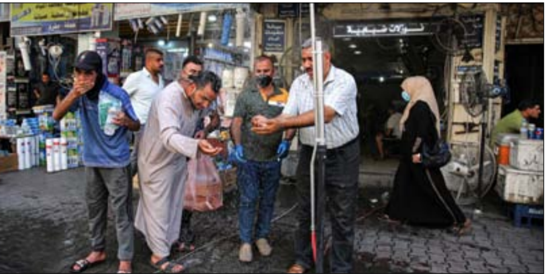
موجة جديدة من الحر تنتظر البلاد الأسبوع الحالي