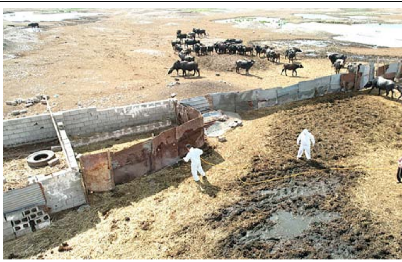
العراق يواصل تسجيل المزيد من الإصابات بالحمى النزفية

يشار إلى أن مراقبين تحدثوا عن وجود عدد كبير من المشاريع المتلكة في العراق، وأرجعوا ذلك إلى أسباب عديدة أبرزها الفساد وانعدام الرقابة من الجهات المختصة، داعين إلى محاسبة الجهات المسؤولة عن هذا التعطيل لاسيما وأن البعض منها يمس حياة المواطنين بنحو مباشر ويتعلق بالخدمات الصحية والمياه والمجاري والكهرباء.