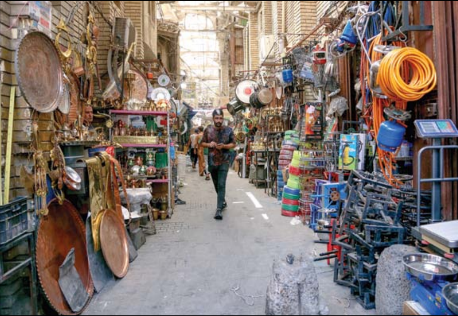
سوق الصفاغين في بغداد...

تستعد بغداد لتضيّف المؤتمر الثالث لحوار الأديان في شهر تشرين الأول من العام الحالي، وأكدت مسؤولية رفيعة المستوى في وزارة الخارجية أن هدف المؤتمر تعزيز السلام والتعاون الدولي، مشيرة إلى أنه سيشهد حضور أحد المؤسسات الرسمية