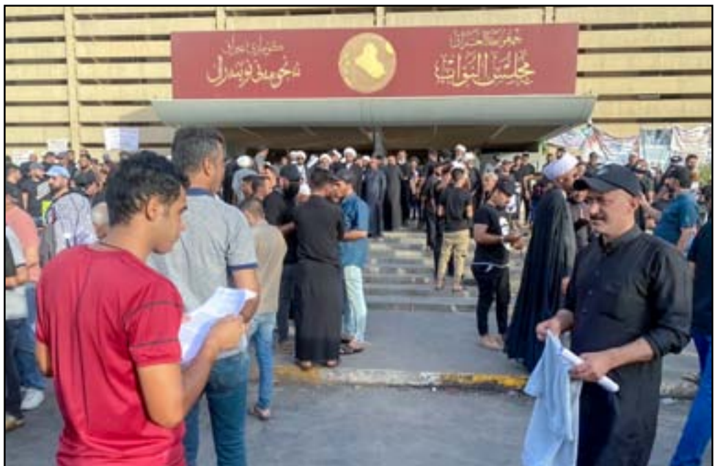
اتباع التيار الصدري من امام مبنى مجلس النواب

وأكد العرار، أن «زعيم التيار الصدري مقتدى الصدر يواصل رسالة إلى الشارع بأننا أمام فرصة أخيرة لتغيير واقع الحال والذهاب باتجاه عملية