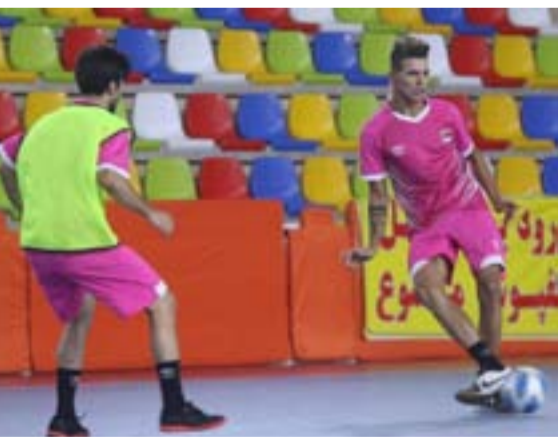
مدينته شيراز الإيرانية استعداداً لنهائيات آسيا التي ستقام في الكويت للفترة من ٢٧ أيلول إلى ٨ تشرين الأول ٢٠٢٢.

مدينة شيراز الإيرانية استعداداً لنهائيات آسيا التي ستقام في الكويت للفترة من ٢٧ أيلول إلى ٨ تشرين الأول ٢٠٢٢. ويواجه منتخبنا تايلاند يوم ٢٧ أيلول المقبل بالساعة ٢ ظهراً، ويلتقي عُمان يوم ٢٩ منه في تمام الساعة ٥ عصراً، ثم يختم مبارياته دور المجموعات أمام الكويت في الأول من تشرين الأول القادم الساعة ٨ مساءً.