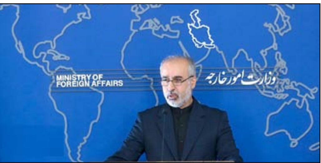
جانب من المؤتمر الصحفي للمتحدث باسم وزارة الخارجية الإيرانية