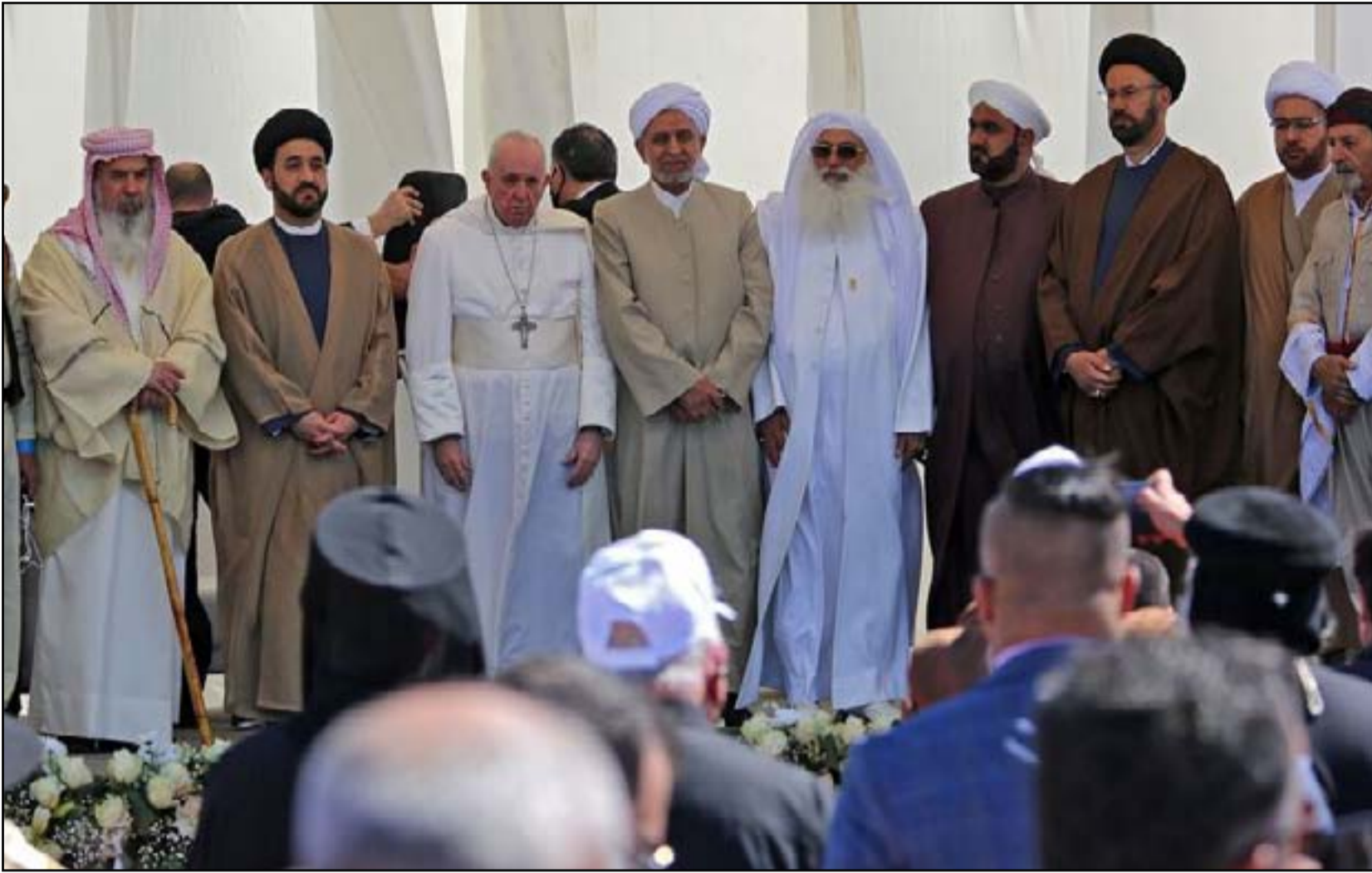
البابا يقف مع شخصيات دينية عراقية في مدينة أور القديمة العام الماضي