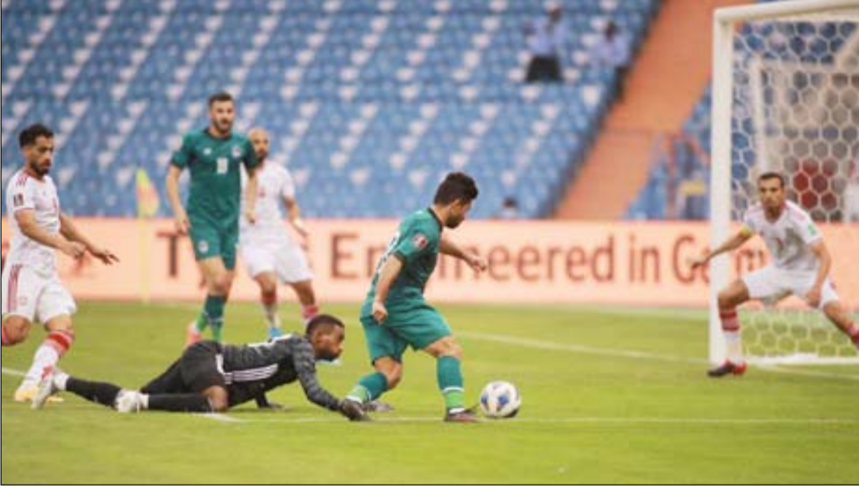
به كل مسؤول سواء في الرياضة أم غيرها أن يوفر فرص عمل للأكفاء ليخدموا بلدهم، وبالنسبة لنا كأساتذة في الجامعة نتمنّع برواتب جيّدة ومكانتنا الاجتماعية محترمة ولا نفكر بمنافع الاتحاد بقدر مساهمتنا في إحياف تدرج رياضةنا ومنها كرة القدم الى هاوية، فالأمم تبني بجهود المصادقة عليها من قبل المكتب التنفيذي وتعلن أسماء وسائل الإعلام كي تتحمّل المسؤولية الكاملة، مع تطبيق النوازل والعقاب كوسيلة لتقييم العمل."

واختتم د.لزام حديثه "أجهل تغييريني من قبل عدنان درجال وهو أحد طلابي في كلية التربية البدنية وعلوم الرياضة لمدة أربع سنوات، وليس لدي تقاطع معه، وأعلن عبر المدى عن استعدادي لكتابة ورقة إصلاح لكرة العراقية بالتشاور مع كل المبدعين المخلصين من تخصصات متنوّعة وتأخذ بأراء المختلفين والمتواقفين وتصبّ الجهود جميعاً في النهاية لإقناع اللجنة من الهاوية المخيفة التي نهجل مصيرها، وأن الأوران أن تضع معايير علمية لاختيار اللاعب ولا مكان للكشافة بعد اليوم، فالوهوب يُعرف عن نفسه في مسألتيّ فطريّتين هما الذهنية مثل ردة الفعل القوية والاستجابة الأقوى والبدنية الخاصة بالسرعة والقوة، وهي أمور كاملة لا ترى، بل عبر اختبارات فنيّة مُعقّنة علمياً تستلزم زج أكثر من ٤٠ كلية للتربية البدنية وعلوم الرياضة في ثورة إصلاح كروية كبيرة."