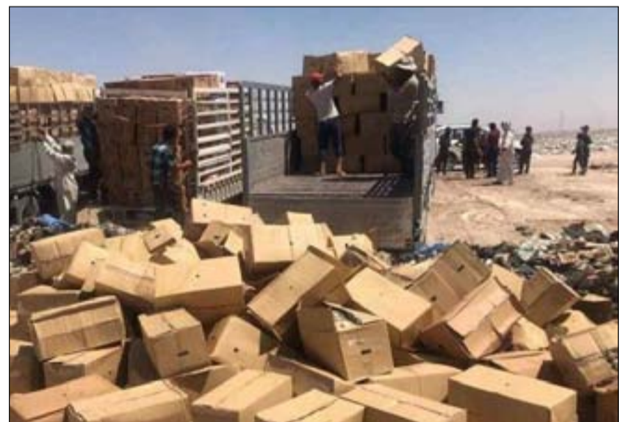
عملية إتلاف لواد غذائية منتهية الصلاحية