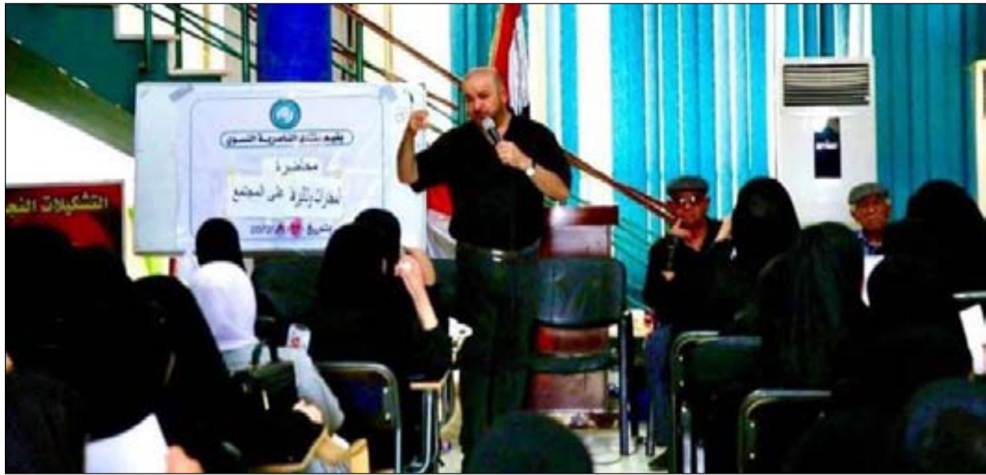
جانب من ندوة منتدى الناصرية النسوي