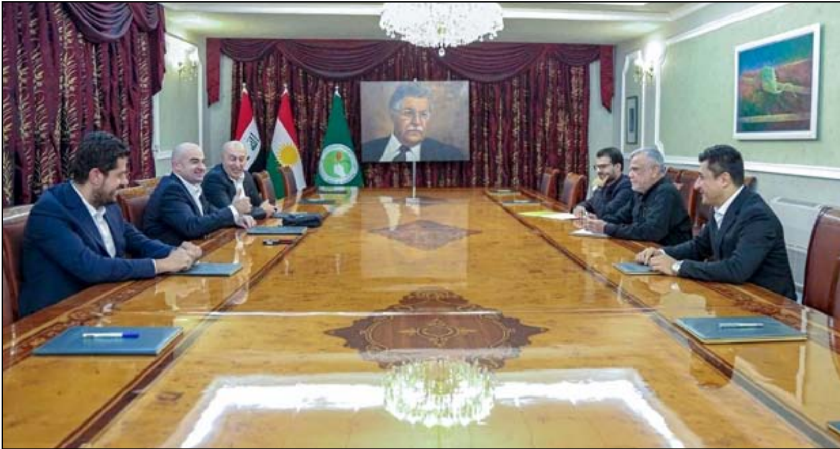
جولة العامري في إقليم كردستان شملت اللقاء مع جميع القوى الكردستانية

واشار «وزير القائد» أكثر من مرة الى انه كان يخاطب في التغريدة الاخيرة كتلة الخزعلي