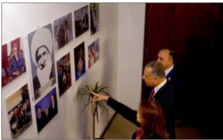
في هذا المنزل كتب الجواهري الكثير من انعاش مرحلة مهمة عاش فيها العراق، في السبعينيات وما لحقها والدكتاتورية، حيث

افتتح رئيس مجلس الوزراء السيد مصطفى الكاظمي، بيت الشاعر العرب الأكبر محمد مهدي الجواهري في منطقة القادسية بالعاصمة بغداد، بعد إعادة تأهيله. وأكد الكاظمي خلال حفل الافتتاح لمنزل الجواهري ان حكومته حريصة على رعاية الثقافة، واستحضار السيرة الوضاعة لمبدعي العراق، ومآثرهم الفكرية والثقافية. وأشار إلى أهمية افتتاح بيت الجواهري كونه إحدى القامات الشعرية والصحفية التي يفخر بها العراق، مقدماً شكره لكل الجهود التي ساهمت في إعادة إعمار بيت الجواهري، وإظهاره بالشكل الذي يعكس رمزية شاعر أرح بشعره نضال الشعب العراقي والعربي، حتى صار شاعر العرب الأكبر، وليس شاعر العراق فقط. وبين أن "شعر الجواهري المفعم بالوطنية والإنسانية والانفتاح والحوار، يدعونا اليوم للخروج من التخندق الفئوي للخروج من الشخصية، والذهاب إلى رحاب الوطنية الواسعة والشاملة للعراقيين جميعاً". خيال الجواهري، ابنة شاعر العرب الأكبر كانت ضمن المفتحين لمنزل والدها ونكرت في حديثها لـ(المدى)، انها "تشعر بسرور ومفخرة كبيرتين لافتتاح منزل الجواهري، هذا الشاعر الذي قدم الكثير الى العراق". واضافت ان بيت الجواهري الذي تم افتتاحه هو الاول والاخير وهو