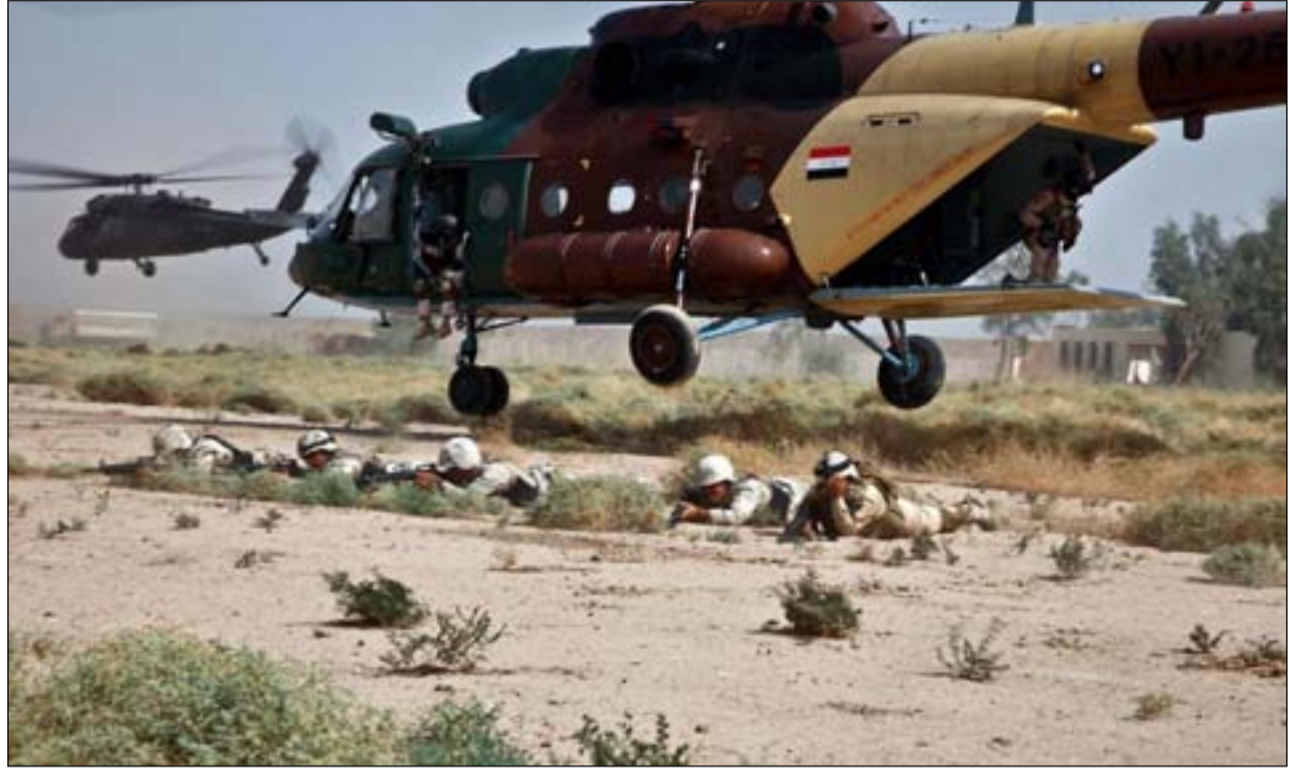
عملية أمنية للجيش العراقي باسناد مروحي

ونوه، إلى أن "تراجع عمليات الصيانة والدعم اللوجستي للطائرات (مي-17) المروحية تسبب في احداث تناقص كبير في معدل قدرة مهام الطائرة المرتبطة ب وحدات القوات البرية".