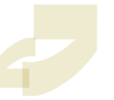
ترجمة: حامد احمد

ذكر تقرير أميركي بأن الأزمة في أوكرانيا تسببت بضرر كبير للطائرات الروسية لدى العراق، وتحدثت عن تراجع كبير في عمليات الصيانة بعد تراجع واضح في الأداء، متوقعا تعطيل البعض منها من أجل ضمان استمرار عمل الأخرى، مشددا على أن ذلك قد يؤثر سلبا على المهام العسكرية ضد تنظيم داعش الإرهابي.