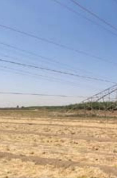
عودة استهداف أبراج نقل الكهرباء بالعبوات الناسفة

قد شغل رئيس مجلس الوزراء مصطفى الكاظمي مبكراً وقد أوصى بتحليق مسيرات وتحريك أفواج طوارئ ونصب كاميرات حرارية قرب الخطوط الناقلة خصوصاً الحاكمة منها وذات الضغط العالي التي بخروجها تتأثر المنظومة