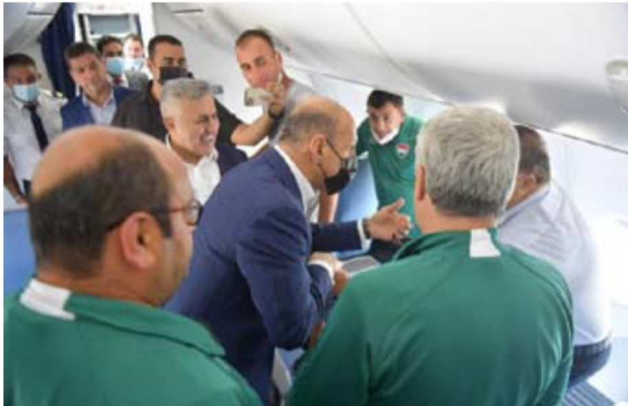
رجال يدعو أدفوكات للضيافة في صالة المطار