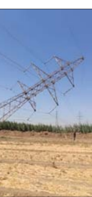
عودة استهداف أبراج نقل الكهرباء بالعبوات الناسفة

قد شغل رئيس مجلس الوزراء مصطفى الكاظمي مبكراً وقد أوصى بتحليق مسيرات وتحريك أفواج طوارئ ونصب كاميرات حرارية قرب الخطوط الناقلة خصوصاً الحاكمة منها وذات الضغط العالي التي بخروجها تتأثر المنظومة