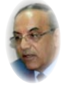
هادي عزيز علي

قدم وزير العدل الفلسطيني كتابه المؤرخ 2 \ 12 \ 1918 الى المحكمة الدستورية العليا يتضمن طلب تفسير المادتين (47 و 47 مكرر) والمادة (55) من القانون الاساسي وتعديلاته، لكون المجلس التشريعي الحالي المنتخب بتاريخ 25 \ 1 \ 2006، والمفتحة دورته العادية السنوية بتاريخ 18 \ 2 \ 2006 انتهت دورته الاولى بعد التعديل بتاريخ 5 \ 7 \ 2007 وبذلك يعد ممتنعاً عن القيام بالوظائف المكلف بها واستمر المجلس المذكور من دون حل رغم انتهاء ولايته البالغة اربع سنوات المنتهية بتاريخ 25 \ 1 \ 2010 لذا فان الاستفسار ينصب على : فيما اذا كان المجلس التشريعي منظم في عمله في وضعه الحالي ام انه معطل وفيما اذا كان اعضاء المجلس التشريعي يستحقون رواتب ام لا؟ وقد اشار الكتاب الى ان المجلس التشريعي في حالة التعطيل والغياب وعدم الانعقاد واستمرار هذا الوضع لمدة ليست بالقليلة ومن دون اجراء الانتخابات العامة وان استمرار هذا الوضع يؤدي الى انتهاك احكام القانون الاساسي وقانون الانتخابات العامة والقوانين ذات العلاقة، والساس بالمصلحة العامة ومصصلحة الوطن والمصلحة الوطنية العليا للشعب الفلسطيني واهداف العديد من الحقوق الاساسية والدستورية والقانونية للمواطن وفي مقدمتها حقهم في المشاركة في الحياة السياسية الى اخر ما جاء بالكتاب المذكور. قيد الطلب المذكور لدى المحكمة بالرقم 10 \ تفسير قضائية 3 \ 2018.