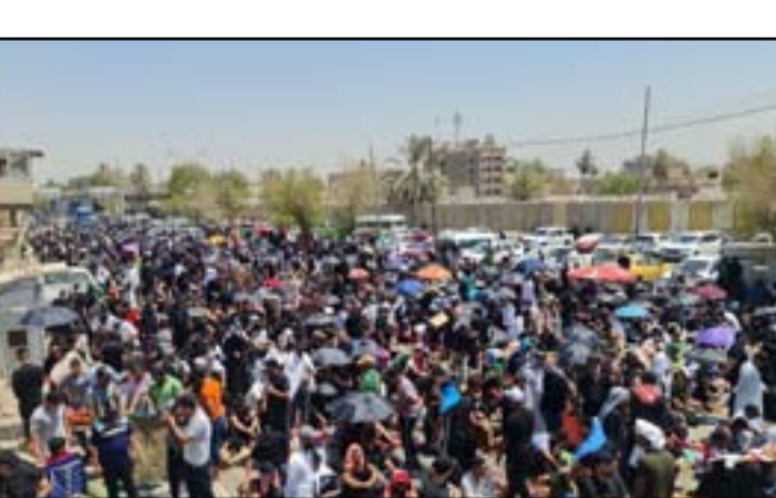
جمع عتلى لصدري بحبوسا لجمعة فخل للمنطقة الخضراء

ومضى الساعدي، إلى أن «التيار الصدري ينتظر يوم الثلاثاء من الشهر الحالي وهو الموعد للنظر في دعوى حل البرلمان بأمل أن تصدر المحكمة الاتحادية العليا قرارها وتكون إلى جانب الشارع».