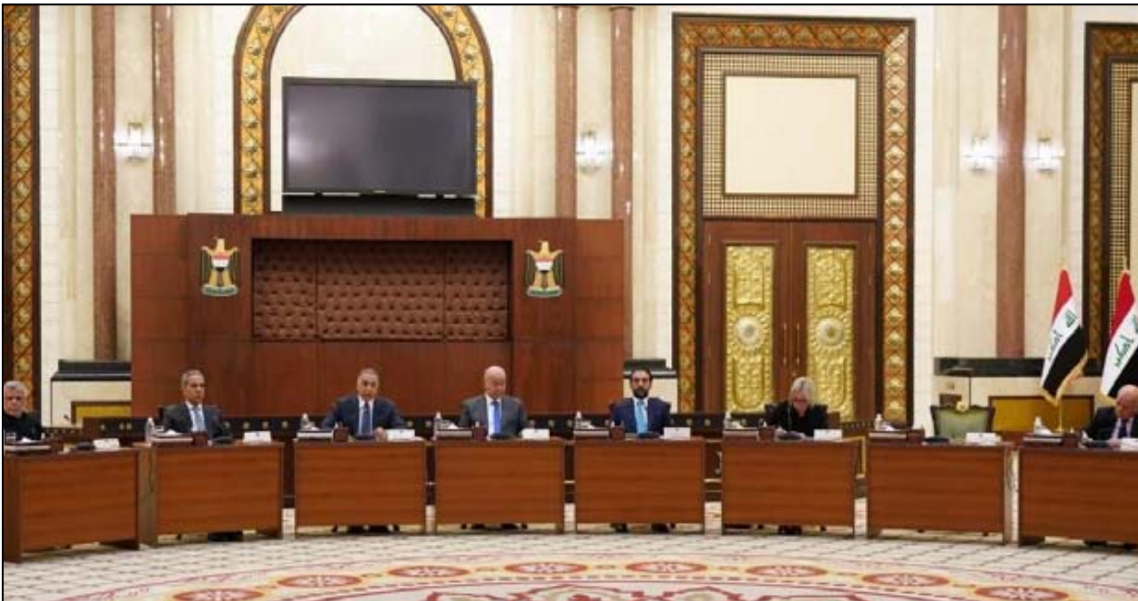
شكولنبلهكاتبين تخرج الاجتمعة لتبنتلج نهى الأئمة السيسلسية

لكن البيان الختامي للاجتماع الأخير الذي اعتبر «محبطاً» بحسب ما نقله المعلومات من مصادر قريبة من الصدريين، «أعاد احتمالية الدعوة للمليونية بدلاً من تلك التي تأجلت».