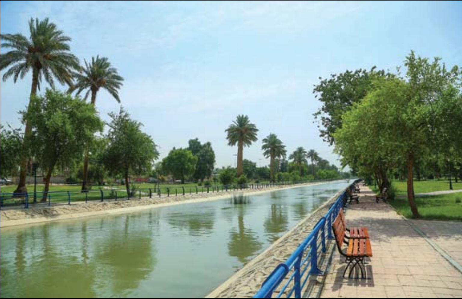
قناة الجيش في بغداد.. بعد إعادة الحياة إليها...