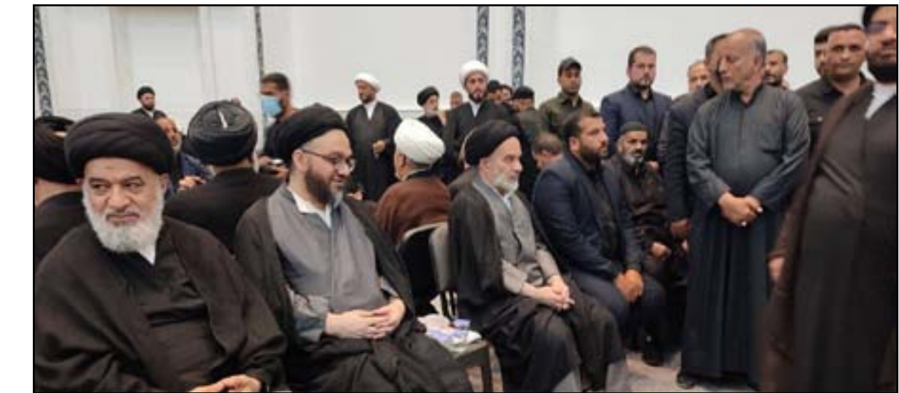
حضور نجلي المرجع الديني السيد علي السيستاني المجلس التائيبي في ذكرى رحيل السيد محمد سعيد الحكيم بالنجف

مقاتلي سرايا السلام وقادتهم قد تم نشرهم داخل المنطقة الخضراء وذلك اعتباراً من اليوم الأول للاعتصام في 30 تموز ونذك من أجل توفير الدعم اللوجستي، ولكنهم نفوا جلب أية أسلحة للمنطقة".