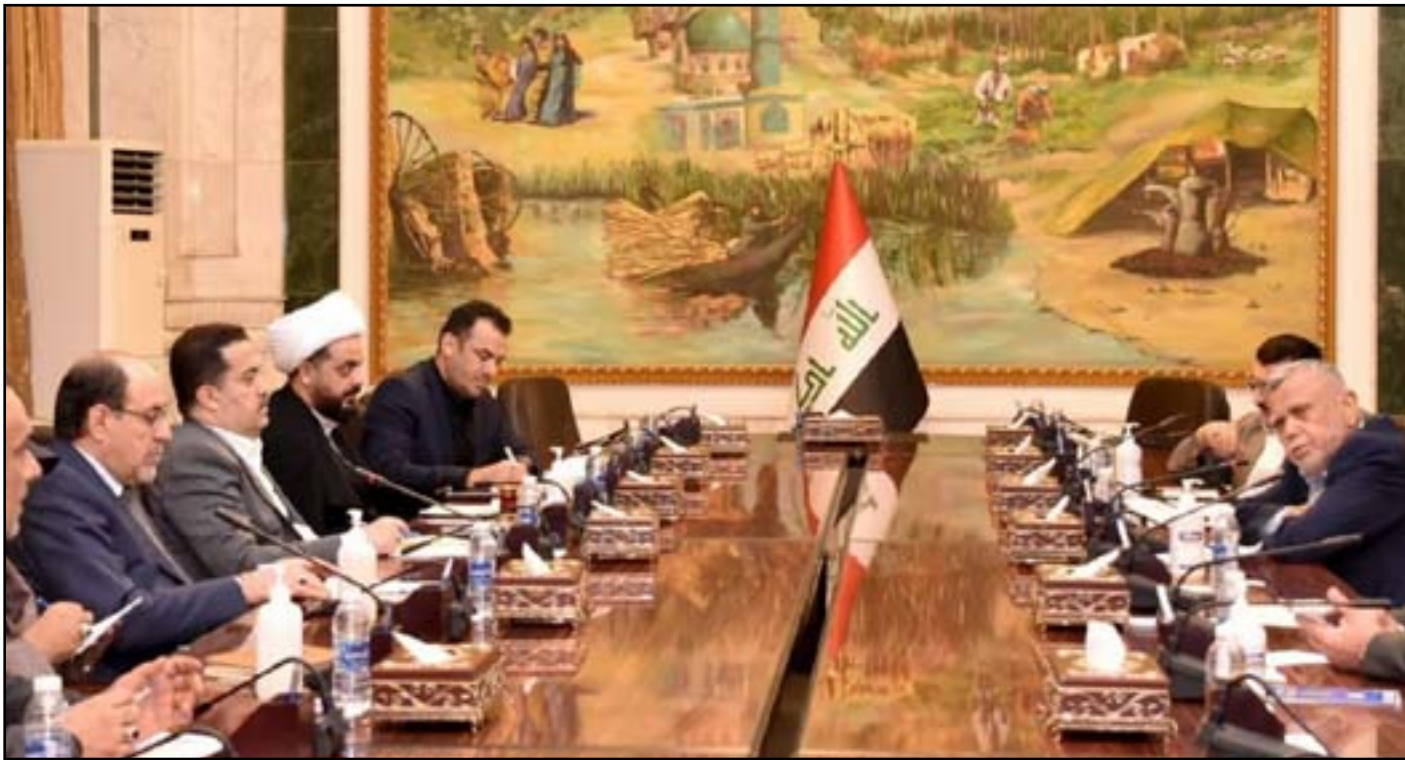
الاطار التسيقي لم ينجح لغاية الوقت الحالي باقناع الصدر في الجلوس على طاولة الحوار