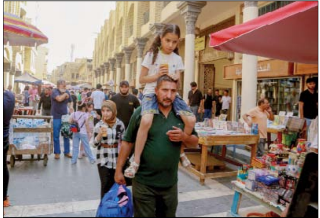
استعدادات لبدء العام الدراسي الجديد...