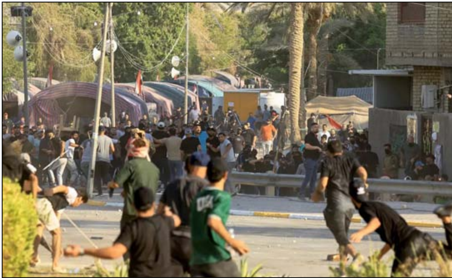
مخاوف من عودة سيناريو اشتباكات المنطقة الخضراء

وذكرت خلية الاعلام الأمني، في بيان، أن «بعض مواقع التواصل الاجتماعي تداولت أنباء متضاربة عن وقوع أحداث أمنية واضطرابات في محافظة البصرة». ونود أن نبين أن الموضوع هو عبارة عن وجود حداث جريمة قتل في مركز المحافظة وإصابة آخر.