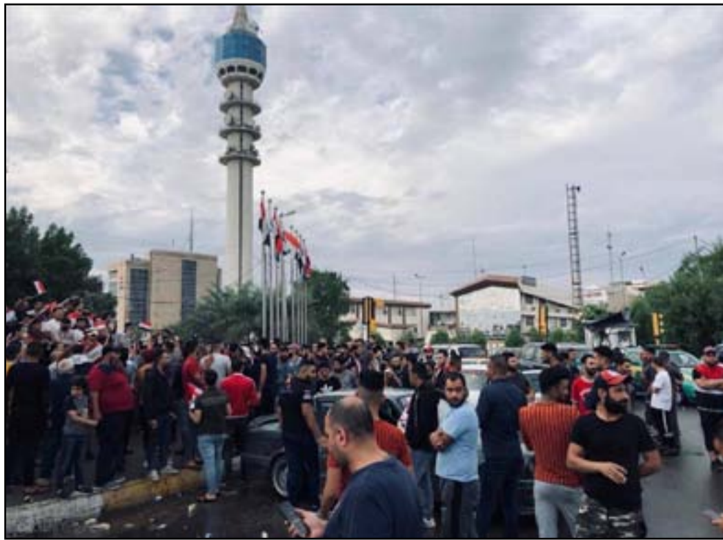
تظاهرات ساحة السور يوم الجمعة

وكانت عماد، في يوم الثلاثاء طلب منهم الصدر خلال مؤتمر صحفي ان ينسحبوا، اطاعوا اوامره وياشروا بمغادرة المنطقة وهم يعلتون سياراتهم العسكرية ويلوحون بأسلحتهم في