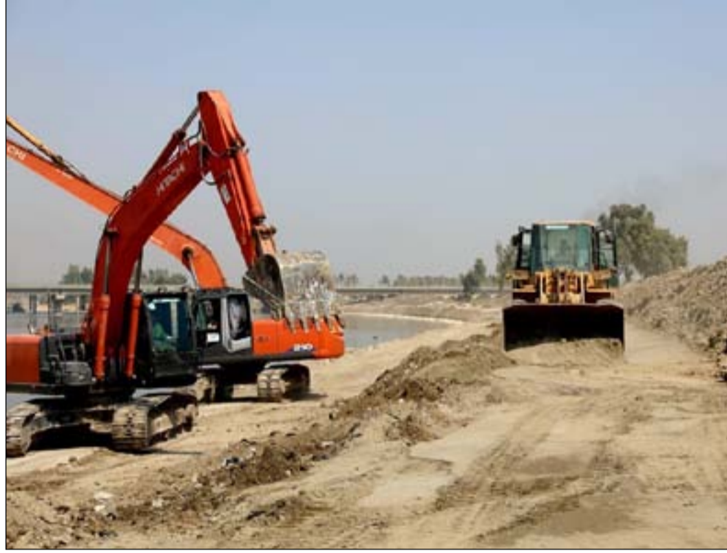
استمرار الأعمال في سدة الهندية ببابل

وأشار، إلى أن "التقارير الفنية التي اطلعت عليها الخلية أظهرت أن موقع نصب المضخات العائمة في بحيرة الثرثار تجاوزت نسبة الإنجاز فيه ٥٥٪،