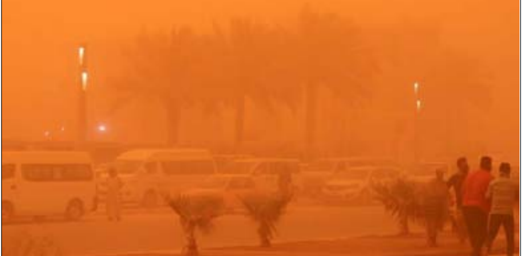
الناطق الجنوبية الأكثر تضرراً بالعواصف الترابية