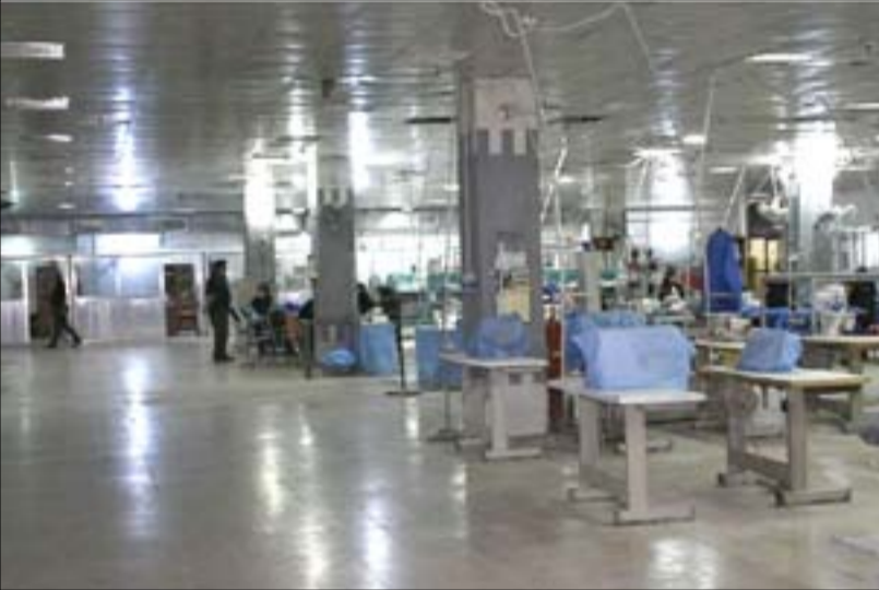
معمل نسيج الحلة يكافح من أجل البقاء

"تعمل الحكومة على الحفاظ على المنتج المحلي من خلال تفعيل نظام الضرائب على البضائع المستوردة ومراقبة المنافذ الحدودية لتنظيم حركة الاستيراد بالنسبة للبضائع".