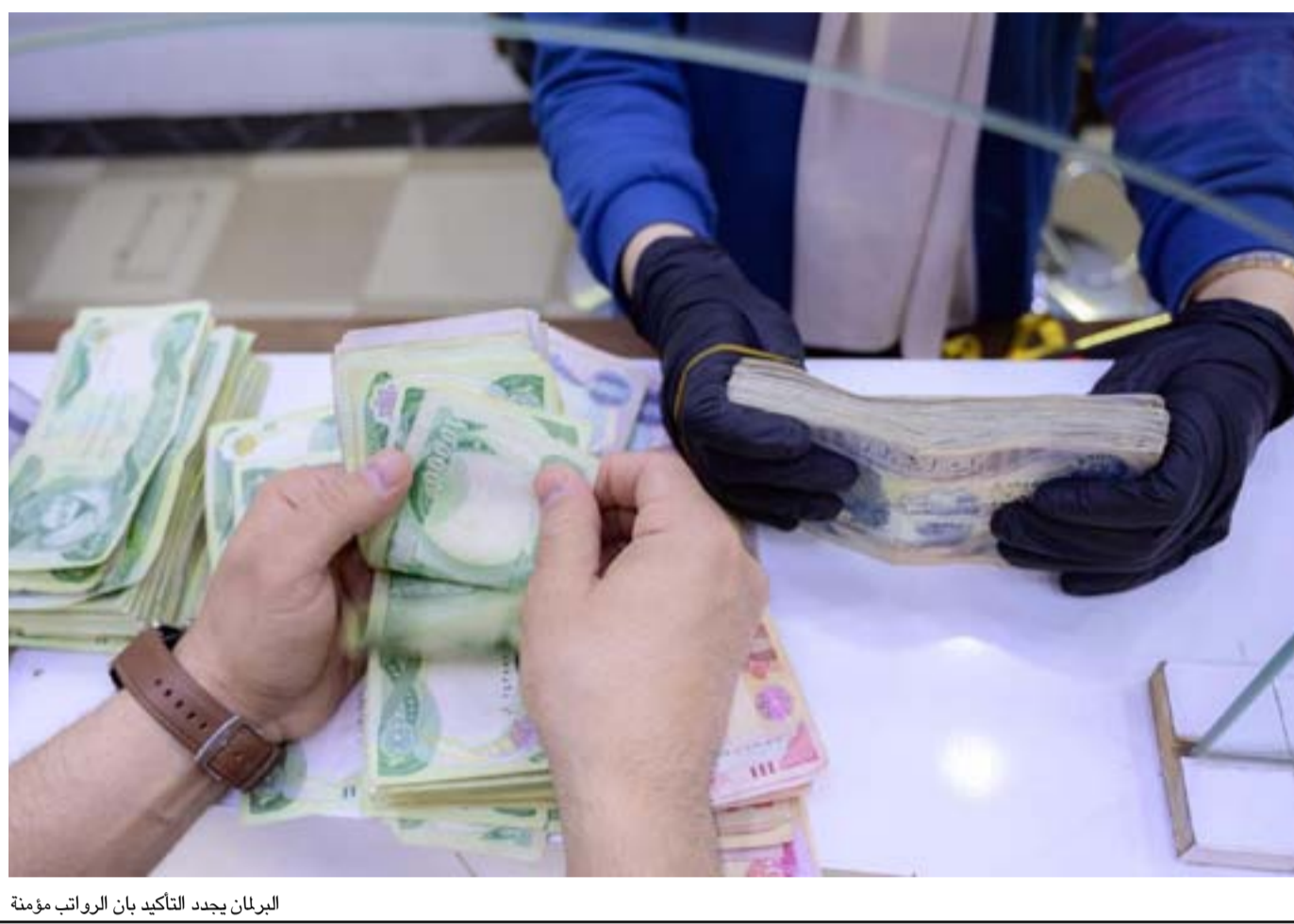
البرلمان يجدد التأكيد بان الرواتب مؤمنة

وأصبح بحكم المستحيل إقرار قانون الموازنة الاتحادية للعام الحالي، في حين تسعى الحكومة إلى وضع الملاحق الرئيسية لموازنة العام المقبل مع مخاوف كبيرة من عدم إقرارها أيضاً في ظل استمرار الأزمة السياسية.