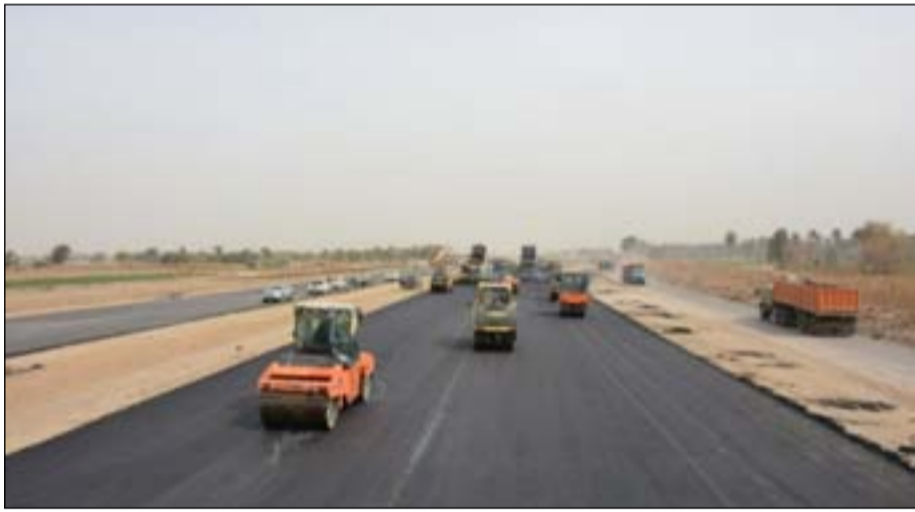
من أعمال إنجاز طريق اليوسفية السريع

وأضاف جاسم، أن المشروع ذو أهمية كبيرة، وبالرغم من قلة التخصيصات المالية بسبب عدم اقرار الموازنة، لكن الدائرة استخدمت أقصى الصلاحيات بدعم من رئيس مجلس الوزراء، والأمين العام لمجلس الوزراء، ووزيرة الإعمار، من أجل إنجاز المشروع والحد من معوقاته".