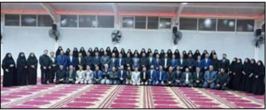
نواب الكتلة الصديرية اثناء تقديم الاستقالات

صباح الساعدي كان قد أفصح عن مضمون دعوى حل البرلمان، مؤكداً إمكانية صدور قرار قضائي بالحل دون الحاجة إلى عقد جلسة وإجراء تعديل على القانون الانتخابي. وقال الساعدي، في حوار تلفزيوني سابق تابعته (المدى)، إن التيار الصديري لو كان قد جلس على طاولة حوار مع الكتل واتفق على حل البرلمان لكان الرأي العام قد قال إن هذا ليس تصحيحاً للعملية السياسية إنما توزيع للحصص والمغانم». وأضاف الساعدي، أن «المحكمة الاتحادية العليا عندما تصدر قراراً ببطان تشريع معين تطالب إجراء تعديل فيه، يتولى تنفيذه مجلس النواب».