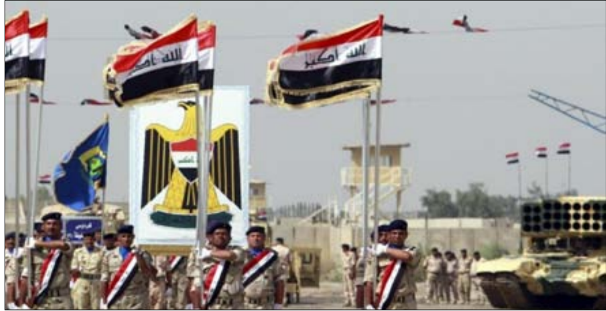
إعادة المسوخة عقودهم ترفع القدرات البشرية للجيش العراقي