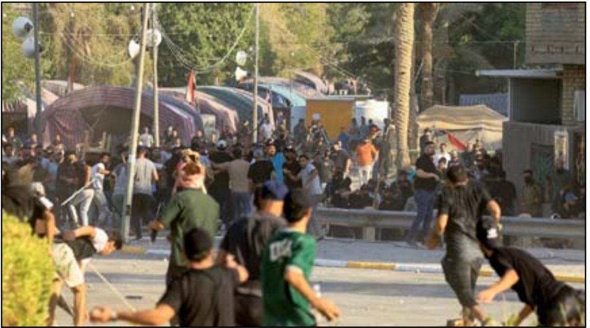
هدنة مشة بين القوى والاحزاب مع مخاوف من عودة المصادمات

أشار سيكيا، الى ان «هذا الانسداد السياسي هو الأطول منذ عام 2003 الذي تتنافس فيه النخب السياسية للظفر بتشكيل حكومة». من جانبه، ذكر محلل في الشؤون العراقية من معهد واشنطن لسياسة الشرق الأدنى عمر الندواوي، أن «الوضع متقلب ويزداد تعقيداً». وتابع الندواوي، أن «احتمالية وقوع اضطرابات واحداث عنف من جديد ما تزال عالية لان الصدر ما يزال غاضباً، ومن الواضح انه بعيد عن كونه قد تخطى عن السياسة». إلى ذلك، رأى مدير المجلس الأطلسي لمبادرة العراق عباس كاظم، ان «الصدر غالباً ما يلجأ الى استشارة عواطف اتباعه». وأضاف كاظم، أن «زعيم التيار الصديري يقول لهم حسناً اننا اتنازل ولكن الامر يعود لكم بمواصلة المسيرة او ان تتخلون عنها». مشدداً على أن «اتباعه لهم ارادة بفعل أي شيء من اجل إبقاء زعيمهم في المقدمة