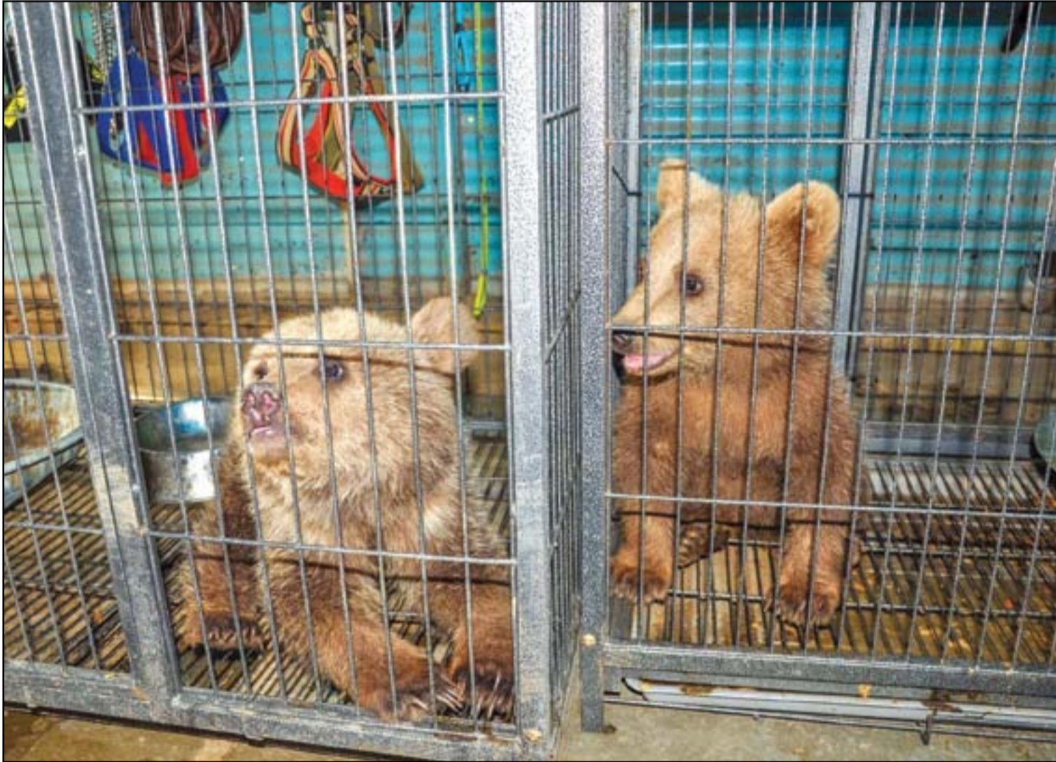
تشديد امني على تربية الحيوانات المفترسة .. عدسة: محمود رؤوف