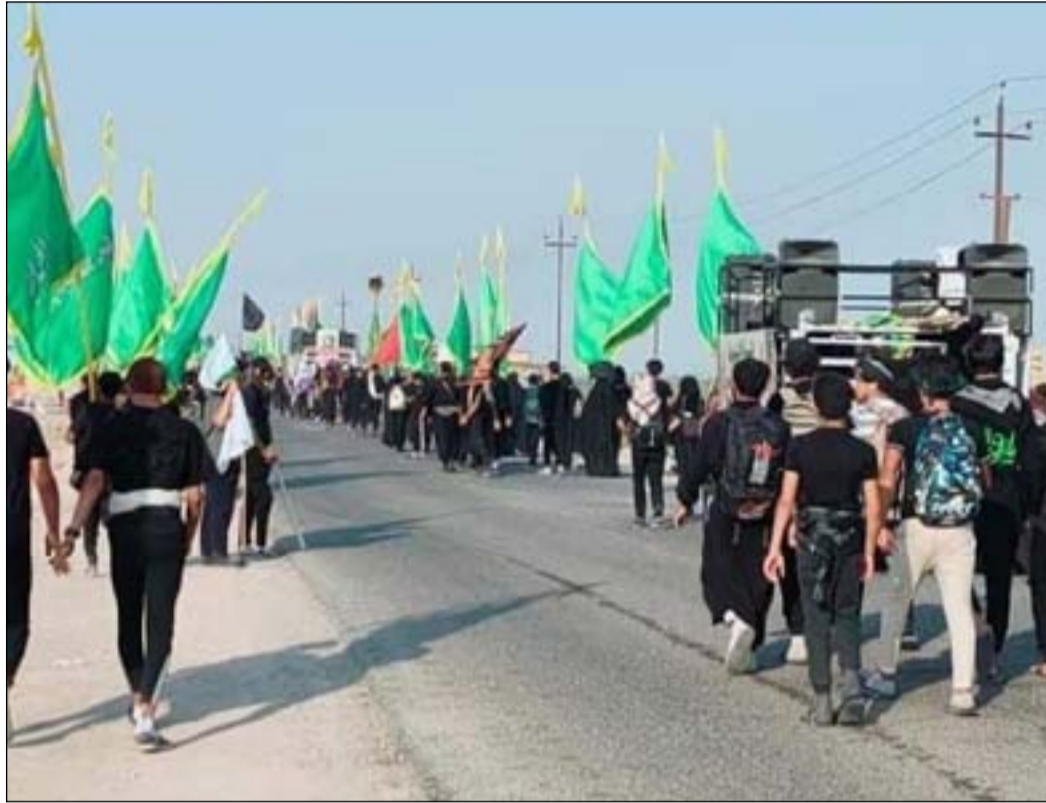
طريق الزائرين في محافظة ذي قار

ولفت، إلى أن المعطيات الأولية تشير الى ان الخطة تسير وفق ما مرسوم لها، معرباً عن أمله بأن