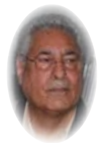
■ عصام الياسري

مضي ما يقرب عشرة أشهر على الانتخابات العامة التي جرت في العام المنصرم، والأوضاع في العراق الدولية الغنية بالنقط لا تزال تتجه نحو المجهول. اقتحام الصديريين للبرلمان وتعطيل جميع الجلسات، أشعل بين الطبقة السياسية شرارة صراع على السلطة. وكان هدف المتظاهرين في "الخضراء" الضغط على السياسيين وبالأساس الإطار التنسيقي الذي عرقل تشكيل حكومة أغلبية وطنية. الكتلة الصدية في ذلك الوقت كانت المنتصر، لكنها، فشلت في تأمين النسبة المطلوبة "أغلبية الثلثين" نظرا (لتفسير المحكمة تحت ضغط قوى الإطار التنسيقي) لانتخاب رئيس الجمهورية ومن ثم رئيسا للوزراء. وكان قادة الإطار يشككون في نتائج الانتخابات ولا يريدون الاعتراف بالهزيمة ومجيء حكومة تحارب الفساد وتصلح النظام السياسي برمته. وكان للصدر رغم تخلي مجموعة ما يسمى "بالمستقلين" عن تمهلاتهم، وانهائية حلفاء الصدر، تحت تأثير وإغراءات الاطاريين بعد استقالة الصديريين، أن يصمد بوجه التعدييات وأن لا يدعو نوابه كأكبر كتلة برلمانية للاستقالة لتضييق الخناق على الاطاريين وصد مناوراتهم. إنه من المؤكد أن تشكيل حكومة جديدة متمثلة بقوى "الائتلاف الثلاثي"،