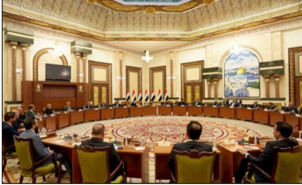
غموض بشأن مواقف الكتل التي ستكون حاضرة في اجتماع الكاظمي اليوم

بالمقابل ان قصة الهدوء الحذر عقب اشتباكات الخضراء الاسبوع الماضي يُخطئ، بحسب تسريبات، لعمليات انتقام ضد اتباع زعيم التيار الصديري مقتدى الصدر. وتهدد حركات ميدانية وتصعيد الكتروني عبر حسابات مجهولة بخرق الهدنة بعد ايام فقط من اتفاق ضمنى بين القوى السياسية على خفض التصعيد. بالمقابل ان قصة رئيس الوزراء مصطفى الكاظمي الثانية، والتي دعا اليها كل الاطراف المتنازعة مهددة هي الاخرى بالتأجيل او الالغاء. يأتي ذلك في وقت اغضب فيه محمد الحلبي رئيس البرلمان فريقي الإطار التنسيقي، بعد ان اشترط اعلان موعد لانتخابات مبكرة قبل اي حوار جديد. بدوره تراجع ما يعرف بـ «وزير القائد» عن التصعيد الذي قاده الأخير عبر حساباته الالكترونية رغم تراجع خصوم التيار. وفي اخر 48 ساعة لم «يغرد» وزير الصدر وهو صالح محمد العراقي، بعد تهديدات وجهها لزعيم عصائب اهل الحق قيس الخزعلي، وطلب ابعاد فالح الفياض عن الحشد. لكن اوساط التيار تتحدث لـ (المدى) عن «معلومات تشير الى احتمال تنفيذ عمليات انتقام من اتباع الصدر بسبب الاوساط الصديرية تعتقد ان «حريقاً وقع فجر يوم أمس في منطقة الشعلة، غربي العاصمة، كان منعدماً وحدث بتدنية هاون». وتنمضي تلك الاوساط قائلة: «المجمع