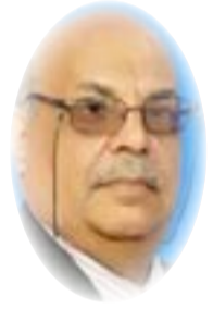
■ د. عباس العلي

كما أن أكثر الدساتير ديمقراطية اليوم تؤمن بحق المجتمع بالدفاع عن نفسه بوجه أي تهديدات حتى لو كانت احتمالية فواجب الدفاع عنها واجب مقدم على الكثير من المستوجبات المهمة الأخرى، بل بعض الديمقراطيات اليوم تبيح المحذور والمحظور في حالة تعارض مصلحة الفرد مع مصلحة الجماعة، وترى أن الأمن الاجتماعي أقدس من إنسانية الإنسان إذا كانت تدفع عن الغالبية ما هو أجدر وأكبر بالأهمية النسبية للفرد، وهذا ليس بدعا من القول ولكنه ممارسة حقيقية وهناك نظرات أكثر إجرامية حينما يعطي مجتمع حق تدمير الأخر مجرد أنه في الظن يشكل تهديدا له، وما يشوع مفهوم الحرب الإستباقية ومفاهيم قوة الردع المسبق إلا تطبيقات وحشية لمفهوم القتل على الفلن دون وقوع الفعل المستوجب له كما صرح الإسلام به (من قتل نفس يغير نفس كأنما قتل الناس جميعا).