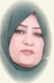
■ عديوية الهلائي

بعد انسحابهم، قال أحد المتظاهرين لمراسل القناة التلفزيونية بمرارة: «لم يفكر أحد من القادة ان يسألنا ماذا نريد؟ لماذا يتوقعون منا الطاعة فقط...؟» كان السؤال خطيراً كما أظن ، فمن كان يعتصم ويهتف في مبنى البرلمان ثم امام اسوار المنطقه الخضراء وبعدها في القصر الجمهوري ليس متظاهرا لينفذ اوامر قادته بسبب الولاء والطاعة فقط ولم يكن هدفه الانتعاش في مسابح القصور الرئاسية أو التلذذ ببرودة مكيفات الهواء أو حتى اقامة الشعائر الحسينية فهو معتاد على حرارة الجو ولديه مايكفي من الاماكن لممارسة طقوسه ولكنه خرج للمتظاهر بحماس لأنه متلهف ليجاد حل سريع لازمة تشكيل الحكومة التي طالبت وتعددت بشدة وتعددت معها حياته البسيطة فهو لايلعلم بمنصب او مكسب بل ينتظر خروجا من النفق المظلم الذي قاده اليه المتشبثون بالسلطة والمتكالبون عليها ، وعندما يسقط بناؤه ورفاقه وتفضض ارواحهم الغالية تحت رصاص لايعرف أحد مصدره او لا يصرح أحد بمصدره الحقيقي فهو يعتبرهم قربانا للوطن وليس فداء للعادة ، فمن ذاق طعم الحروب والنزاعات التي خاضها الشعب من أجل القيادة ولم يحصل الا على الخسائر والخياب سيخشي حتما من تكرار التجربة لأن الشعب هو الخاسر الوحيد في كل النزاعات بينما ينعم القادة بالمديح والالاقب وتخليد التاريخ ..