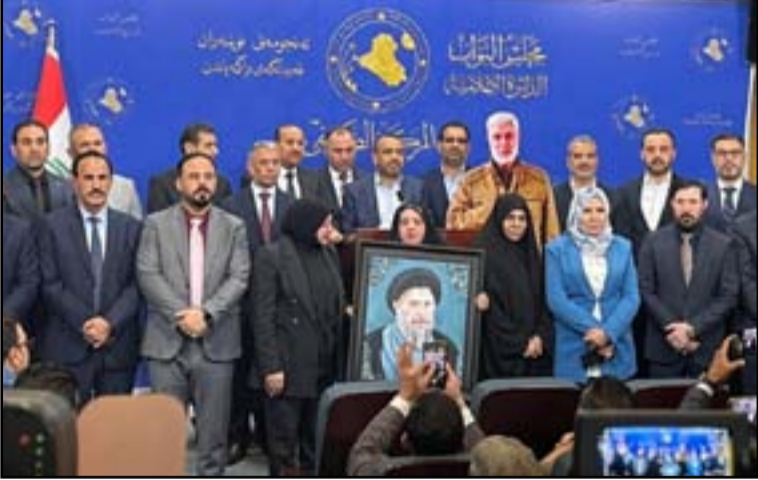
كتلة الاطار التنسيقي تتفاخر بزيادة عدد نوابها بعد استقالة الصديقين

يتفق مع مصلحة البلد».. ولفت، إلى أن «هدفتنا هو الارتقاء بالأداء السياسي ولا سيما على الصعيد التنفيذي، وطوي صفحة السجلات والمناكفات السياسية التي تقاوم معاناة المواطنين».