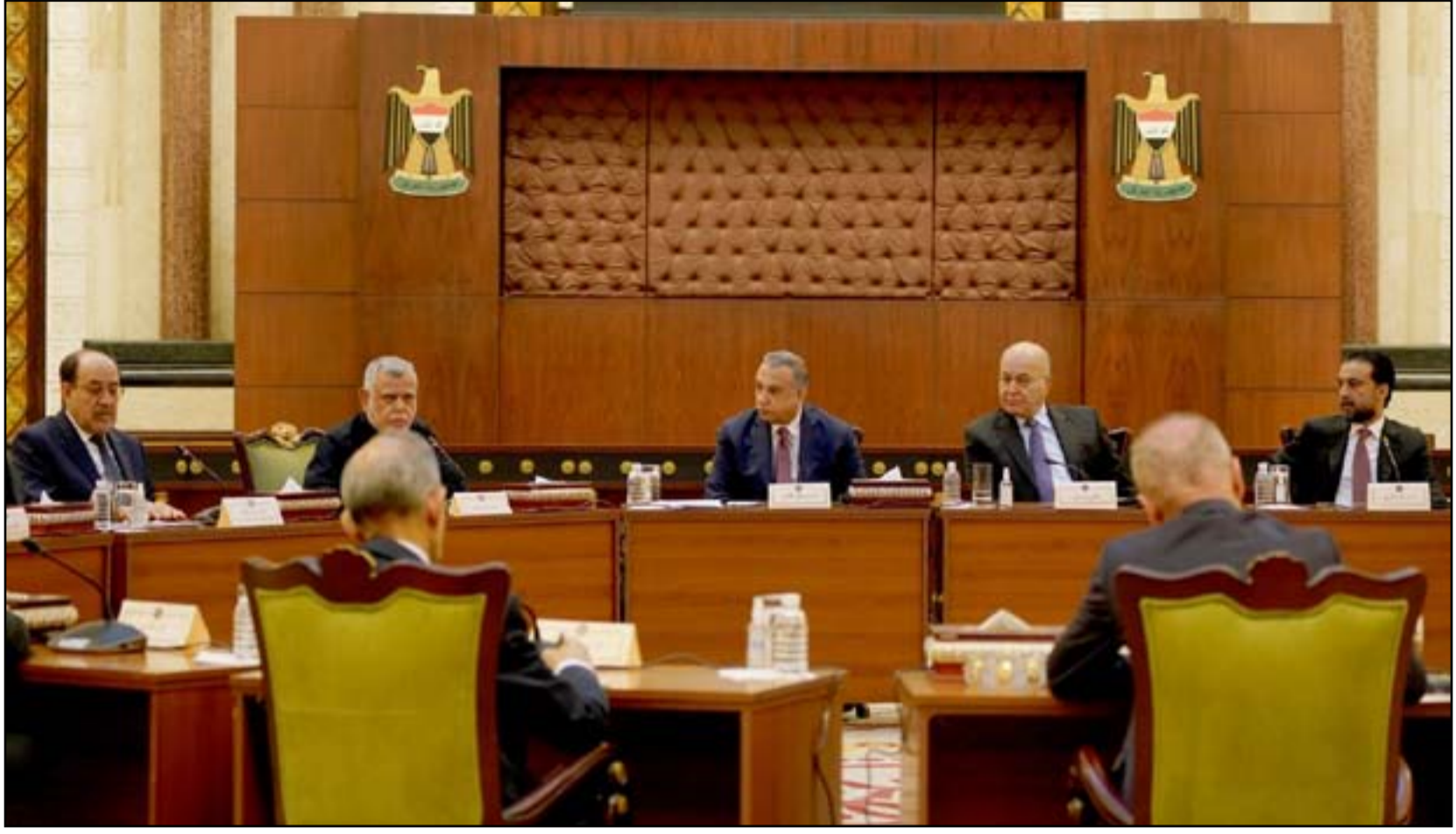
اجتماع الرئاسات مع قادة القوى السياسية في القصر الحكومي امس

وظهرت امس، مخاوف من عودة موجة الاغتيالات في جنوبي البلاد، بعد موجتين