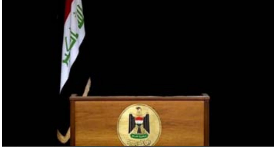
احتدام الصراع السياسي على منصب رئيس الوزراء

وأشار، إلى أن «النظام البرلماني يقوم على مبدأ الفصل بين السلطات وفق الدستور العراقي،