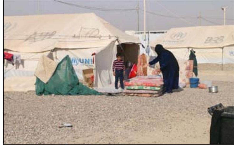
تقارير تتحدث عن تراجع الدعم الدولي للف للنازحين في العراق

ولفت، إلى أن "الدافع الرئيسي للعودة بالنسبة لكثير من تلك العوائل كان هو جديتهم بحياتهم السابقة في مناطقهم" .