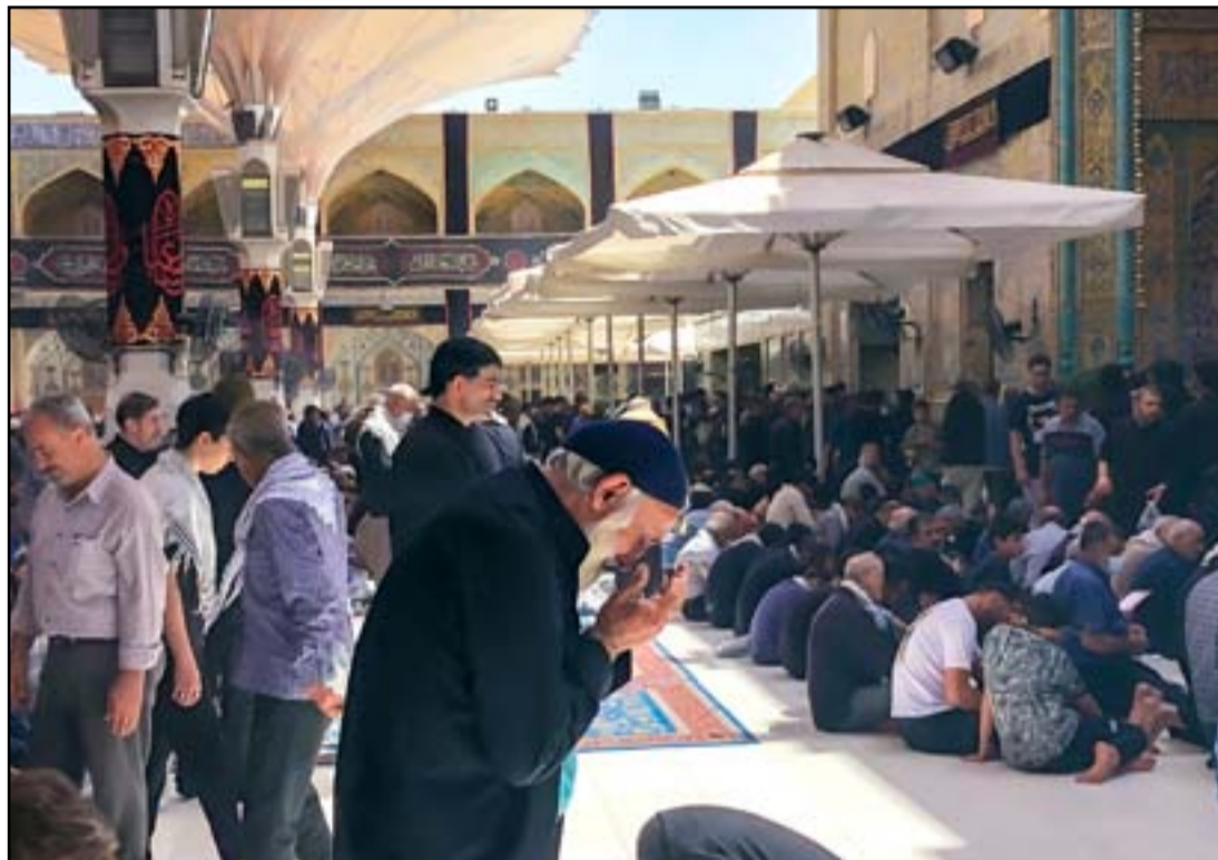
الصحف العلوي الشريف يكتظ بالنازحين أمس...

أفصحت مؤسسة دولية عن أبرز معرقات عودة العائلات النازحة إلى محافظة ديالى، مشيرة إلى مشكلات عديدة أهمها تضرر المنازل ونقص الخدمات وفرص العمل فضلاً عن الجوانب الأمنية. وذكر تقرير جديد لمؤسسة، (ريتش)، الدولية حول حركة وتنقل النازحين في العراق ترجمته (المدى)، ذكر أن «هناك عوائق وتحديات عدة تواجه عائدين لمناطق سكنهم الاصلية في ديالى».