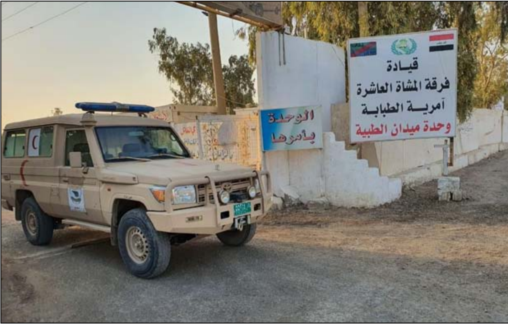
وحدة عسكرية تقدم الاسناد الطبي إلى الزائرين