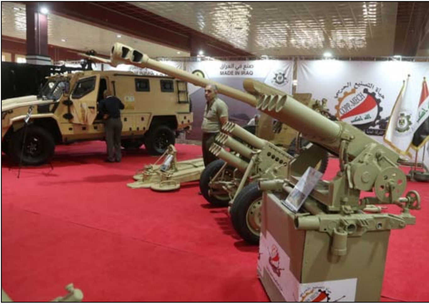
أسلحة في معرض مكافحة الإرهاب والقوات الخاصة والأمن السيراتي في بغداد...