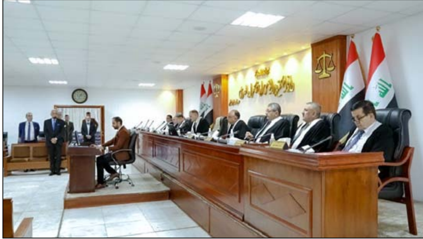
المحكمة الاتحادية تستعد اليوم لقول الفصل في واحدة من أهم طعون العملية السياسية

وكان المقرر الثاني من المضمينين 6 التي خلص اليها اجتماع القمة قد أكد على تشكيل فريق فني من مختلف القوى السياسية؛ لتتضح الرؤى والأفكار المشتركة حول خارطة الطريق للحل الوطني، وتقريب وجهات النظر؛ بغية الوصول إلى انتخابات مبكرة، وتحقيق متطلباتها بمراجعة قانون الانتخابات، وإعادة النظر في المفوضية، وفي كل الأحوال يؤكد القيادي في حزب قريب من «الإطار» والذي طلب عدم نشر اسمه ان «القوى السياسية ستعضي الى عقد جلسات البرلمان بعد زيارة الاربعينية سواء قبل او رفض التيار الصدري».