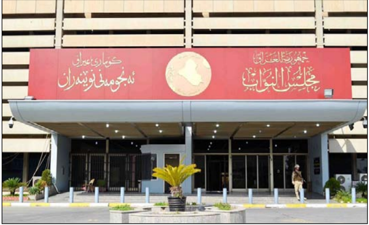
مبنى البرلمان ينتظر استئناف جلساته الأسبوع المقبل بحسب الإطار التنسيقي

بالمقابل فان مواقع اخبارية قريبة من التيار الصدري، اشارت بوضوح الى ان "الإطار"، يقصد الناشطين من وراء خبر