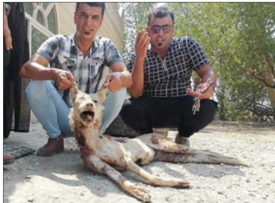
واحد من الذئاب بعد قتله من قبل سكان المنطقة