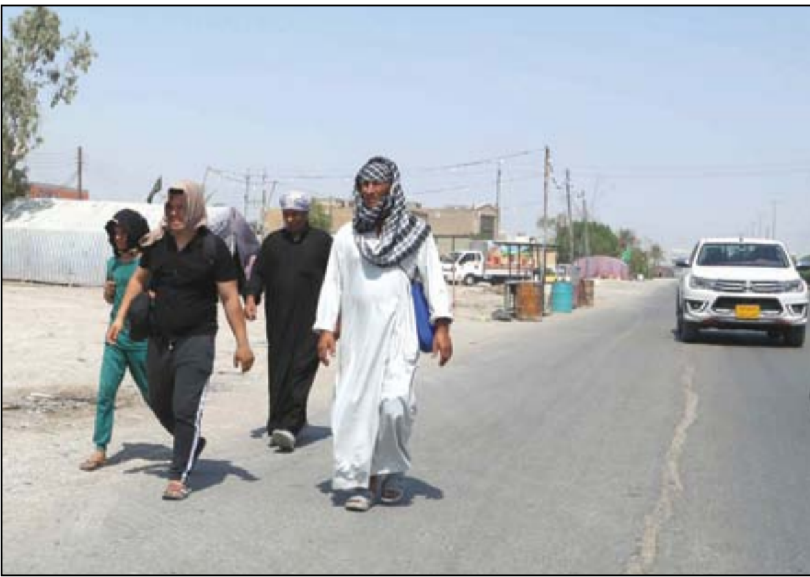
زوار من أهالي ديايي يتجهون إلى كربلاء عبر بغداد..

عاد قطع من الذئاب البرية المفترسة الهجوم على قرية آل بو جمعة في قضاء سيد دجيل (20 كم شرق الناصرية) وواقع 13 اصابة بين السكان المحليين. ويعد هذا الهجوم الثاني من نوعه خلال ثلاثة أيام، فيما قامت ادارة مستشفى الناصرية (التركي) باحتجاز 4 صحفيين لأكثر من ساعة عند اجراء لقاءات اعلامية مع الضحايا. ويأتي هجوم الذئاب ليستكمل ثالث المغانة التي يواجهها سكان القضاء اذ يعاني السكان على مدى عدة عقود من لدغة افعى سيد دجيل المميته وشحة