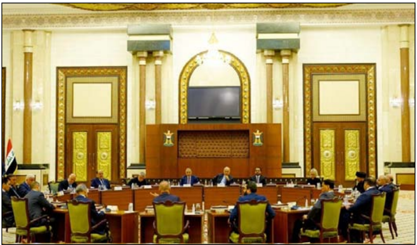
الأزمة السياسية أجبرت قادة الكتل على القبول بخيار الانتخابات المبكرة

تحدثوا عن اختلافات بشأن بعض الشروط يمكن تسويتها عبر الحوار