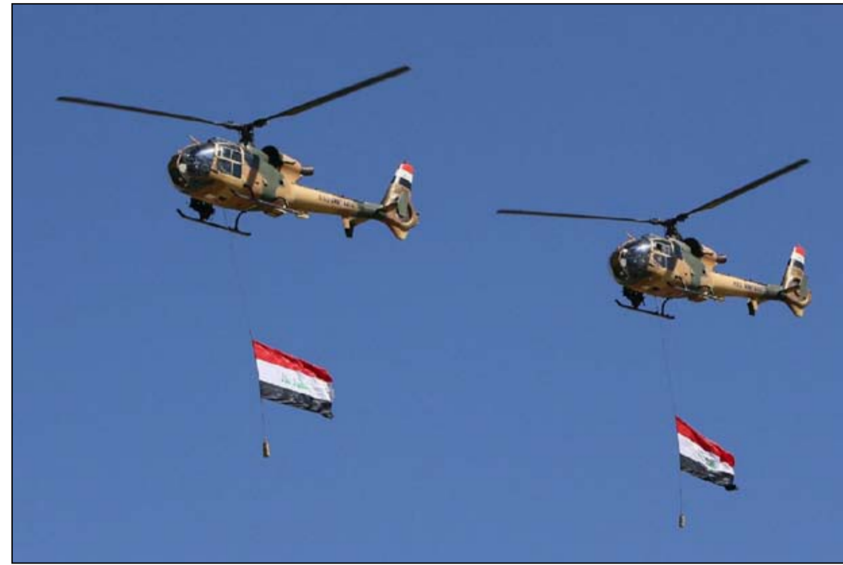
طائرات مروحية تابعة للجيش العراقي

وتحدث، عن "إمكانية العثور على مصادر أخرى، ولكن هذا الامر يستغرق وقتاً ويطغى من عملية الصيانة وإعادة التأهيل، وبدون عملية التجديد هذه فان استمرارية استخدام الطائرات تعرضها لمخاطر الطللات ووقوع حوادث". وبين التقرير، أن "قسماً من اسطول طائرات النقل الهليكوبتر سيتم ركنها