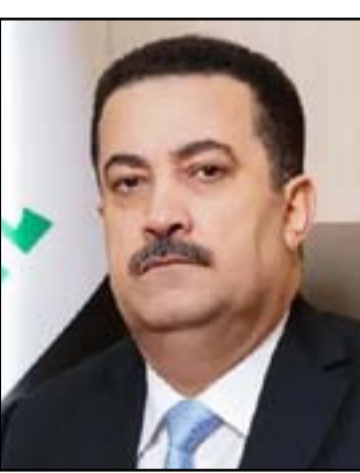
محمد شياع السوداني

بارزانى ورئيس مجلس النواب محمد الحلبوسى، وستعمل على إيصال رسائل مطمئنان إلى الصدر. وأشار، إلى أن «الصدر لم يعترض على اللجنة ولم يبد موقفًا سلبيًا تجاهها، وهذا مؤشر جيد على إمكانية استقبالها في المستقبل القريب بهدف التوصل إلى حلول بشأن الإشكالات العالقة». وأوضح الفتلاوي، أن «الوفد سيناقش مع الصدر ملفات عدة أبرزها تشكيل الحكومة والانتخابات المبكرة والاتفاق على موعد محدد مع ضمانات إجرائها، فضلاً عن موضوعات أخرى تشمل نقاط الخلاف بين الإطار والتنسيقي والتيار الصدري». وأشار، إلى أن «جميع القوى السياسية مع فكرة إجراء الانتخابات»، مؤكداً وجود رغبة جادة لحل الأزمة مقابل استعداد الإطار والقوى الأخرى بتقديم التنازلات للوصول إلى استمرار العملية السياسية مع عدم إيقاف عجلة الدولة». وكان أعضاء في الإطار التنسيقي قد أعلنوا في وقت سابق الاستعداد لاستبدال السوداني بمرشح آخر عن طريق الحوار الذي يرفضه الصدر في الوقت الحالي، محذرين من استمرار تعطيل مجلس النواب، مؤكداً عزمهم استئناف الجلسات بعد الانتهاء من الزيارة الأربعةينية. ويرفض السوداني ترشيح السوداني، مؤكداً أن هذا اختياره ووقع بحكم قرينه من زعيم ائتلاف دولة القانون نوري المالكي.