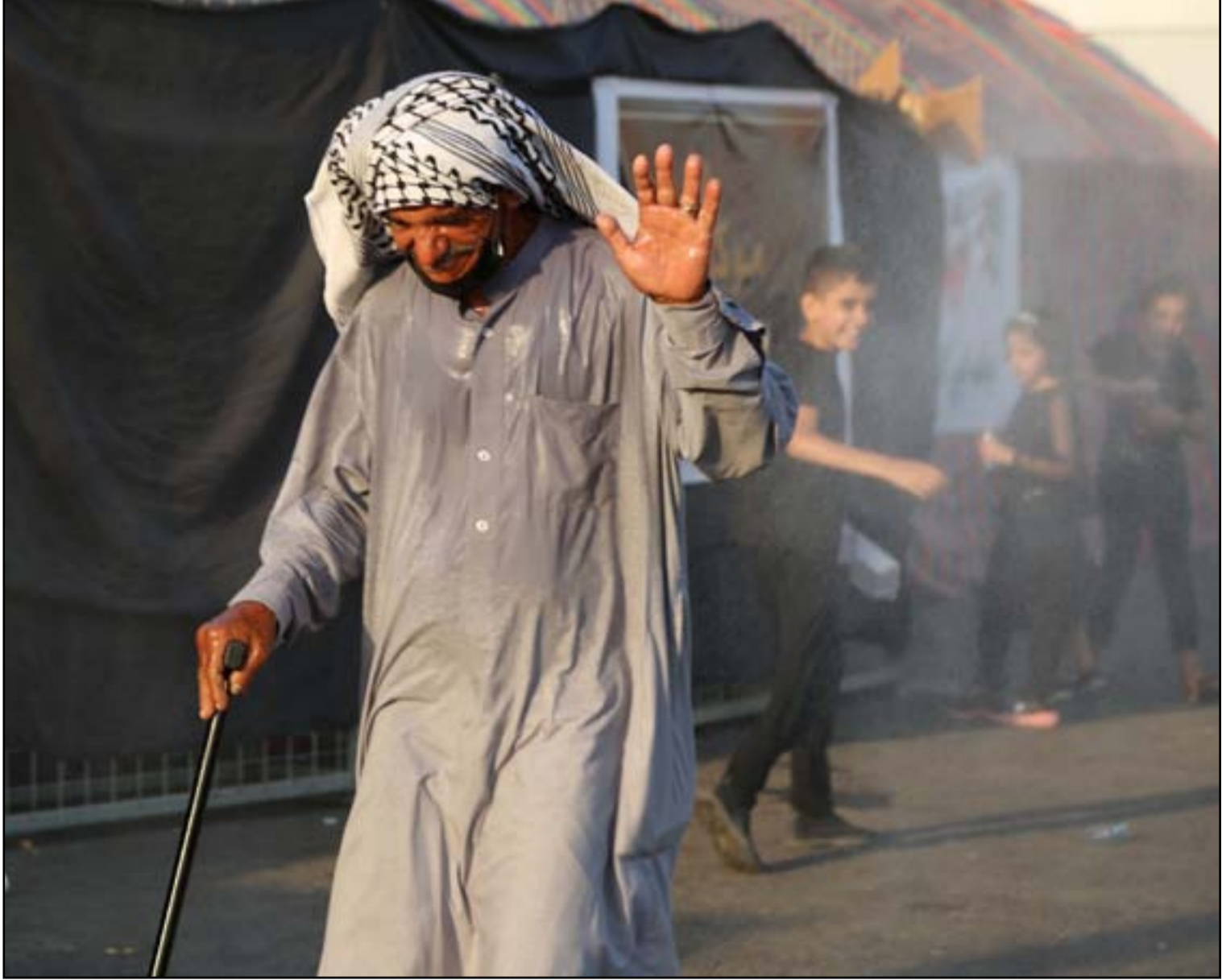
انتشار لمواكب تقدم مختلف الخدمات للزوار على الطرق المؤدية إلى كربلاء... عسدة: محمود رؤوف