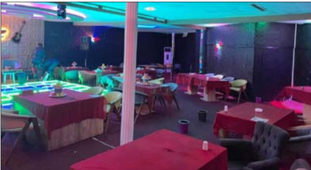
أحد النوادي الليلية غير المجازة بعد مدامته من القوات الأمنية

وبين، أن "أغلب قصص استغلال القاصرات والإيقاع بالضحية تبدأ عن طريق (شركة وهمية) يتم الترويج لها