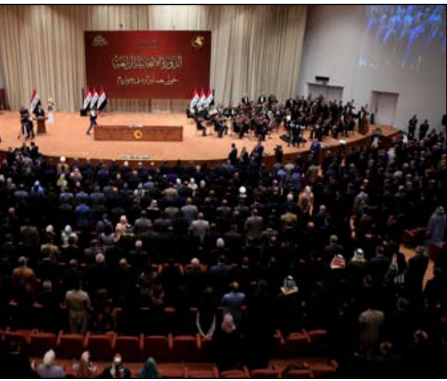
جلسات جديدة للبرلمان العراقي بعد الزيارة الأربعةينية

وتابع المانع، أن «ما حصل هي إرادة زعيم التيار الصدري مقتدى الصدر، ولا يستطيع أحد أن يملأ عليه أو يتنيه عن قراره». وأشار، إلى أن «التحالف الثلاثي الذي يجمع التيار الصدري وكتلة السيادة والحزب الديمقراطي الكردستاني قد تفكك بنحو واضح لسببين رئيسيين». وأوضح المانع، أن «السبب الأول اعتراف أحد أقطابه، هو الصدر، الذي لم تتم تلبية نداءاته من قبل شريكه بالانسحاب من البرلمان، وهو السبب الثاني». وأورد، أن «الطرفين الباقيين من التحالف الثلاثي ذهبوا خلف ما كان يريده شريكهما، بأنهما مع ضرورة تشكيل حكومة متكاملة الصلاحيات ومن بعدها الذهاب إلى الانتخابات المبكرة». ودعا المانع، «الحزب الديمقراطي الكردستاني وكتلة السيادة إلى إعلان تحالف ثنائي أمام الكافة»، مستدركا أن