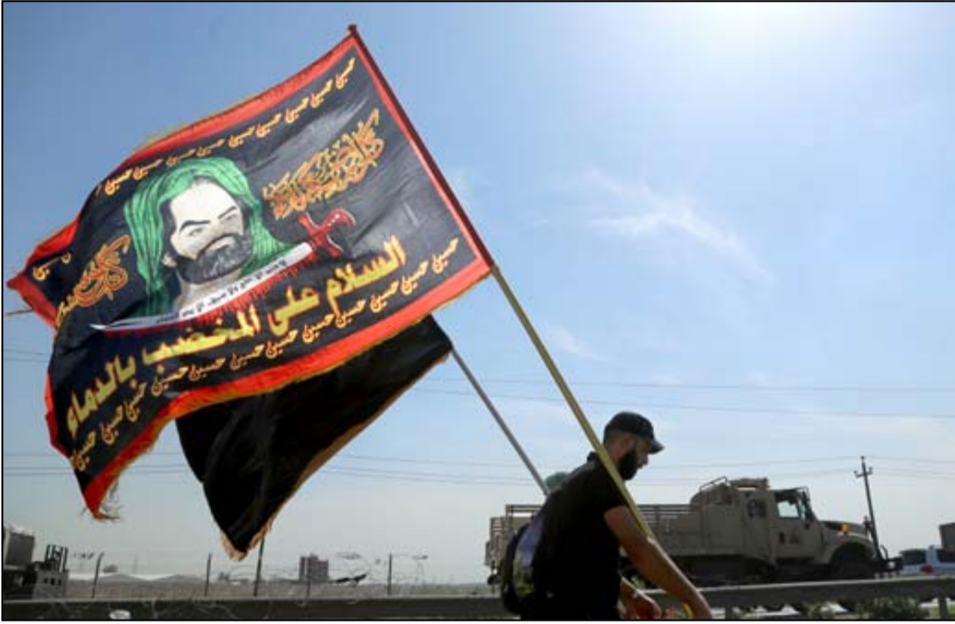
في الطريق إلى كربلاء ...