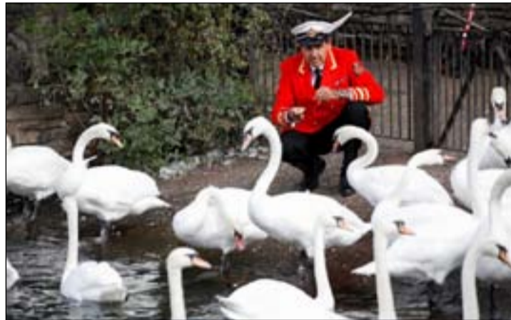
ورث الملك تشارلز، العاهل البريطاني الجديد، تركة غريبة، بعد وفاة والدته الملكة إليزابيث ملكة بريطانيا، إذ أصبح هو الورث للجمع الذي يسبح في نهر التايمز

ويسعد الزوار على ضفتيه في كل أنحاء بريطانيا. ومن جهته قال ديفيد باربر، الذي عمل لدى الملكة إليزابيث لنحو 30 عاماً كمسؤول عن تسجيل طيور البجع، "الملك تشارلز الحق في امتلاك أية بجة غير مسجلة تسبح في المياه المفتوحة إذا أراد ذلك"، وفقاً لموقع العين الإماراتي. وأضاف باربر، الذي أصبح مسجلاً لطيور البجع للملك تشارلز "لا ترجع ملكية طيور البجع كلها إلى الملك، لكن إذا رغب في ذلك فبوسعه، بموجب الامتياز الملكي". ورفض باربر تقدير عدد طيور البجع التي يمتلكها الملك، ويعود امتلاك البجع إلى حقبة العصور الوسطى عندما كانت تلك الطيور من الأطعمة الشهية، وقال باربر "كان البجع آنذاك مصدراً غذائياً مهما للغاية، ويقدم في الولائم والمناسبات للأثرياء".