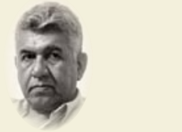
■ طالب عبد العزيز

تتضح كلمة الإمام علي بن ابي طالب: "كُنْ في الفتنة كابن اللبون، لا تظهرأ فيركب ولا ضرعاً فيحلب" في الايام هذه، بأهم وأجلى معانيها، بعد أن التبس الامر، وضاعت المقاييس، وصار بمقدور كل واحد منا اتخاذ موقف معين، والدفاع عنه حد الموت، بعد أن أمست الناس فرقا، تشايح من تشايح، وتخاصم من تخصصم، وكل يقول بالولاء، وكل طامع، وكل قاتل. وقائع كهذه لن يجنو منا إلا العاقل، وأي عاقل؟ ذلك هو الذي لا يدين بين أحد، ولا يتمذهب بمذهب أحد، ولا يخون أحد، ولا يصطف مع أحد، ولا يقاتل مع أحد، ولا يقول كلمة في أحد، ويحق أحد، إذ كل كلمة موقف، وكل موقف انحياز، ولكل انحياز ثمن أقله حرٌّ في الرقاب، فالقوم يتربص بعضهم ببعض، لذا عليك ألا تكون.