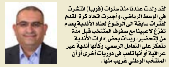
تقد ولدت عندنا منذ سنوات (قوبيا) انتشرت في الوسط الرياضي، وأجبرت اتحاد كرة القدم لفترات سابقة إلى الرضوخ لعناد الأندية بعدم تفرغ لاعبيها مع صفوف المنتخب قبل مدة من التحضير، وبدأت بعض إدارات الأندية تتعزّز على التعامل الرسمي، وكأنها أندية غير عراقية أو أنها تلعب في دوريات أخرى أو أن المنتخب الوطني غريب منها.

إن المنتخب الوطني هو منتخب الأفضل والأحسن والأكثر تميزاً.. وهو يُمثل الجميع بلا استثناء، ودعمه واجب أخلاقي وانتمائي لا المزيد عليه أو المساومة معه، فملما هو منتخب يجمع العراقيين الأكفاء، وتحفيزه وتشجيعه أمران لا يمكن أن يكون فيهما أي تشكيك مهما كانت الأسباب في حالة خسارته قبل فوزه، وعليه أتعنى من الأندية تفعيل شعار "المنتخب الوطني أولاً" وقبل كل شيء.