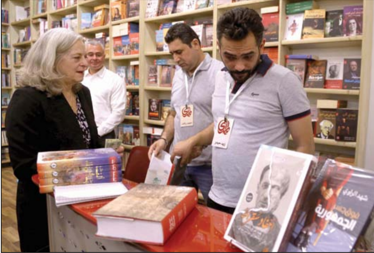
السفيرة الاميركية تزور بيت المدى للإعلام والثقافة والفنون في شارع المتنبى...

أعربت السفيرة الاميركية في العراق أيلنا رومانسكي. خلال زيارتها لبيت المدى للثقافة والفنون في شارع المتنبى امس الأحد عن سعادتها بزيارة مرفق ثقافي مهم في العراق كما ابدت إعجابها الشديد بالمكان والمكتبة وأشارت الى ان نشاطات بيت المدى الاسبوعية تعد معلماً مهماً من معالم الحياة الثقافية العراقية، واطلعت السفيرة على إصدارات دار المدى وتحدثت عن الأدب العراقي وأهميته كما أعربت عن سعادتها بقيام دار المدى بترجمة أعمال كبار ادباء امريكا مثل همفغواي وشتاينبك وفيليب روث والبس ووكر، وتمنت ان تترجم أعمال الادباء العراقيين الكبار الى الانكليزية وان تجد مكاناً لها في المكتبات الاميركية.. كما تحدثت السفيرة عن ضرورة تفعيل قوانين حقوق المكتبة الفكرية في العراق لضمان حقوق دور النشر والمؤلفين العراقيين، وقالت انها تصورت المكان مجرد مكتبة لكنها تفاجأت بروعة المكان وجماله وتنظيمه، واقتنتت السفيرة عدداً من الكتب التي تتعلق بالثقافة والأدب العراقي منها رواية المسرات والأوجاع للروائي العراقي الكبير فؤاد التكرلي وكتب عن ملحمة كلكامش.