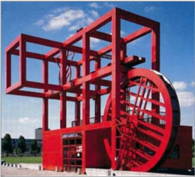
"بارك دي لا فيليت" (1998)، باريس، فرنسا، المعمار: "برنارد تشومي"، &lt;الفولي الأحمر&gt;.

النظر في ماضي الكاتب أو لإضفاء الطابع الرومانسي عليه. فقد كان رسام ونحات، ومعاصر في عصر النهضة الإسبانية. وكان عادة يوقع على لوحاته بحروف يونانية لإسمه الحقيقي دومينغوس ثيوتوكوبولس،، ولكن لم يتم الاعتراف به من قبل الملك فيليب الثاني، لذا يشعر بخيبة أمل رهيبه، ويلجأ إلى ورشته في توليدو. لكن شعوره بالمرارة لن يمنعه من رسم