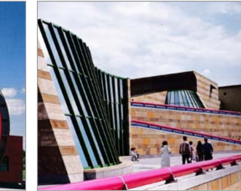
مبنى "الغاليري الحكومي" (1984) شوتغارت، ألمانيا، المعمار: "جيمس ستيرلنج"،منظور/تفصيل.

بهذه الطريقة ، يبدأ المؤلف رحلة عبر إسبانيا والزمن وكأنه مراسل عظيم ،ويرافقه القارئ ، في تحقيقه ، وهو يفتر الجدل بين رجال ونساء الفن ، ويبحث في الأرشيف ، ويتوقف في الحانات الصغيرة التي لا تزال قديمة في إسبانيا وفي طور الإخفاء.ثم تعطف القصة نحو ذكريات المؤلف ، كما لو أن هذا البحث عن موديل لرسام لامع لم يكن سوى ذريعة لإعادة