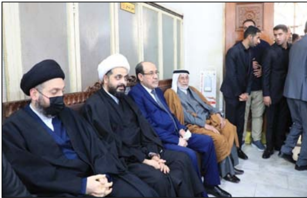
صورة تجمع خصوم الصدر في الإطار التنسيقي

وكان أنصار تشرينين قد تودعوا الشهر الماضي، في تظاهرة بمنطقة القادسية غربي بغداد، بالعودة الى تظاهرات أكبر في الذكرى السنوية للاحتجاجات. وحرص «التشارنة»، خلال الإزمة بين «الإطار» و«التيار» بالوقوف على الحيا، كما اختاروا اماكن للاحتجاج بعيدة عن مناطق تواجد الطرفين سواء بالمنطقة الخضراء او قرب الجسر المعلق.