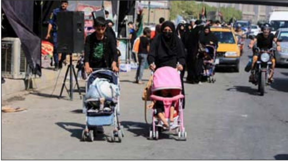
عائلة عراقية تتوجه من بغداد إلى كربلاء سيراً على الأقدام لأحياء الزيارة الاربعينية

وأوضح التقرير، أن "الفندقين شهدا تراجعاً حاداً لعدد شاغلي الغرف قبل التعافي العام الماضي ليصل إلى نسبة ٥٠٪ أقل من معدل النزلاء قبل تقييدات الوباء". وقال الكلتش، إن "معدل شغل غرف