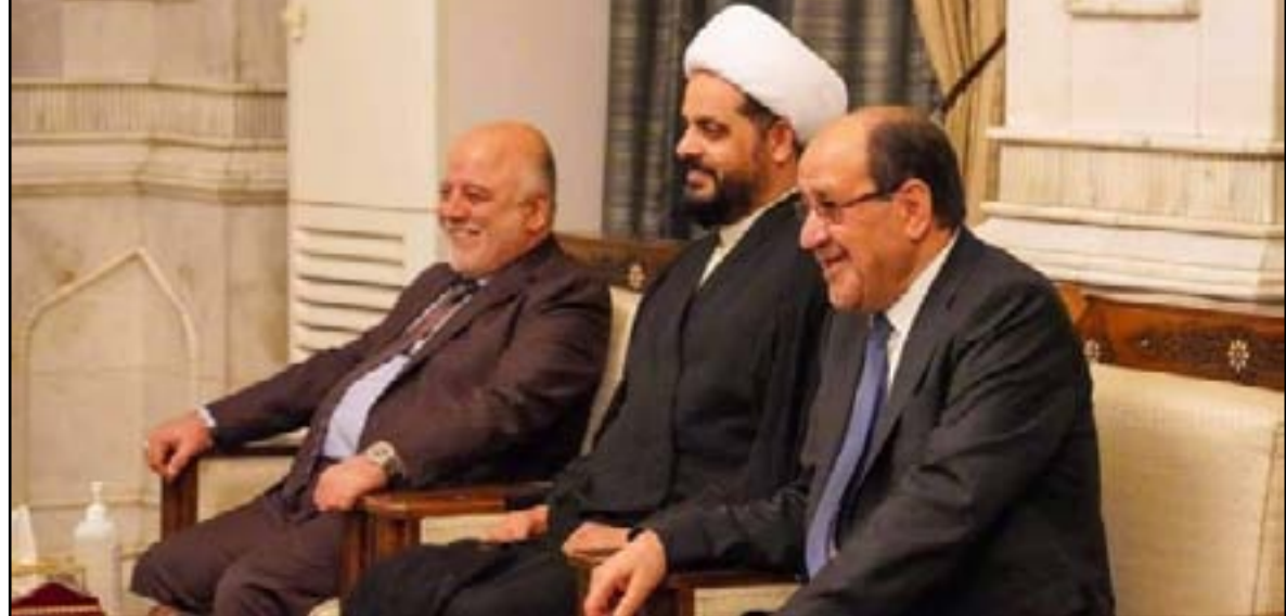
المالكي والخزعلي يحصران على عدم تلبية مطالب الصدر بخلاف العبادي