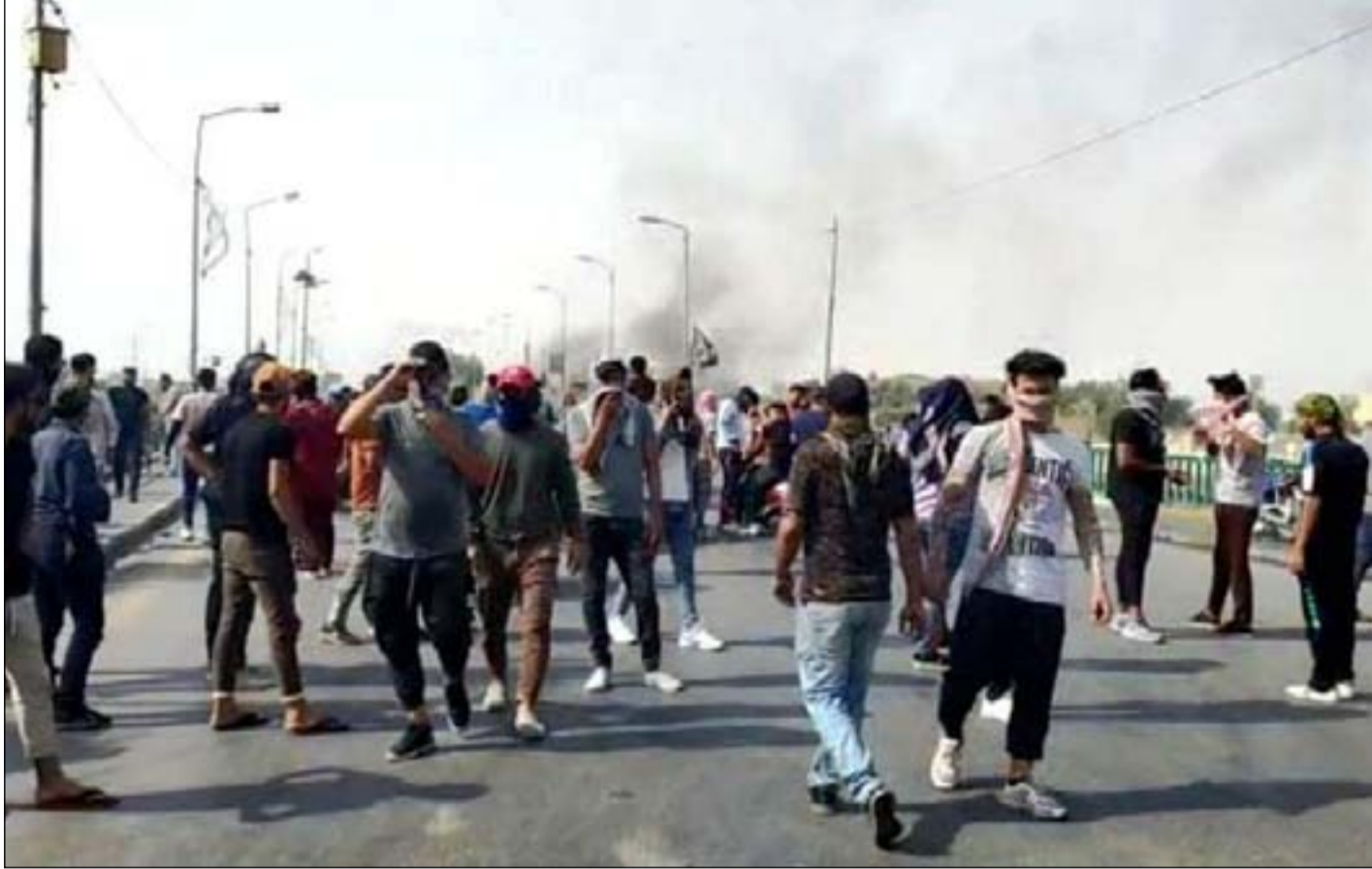
متظاهرون يقطعون جسر الزيتون وسط الناصرية

وكان النائب عن حركة امتداد حميد الشبلاوي، قد حضر اجتماعاً ضم عدداً من النواب مع مرشح الإطار التنسيقي لرئاسة الحكومة محمد شيباع السوداني وهو ما دعا الحركة الى اصدار بيان اشارت فيه الى انها لم توجه اي من نوابها بحضور الاجتماع وان النائب اتخذ قراره بصفة شخصية ولا يمثل الحركة بتواجده في الاجتماع.