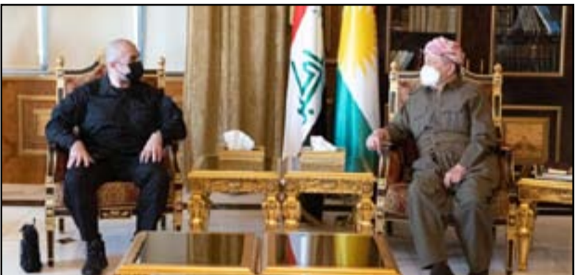
لقاء بارزاني مع طالباني قبل ايام

ملف المرشح لمنصب رئيس الجمهورية». وأكد، أن «الحزبين ليسا في عجلة من أمرهما على تسمية رئيس الجمهورية كونهما يريدان أن يصبحا عملاً مساعداً في تهيئة الأجواء المثالية أمام الحكومة المقبلة». ومضى الفيلبي، إلى أن «الحكومة تواجه تحديات كبيرة، فينبغي قبل الهضي بها وانتخاب رئيس الجمهورية أن يكون هناك حوار وطني يشمل الجميع يخرج بنتائج إيجابية وتطمينات لاسمياً للتيار الصدري من أجل إنجاز المرحلة الحالية». من جانبه، ذكر عضو الاتحاد الوطني الكردستاني معاهدة الحزب الديمقراطي الكردستاني بشأن جميع النقاط الخلافية وأبرزها موضوع المرشح لرئيس الجمهورية». وتابع الشيخ رؤوف، أن «تلك المشاورات لم تصل إلى اتفاق نهائي لغاية الوقت الحالي، لكنها مستمرة للوصول إلى مرشح مستقل». ولفت، إلى أن «الحزبين وفي حالة عدم توصلهما إلى اتفاق بشأن منصب رئيس الجمهورية فإنها سيدخلان جلسة الانتخاب كل منهما بمرشحه». وأوضح الشيخ رؤوف، أن «الطرفين حريصان على أن يتوصلا إلى الاتفاق، وقد أكدوا على استمرار الحوارات والتواصل بأمل أن نصل إلى مرشح مشترك ونحزن نبذل كل الجهود لتحقيق هذا الهدف». ويسعى الاتحاد الوطني الكردستاني لتجديد الثقة مرة ثانية برئيس الجمهورية برهم صالح، فيما قام الحزب الديمقراطي الكردستاني بترشيح ريدر أحمد خالد للمنصب. وينص الدستور على أن رئيس الجمهورية يقوم خلال 15 يوماً من انتخابه بتكليف مرشح الكتلة الأكثر عدداً بتشكيل الحكومة الجديدة.