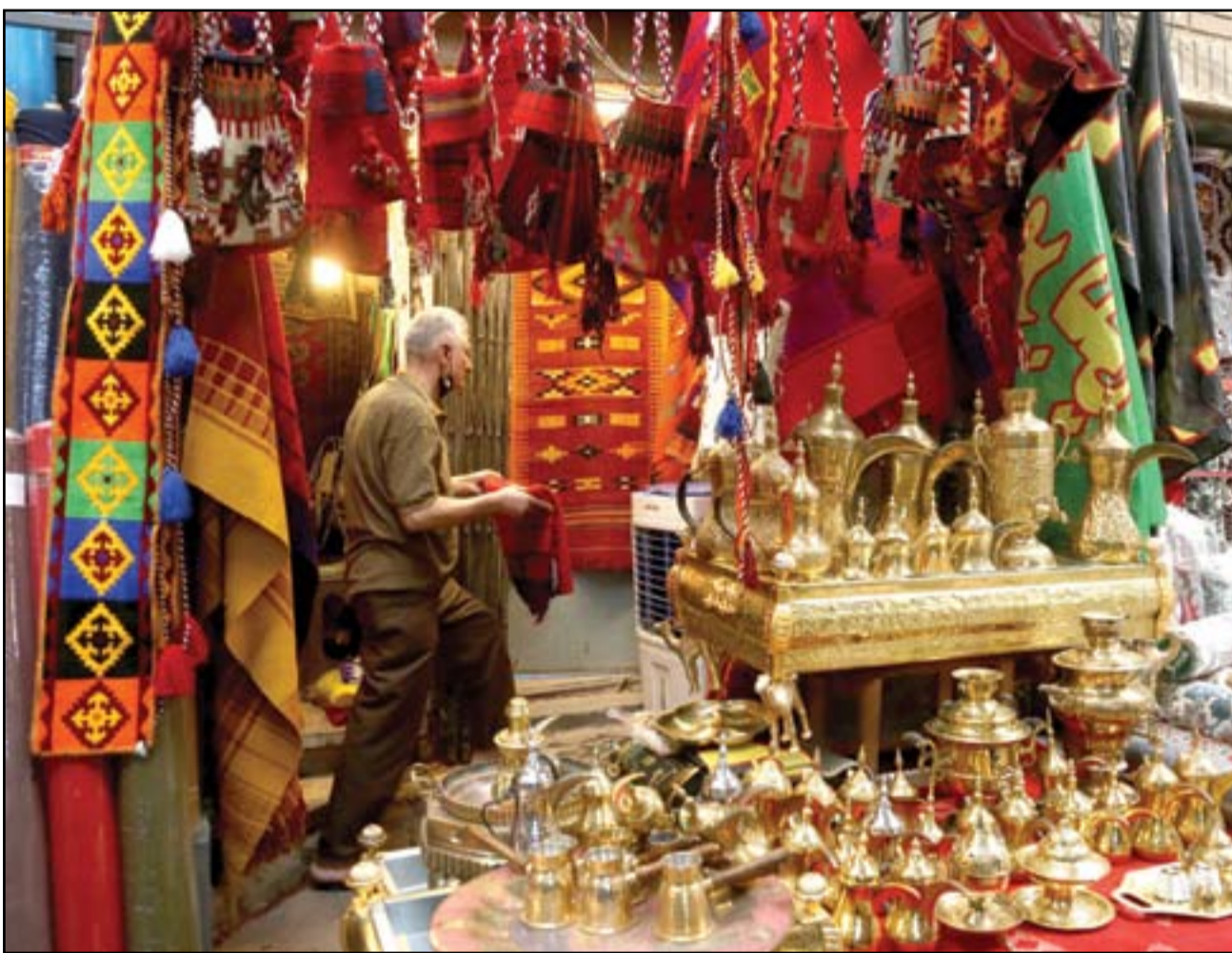
مهنه الصفاير في بغداد تعاني من الركود...