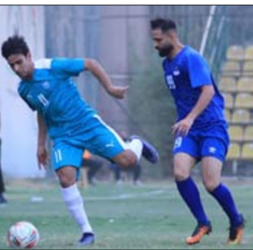
عبد الخالق أم لا؟