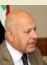
عبد الخالق أم لا؟