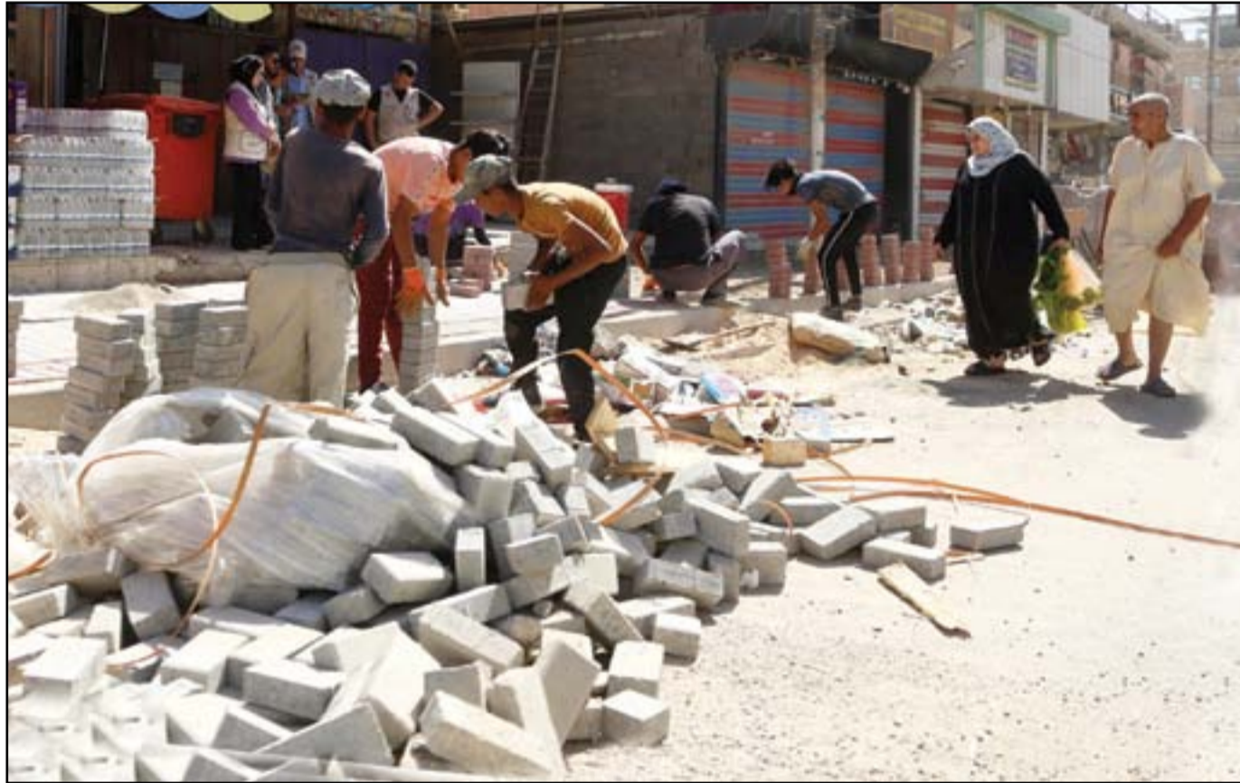
الاهمال يطال منطقة الدورة بعد تلو أعمال الصيانة وتجمع الانقاض في الازقة..