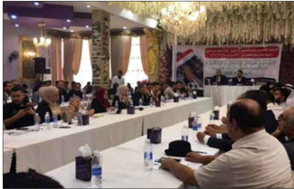
الاجتماع التشاوري لقوى الاحتجاج في الناصرية

بالمطالب الوطنية وفي مقدمتها محاسبة قتلة المتظاهرين والكشف عن مصير المغييبين، والاهتمام بعوائلهم". ودعا، إلى ضرورة "محاسبة الفاسدين وحصر السلاح بيد الدولة، وضمان استقلالية القضاء، وتطبيق قانون الأحزاب واصلاح المنظومة الانتخابية لتكون حرة ونزيهة تعكس ارادة العراقيين". وتحدث البيان، عن "أهمية تشكيل جبهة سياسية من القوى المؤمنة بالتغيير الديمقراطي، تكون بديلاً سياسياً حقيقياً، قوامها الأحزاب والشخصيات التي لم تتورط بالأزمة والدم العراقي الطاهر والفساد". وطالب، بـ "الدعم الكامل للاحتجاج السلمي المعارض للسلطة الفاسدة الهادف للتغيير في الذكرى السنوية الثالثة لثورة تشرين". ولفت البيان، إلى أن "لغة التسقيط والتخوين لغة دفننا ثمنها غالبا ولذا ندعو الفاعلين الى الحكمة في رمي المصندين بما ليس فيهم". وأكد، "الدعم التام لعوائل الشهداء والمغييبين والمعتقلين زوراً في المحافظات الغربية، وإعادة التازحين الى مناطقهم المنزوعة