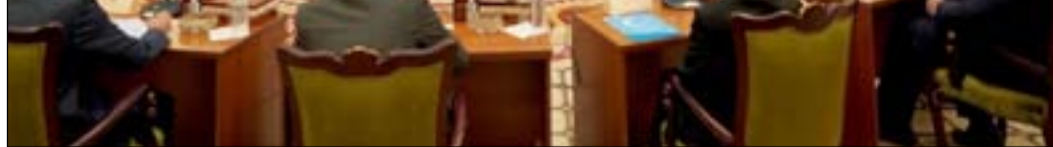
جهود كبيرة لاقتحام التيار الصدري بالعودة الى طاولة المفاوضات

ويواصل، أن "القوى السياسية في العراق والاتفاق على تشكيل الحكومة، ورغم نجاح الانتخابات في توفير بيئة سياسية جيدة، ودعت حكومتنا إلى خلق انسداد سياسي، ودمت حكومتنا إلى