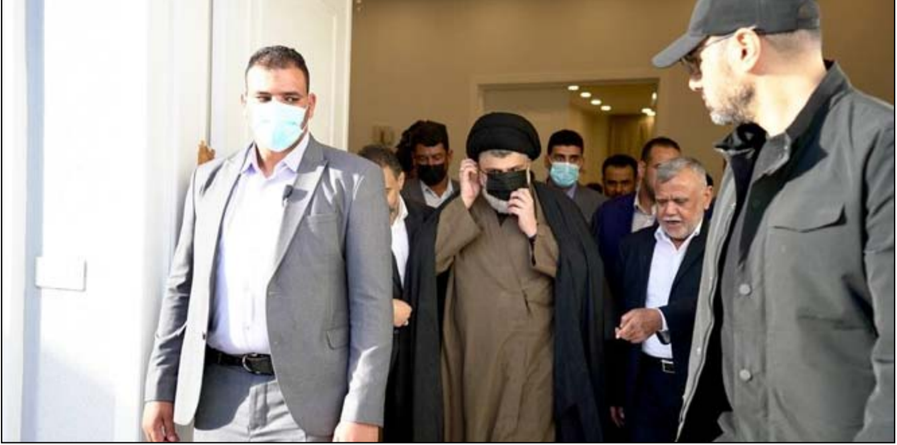
ترقب كبير للقاء جمع الصدر مع الحليوسي وبارزاني والعامري

رئيس الوزراء من قبل الإطار إذا كان الحل باعتدال». وزاد الخزعلي، أن «كل ما يطلبه التيار سيجد تجاوبا من الإطار لمناقشته والإطار منفتح على التيار الصدري وهو متجاوب معه لتجاوز الأزمة السياسية». ويخشى «الإطار» من تعطيل مساعيه لاستئناف جلسات البرلمان بالتزامن مع الذكرى السنوية الثانية لانطلاق احتجاجات تشرين. وتوعدت مجموعة تطلق على نفسها اللجنة المركزية الخاصة بتحضير تظاهرات الأول من تشرين الأول المقبل، باقتحام المنطقة الخضراء. وقالت المجموعة في بيان مصور ان خطوتهم المقبلة ستكون «يوم 10/1 بالتجمع عند ساحة النسور، غربي بغداد، في الساعة 11 صباحا، ثم اقتحام الخضراء من البوابة القريبة من الساحة».