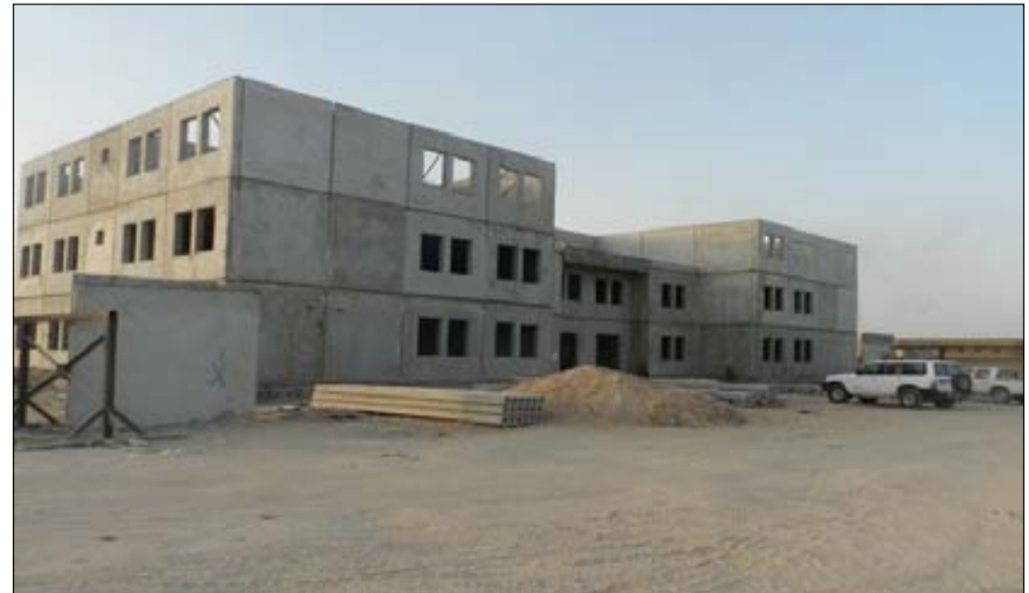
العراق يعاني من عجز كبير في مشاريع الابنية المدرسية

للإصلاح الاقتصادي في البلاد". ومضى المرسومي إلى الدعوة لإعادة النظر بالعدد لأن الهدر في المال العام كبير ونسبة الأرباح التي حصلت عليها الشركات الصينية غير مبرر في حين أن العمل والتنفيذ والتصميم والاموال عراقية". وذكرت مصادر حكومية، أن "اللجنة العليا لبناء المدارس، تشكلت برئاسة رئيس مجلس الوزراء مصطفى الكاظمي، وصدر عن اللجنة، القرار رقم (٢ لسنة ٢٠٢٠) الخاص ببناء (١٠٠٠) مدرسة نموذجية، ضمن الاتفاقية الإطارية (العراقية - الصينية)". وأضافت المصادر، أن "اللجنة برئاسة الأمين العام لمجلس الوزراء، عقدت العديد من الاجتماعات واللقاءات؛ من أجل وضع خطة ملائمة لإعداد التصاميم النموذجية الخاصة بإنشاء المدارس". ونوه، إلى أن "الأمين العام لمجلس