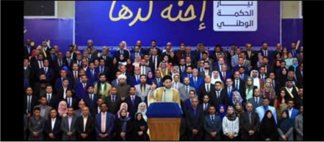
أحد المؤتمرات الانتخابية لتيار الحكمة