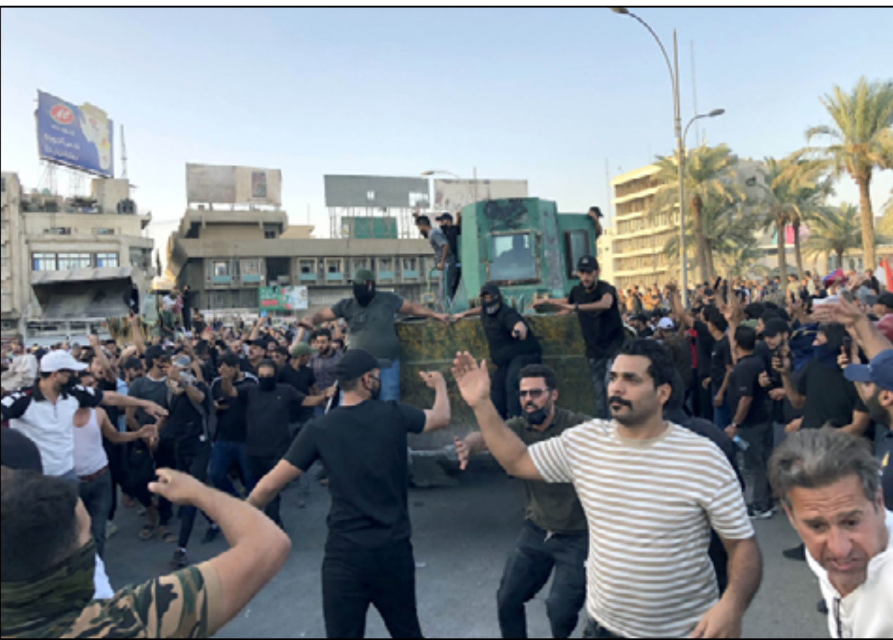
تظاهرات في ساحة التحرير تسبق الأول من تشرين ...