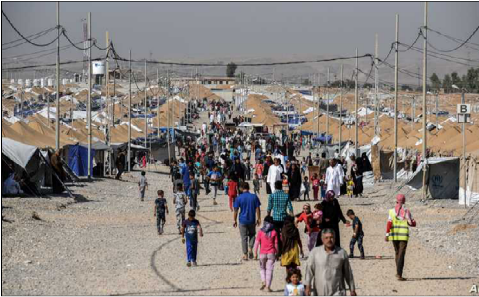
معاناة جديدة تنتظر النازحين مع قرب حلول فصل الشتاء

وكشف التقرير ان "نسبة 96٪ من مواقع النزوح غير الرسمية نزحت إليها غالبية العوائل قبل حزيران 2017 وهي حالة نزوح مزمنة مضى عليها أكثر من خمس سنوات، اما في محافظة نينوى فان نسبة 61٪ من العوائل النازحة في مواقع غير رسمية تم تهجيرها في آب 2014 ونسبة 39٪ أخرى تم تهجيرها ما بين تشرين الأول 2016 وحزيران 2017".