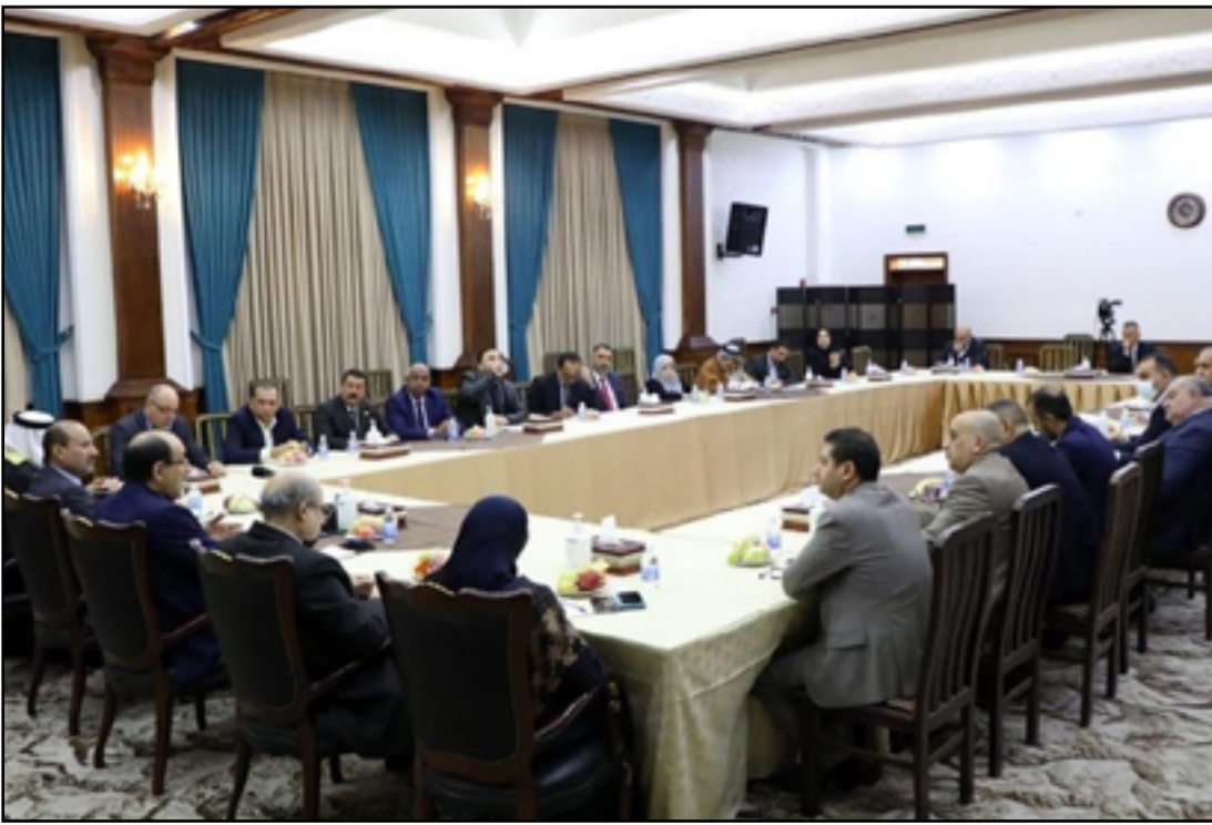
كثلة المالكي من أبرز المعارضين لاجراء الانتخابات المبكرة

مباشر بين السودانى وزعيم التيار الصدري مقتدى الصدر بشأن الحكومة المقبلة». ويتوقع السعداوي، أن «إقدام الصدر على خطوة باستضافة السوداني من أجل الإستماع إلى برنامجه الحكومي يعدّ طريقاً مناسباً لإقناعه والعدول عن موقفه السابق». ولفت، إلى أن «قسماً من مقربي الصدر قد يوصلون له معلومات غير صحيحة، ولذا ينبغي أن يكون هذا اللقاء مع السوداني بنحو مباشر من دون وسيط». وانتهى السعداوي، إلى أن «الأطراف السياسية عليها أن تتعدع عن الحوار غير المباشر والاعتماد على وسائل الإعلام في إيصال خطاباتها وأن تلجأ إلى طاولة المباحثات ليستمع كافة للبرنامج الحكومي». وما زال الحزبان الكرديان، الاتحاد الوطني الكردستاني والديمقراطي الكردستاني يواصلان الحوار بشأن الوصول إلى اتفاق على مرشح واحد لمنصب رئيس الجمهورية».