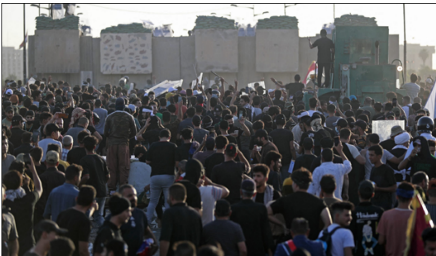
متظاهرون يقفون أمام جسر الجمهورية يوم السبت الماضي

السبت، بعد ساعات من تراشق الحجارة و«المولوتوف» بين الطرفين. وتذبذب حصيلة الجرحى بين صفوف المتظاهرين، حيث وصلت الى نحو 200 على إثر الإختناق وإصابات بالحجارة، بحسب ناشطين. بالمقابل ان الإحصائية الرسمية التي صدرت عن خلية الاعلام الحكومي، تحدثت عن نحو 30 اصابة بين عسكري ومدني. وقالت خلية الاعلام انها اعتقلت من وصفتهم بـ«المندسين» كانوا يرمون القوات الامنية بالكرات الزجاجية. وتجمع الآلاف صباح السبت في ساحتي التحرير وسط بغداد، والنسور غربي العاصمة للمطالبة بمنع تشكيل حكومة على مقاسات الاحزاب، ومعاينة قتلة تشرين. وكان رئيس الوزراء مصطفى الكاظمي قد أعلن عقب فض الاحتجاجات، بان حكومته قامت بتلبية مطالب تظاهرات سيناويوهات غير متوقعة مازال الأخير يروج لفكرة «اليد الممدودة» في خطابه مع الصدر. وكسر الصدر أمس، شيئاً من سكوتة السياسي المستمر منذ نحو شهر، وإعادة ترديد عبارته الشهيرة «الشرقية ولاغربية» في تغريدة بمناسبة اليوم الوطني. وكان قد أعلن الإطار التنسيقي في الاسبوع الذي سبق تظاهرات احياء الذكرى السنوية الثالثة لتظاهرات تشرين، بشكل غير رسمي عن ائتلاف جديد يضم كل القوى السياسية باستثناء الصدر. ويقول سياسي شيوعي مقرب من «الإطار» في حديث مع (المدى) ان «انتهاء تظاهرات السبت فيها دلالات على عدم وجود معارضة لتشكيل حكومة محمد السوداني». واستخدمت القوات الامنية قنابل صوتية ومسيلة للدروع بتفريق المتظاهرين في ساحة التحرير مساء