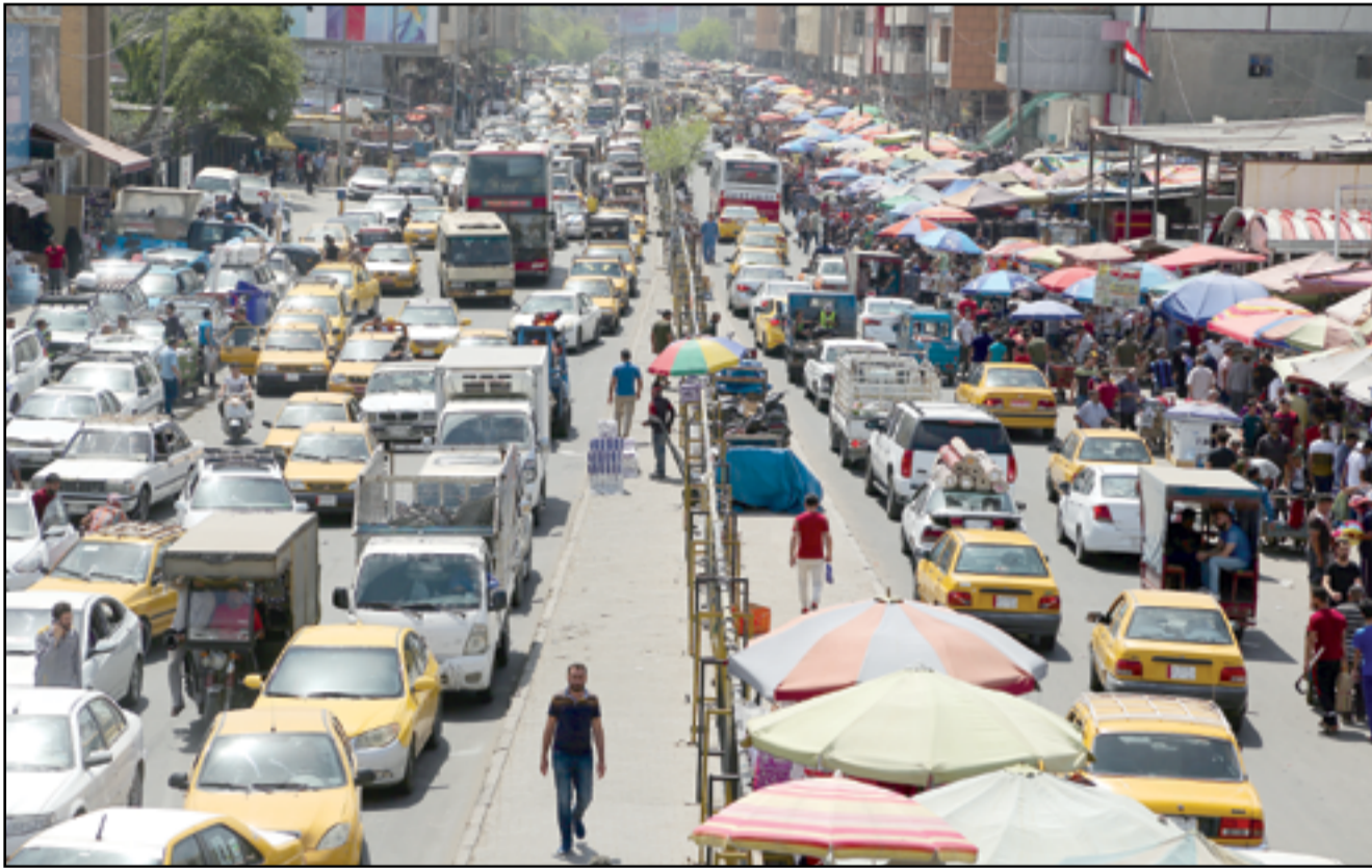
المناطق المحيطة بجسر الجمهورية المغلق بالصبات تخنق بالزحام المروري.. عدسة: محمود رؤوف