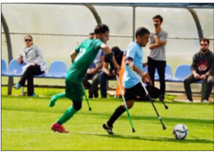
بينما تواجه البرازيل منتخب بولندا تقابل اليابان منافستها تنزانيا، وتحتّم المواجهات بقعة أصحاب الأرض المنتخب التركي مع نظيره المكسيكي.

ويلعب المغرب أمام الأرجنتين في ثمن النهائي، بينما تواجه أمريكا منتخب هايتي، وتلعب أوزبكستان مع كولومبيا، وتلتقي إيران مع أيطاليا، فيما تقابل أنغولا منتخب إنكلترا.